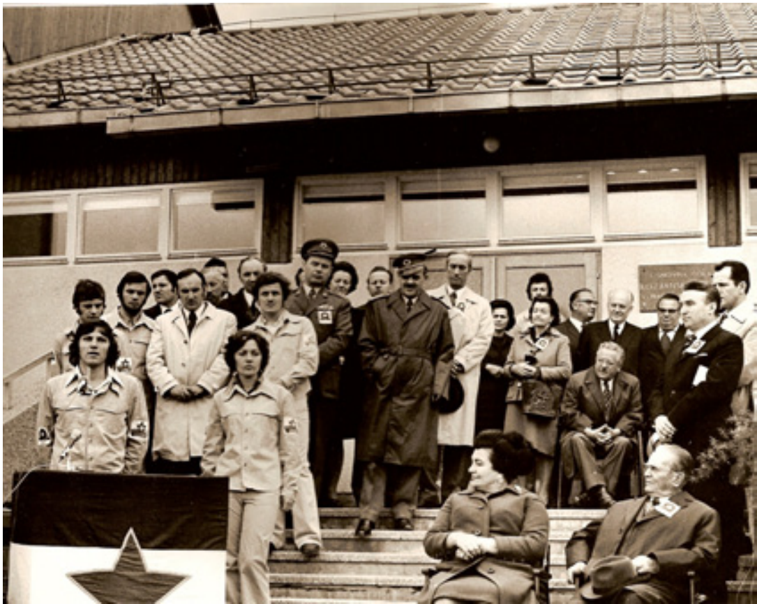
slika 17: TITOV OBISK NA PLANINI (leta 1974 )

Med njegovim predsednikovanjem jih je leta 1974 obiskal tudi predsednik Jugoslavije – Josip Broz Tito. Ogledal si je tudi na novo zgrajeno cesto od Celja do Dramelj.