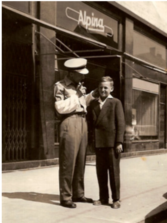
slika 9: HONORARNA ZAPOSLOVANJE (leta 1958)

Leta 1958 je od okrajne zveze dobil štipendijo in bivanje v Ljubljani je bilo lažje.