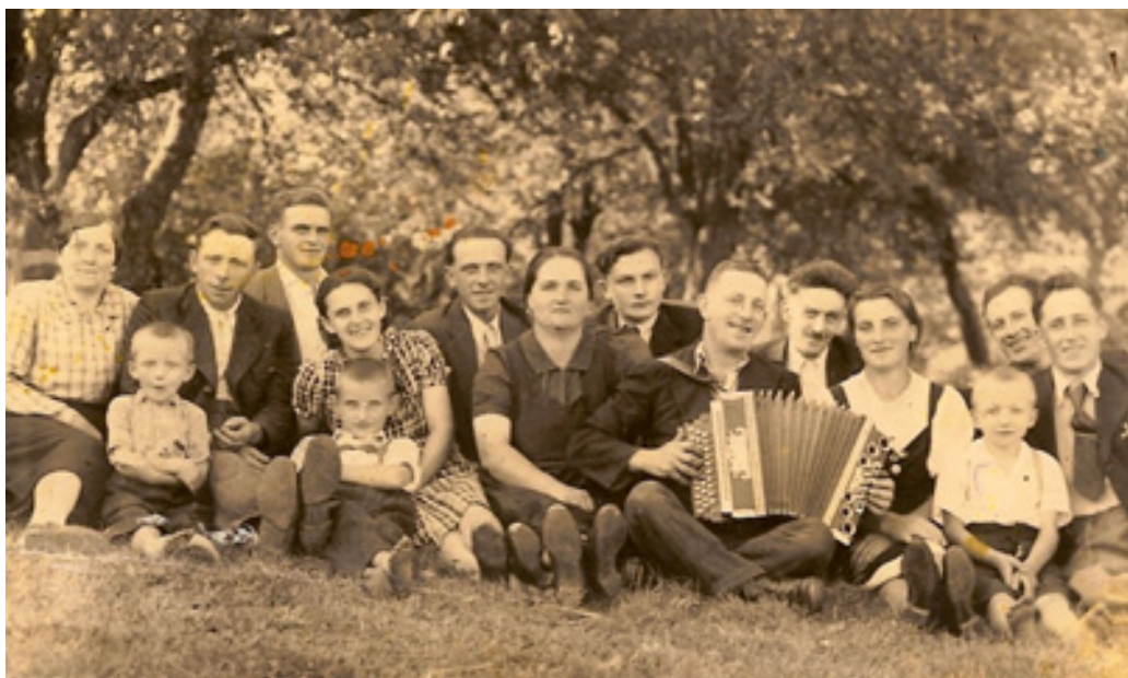
slika 4: DEL OČETOVE DRUŽINE (leta 1940 – prvi z desne v prvi vrsti)