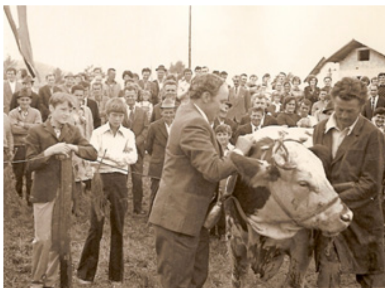
slika 14: RAZSTAVA PLEMENSKE ŽIVINE V ŠENTJURJU (leta 1966)

V tem času so v Šentjurju organizirali tudi razstavo plemenske živine, ki je bila zelo odmevna. Obiskoval je tudi posamezne kmete in jih navduševal za uvajanje novitet, ki bi olajšale in izboljšale njihovo delo.