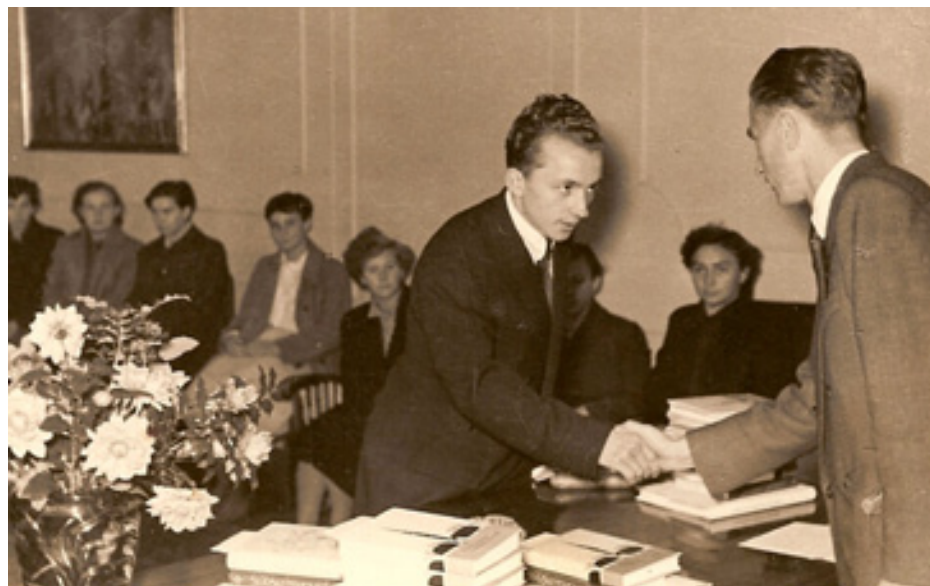
slika 48: MED PREJEMANJEM KNJIŽNE NAGRADE (leta 1955)

Prvo nagrado je prejel že leta 1955, ko je, kot vsestransko prizadeven dijak, za nagrado dobil knjigo Slava vojvodine Kranjske.