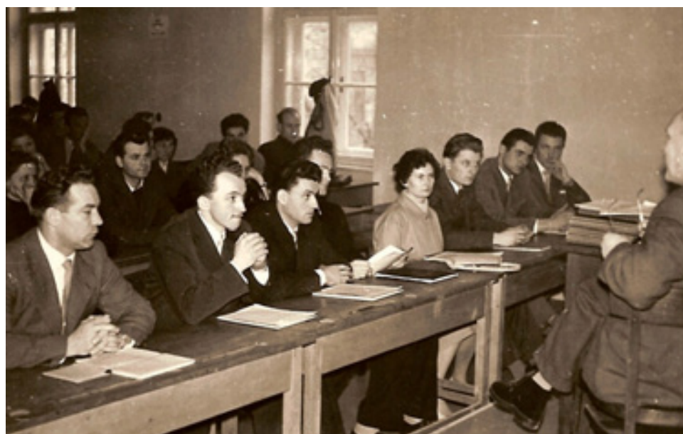
slika 12: ZAGOVOR DIPLOME (12. 3. 1960 – drugi z leve)

Kljub rednemu delu pa je bil tudi zelo dober študent. Študij je končal v štirih letih in pol, kot prvi v letniku. Njegova povprečna ocena pa je bila več kot 9.