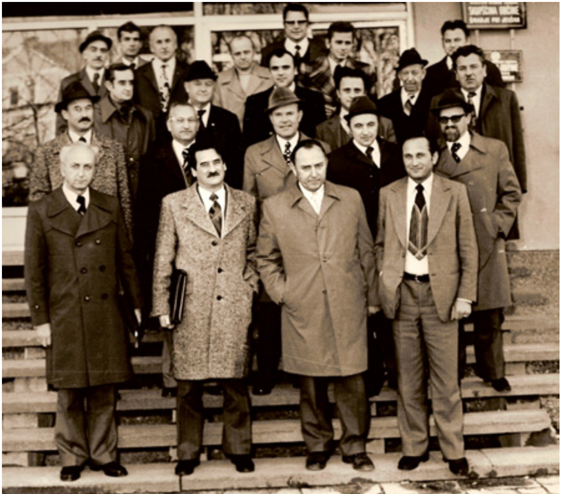
Slika 15: ODBOR ZVEZNE SKUPŠČINE ZA KMETIJSTVO (leta 1972 – drugi z desne v drugi vrsti)

Med tem je bil od leta 1967 do leta 1974 neprofesionalni zvezni poslanec Gospodarskega zbora Zvezne skupščine. V Sloveniji je bilo šest poslancev Zveznega gospodarskega zbora, ki so bili izvoljeni v posameznih regijah. Vsa vprašanja, povezana z gospodarstvom, so se reševala na zveznem nivoju, v Beogradu. Poslanci Slovenije pa so se vedno prej sestali v Ljubljani, kjer so uskladili interese, ki so jih potem zastopali v Beogradu, kjer so imeli sestanke dvakrat mesečno. Vključevali so področja kmetijstva, industrije, obrti in vodnega gospodarstva.