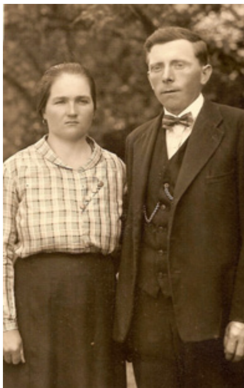
slika 2: OČE IN MATI ( leta 1936)

Jože Bučer se je rodil 20. marca 1935 v Zagaju 7 na Ponikvi pri Grobelnem kot drugi otrok očetu Leopoldu in materi Mariji, rojeni Gaber.