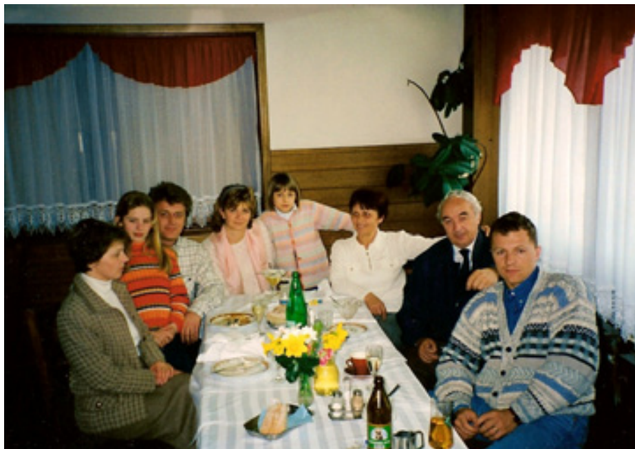
slika 34: DRUŽINSKO PRAZNOVANJE (leta 1997)