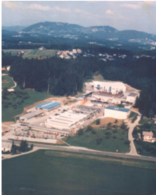
slika 18: ETOL – IFF- POSNETEK IZ ZRAKA (leta 1990)

Podjetje se je leta 1946 preimenovalo v Tovarno eteričnih olj ETOL Celje. Leta 1972 pa so z multinacionalno International Flavors & Fragrances (IFF), ki je imela sedež v New Yorku, sklenili pogodbo o skupnih vlaganjih. Podjetje se je preimenovalo v ETOL-IFF, Tovarna arom in eteričnih olj.