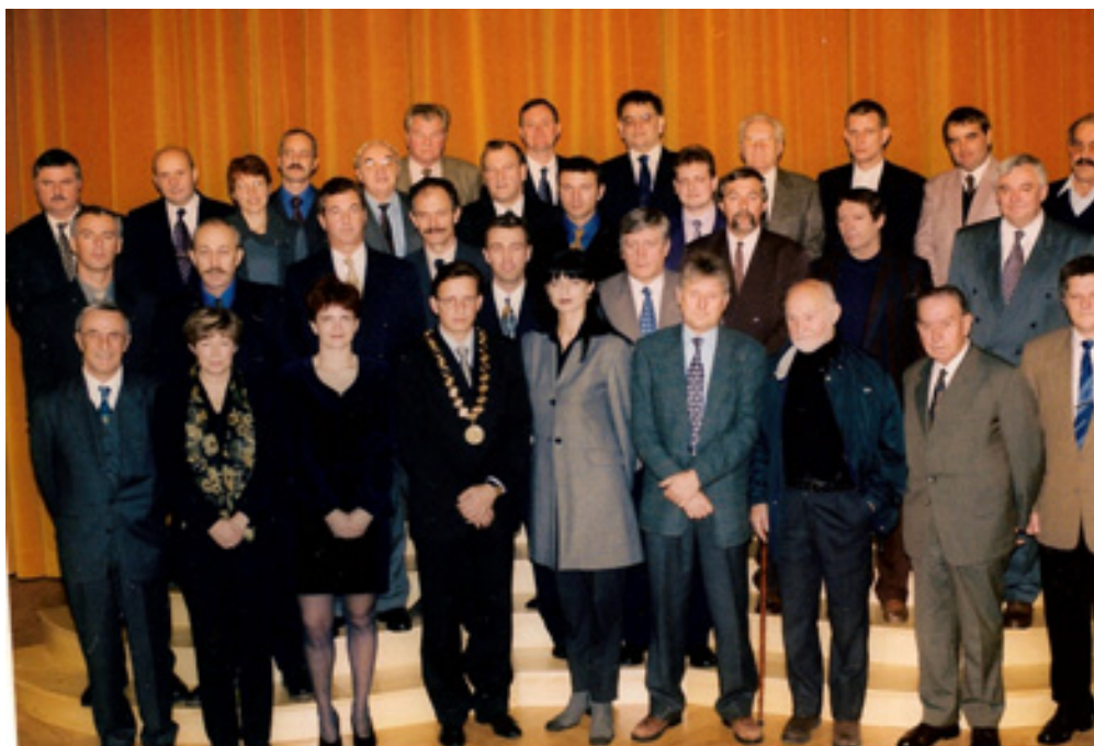
slika 36: MESTNI SVETNIKI 1998 – 2002 (leta 1998)

Bil je član Izvršnega sveta občine Celje in že leta 1994 postal mestni svetnik, kot predstavnik Desusa – Demokratične stranke upokojencev. Sedaj mu teče že tretji mandat.