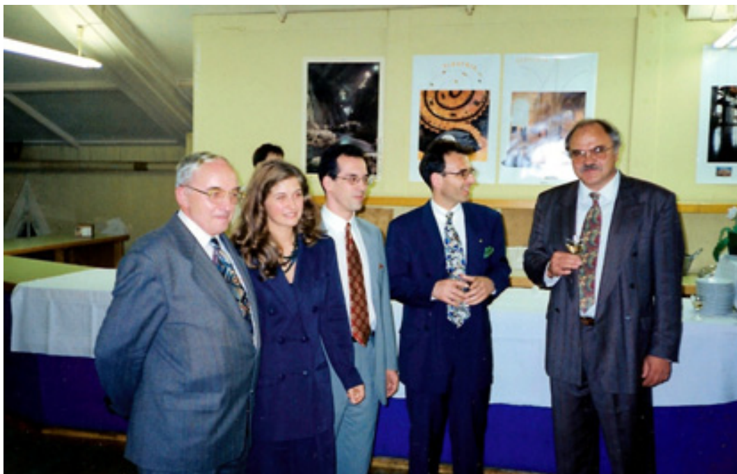
slika 50: OBISK ŽUPANA OBČINE SINGEN IZ NEMČIJE (leta 1996)

Ker se njegov ustvarjalni duh ni umiril niti v času upokojitve, je za svoje prizadevno delo med društvi upokojencev dobil tudi več priznanj: leta 2002 plaketo Zveze društev upokojencev Celje, leta 2005 pa plaketo Zveze društev upokojencev Slovenije (formalna podelitev bo 31. 3. 2006 - na občnem zboru društva upokojencev v Narodnem domu Celje).