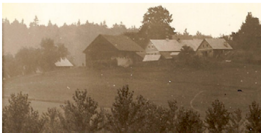
slika 3: STARA DOMAČIJA (leta 1950)