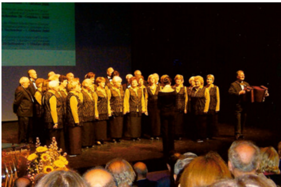
slika 35: UPOKOJENSKI PEVSKI ZBOR – NASTOP V CANKARJEVEM DOMU NA KONGRESU DRUŠTEV UPOKOJENCEV EVROPE (sodelovalo je 29 držav) (leta 2005)