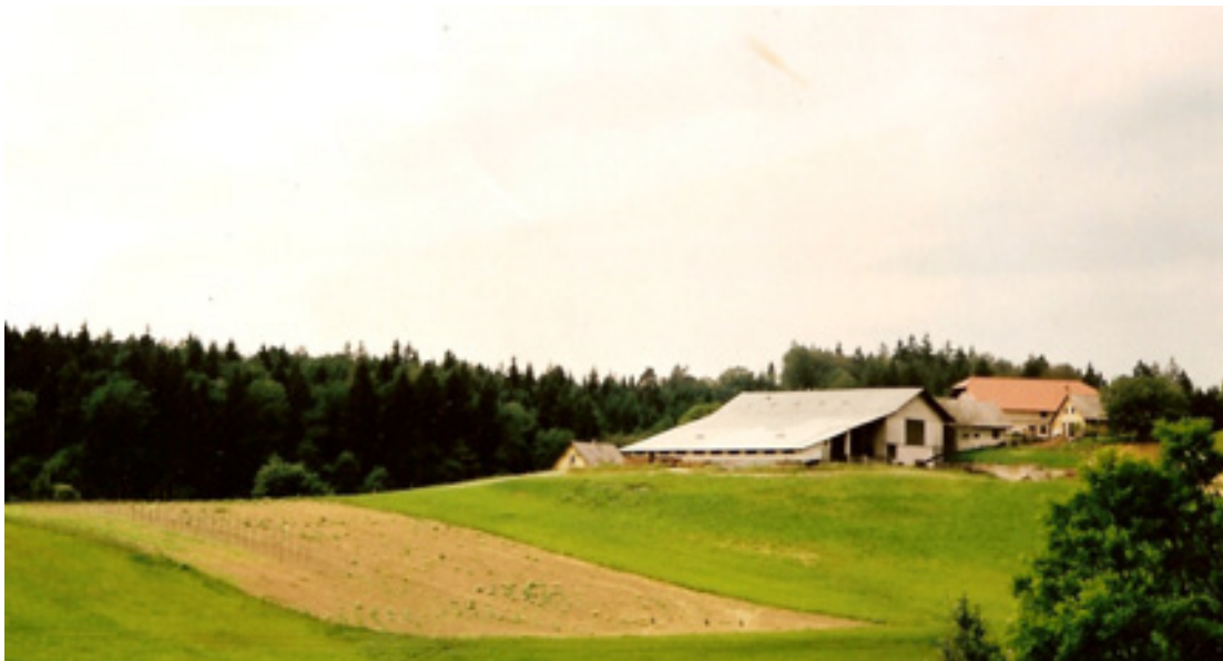
slika 24: DOMAČIJA DANES (leta 2003)

Jože še danes rad obiše sorodnike, ki skrbijo za njegov nekdanji dom. Razkazal pa ga je tudi nam.