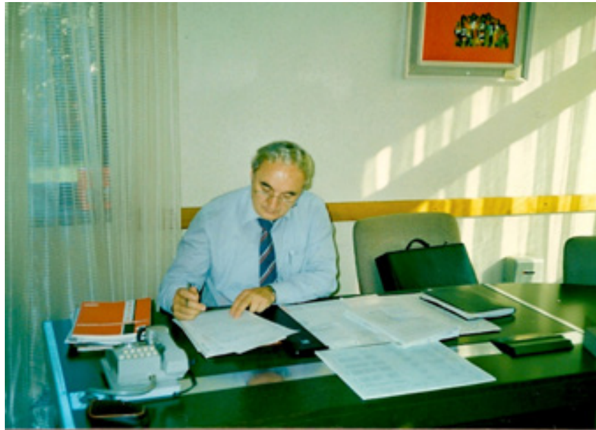
slika 19: NA DELOVNEM MESTU V ETOLU (leta 1990)

pravi smeri delovanja. Radi so ga imeli, ker je vedno vse povedal v obraz in ni rad ovinkaril. Tudi če se je z nekom hudo sporekel, ga je naslednji dan lepo pozdravil oziroma mu odzdravil in ni bil zamerljiv. Trdno pa je stal za tistim, v kar je bil prepričan.