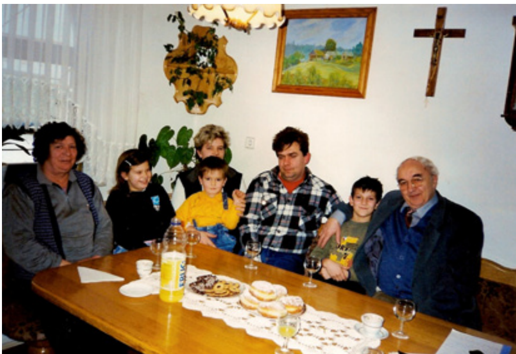
slika 25: NA OBISKU PRI NEČAKOVI DRUŽINI (leta 2006) (prva z leve je bratova žena)

Jože še danes rad obiše sorodnike, ki skrbijo za njegov nekdanji dom. Razkazal pa ga je tudi nam.