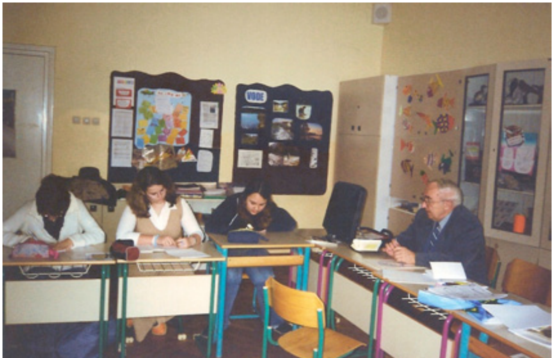
Slika 53: RAZISKOVALKE PRI DELU (leta 2006)