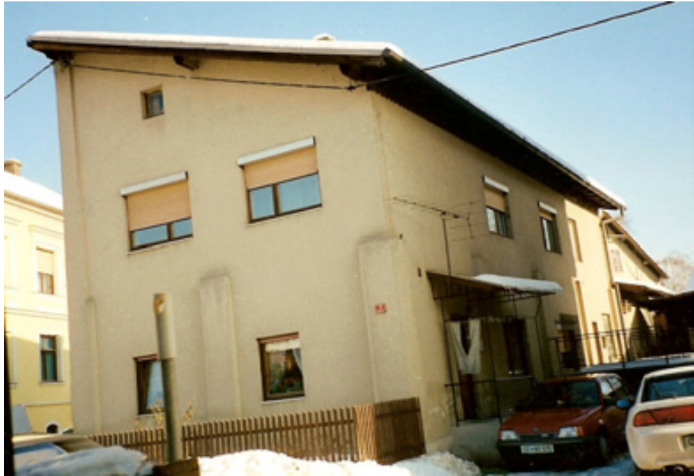
slika 26: NOVI DOM V CELJU (leta 1985)

Leta 1969 so se preselili v Celje, v Oblakovo ulico številka 7.