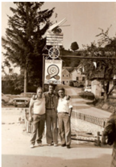
slika 16: »BRIGADIRJI« NA MLADINSKI DELOVNI BRIGADI (leta 1976 – prvi z leve)

Sodeloval je tudi pri mladinskih delovnih brigadah Kozjansko, kjer so poskrbeli za nov vodovod, ceste, telefonsko napeljavo.