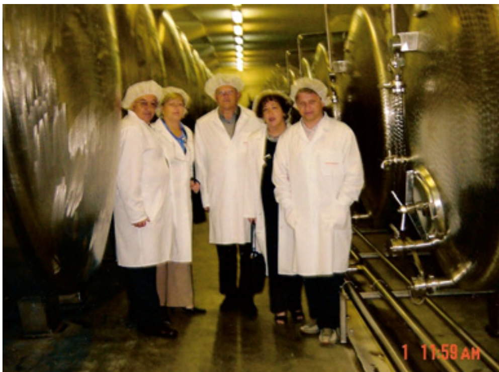
slika 46: MESTNI SVETNIKI V ETOLU (leta 2005)

Na ogled proizvodnje v tovarno Etol Celje pa je popeljal kolege mestne svetnike. Tako je koristno združil preteklo in sedanjo dejavnost.