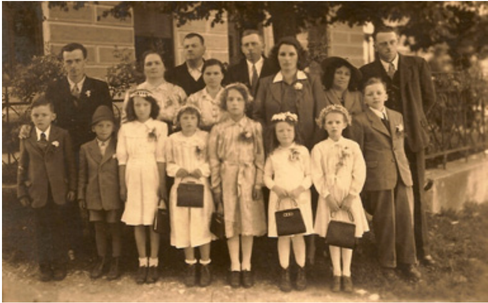
slika 6: PRI BIRMI ( leta 1947 – prvi deček z desne)

V času vojne so imeli doma partizansko javko in partizani so pogosto prenočevali pod tramovi v seniku. Nemci so jih večkrat obiskali, a partizanov niso nikoli našli.