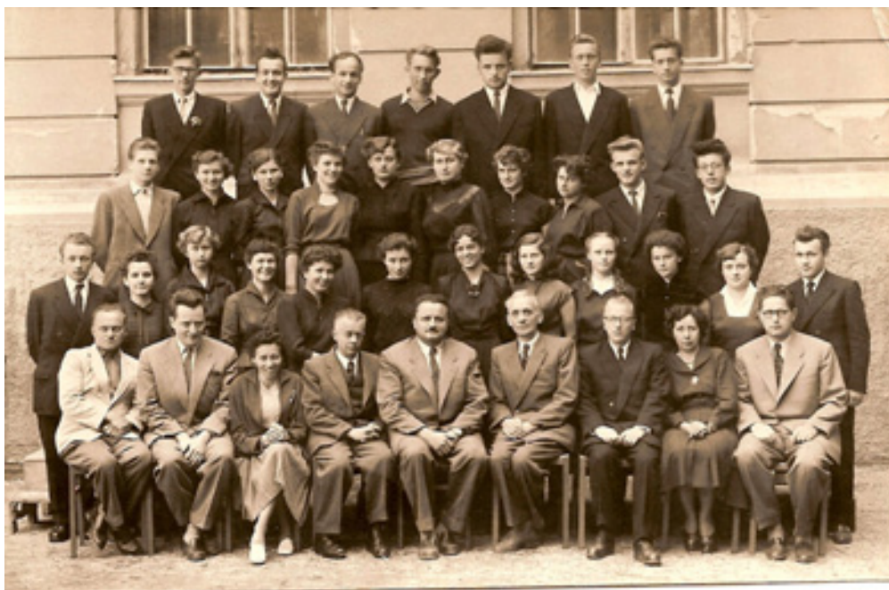
slika 8: PO MATURI (leta 1955 – stoji prvi z leve v drugi vrsti)

Sanjal je o tem, da se mu bo končno uresničila želja po študiju veterine, a je bila takrat najbližja veterinarska fakulteta v Zagrebu. Ker doma ni bilo dovolj finančnih sredstev za študij v drugi republiki, štipendije pa ni dobil, se je odločil za študij agronomije v Ljubljani (danes Biotehniška fakulteta).