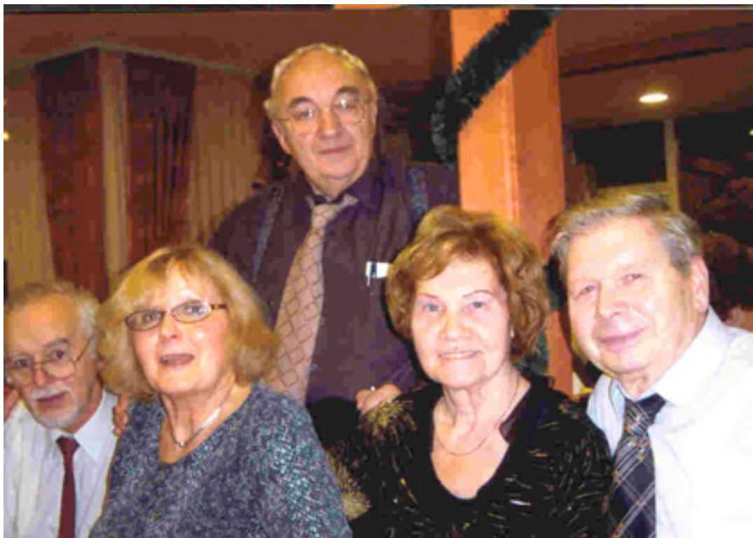
slika 39: NOVOLETNO SREČANJE UPOKOJENCEV (leta 2005)

posnemali tudi mi podobno, ko gre za našo generacijo. Pravijo, da dobra dela bog poplača!«