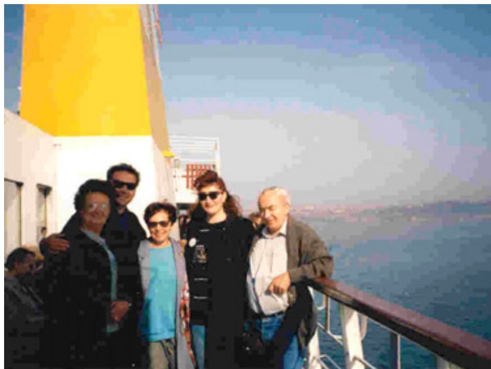
slika 30: NA POTOVANJU – MARMORNO MORJE (leta 1993 – prvi z desne)