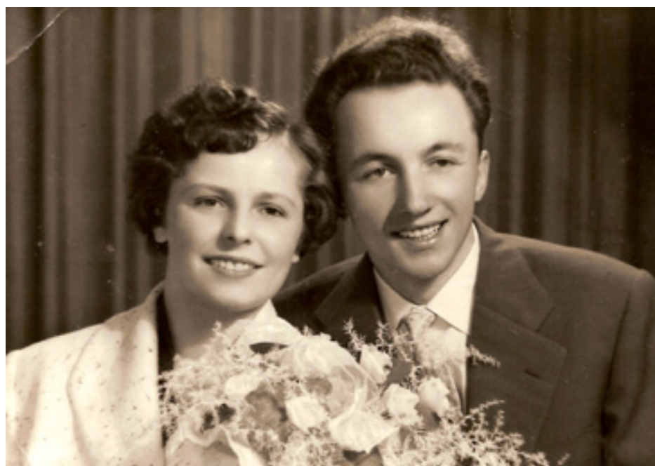
slika 22: POROČNA FOTOGRAFIJA (26. 4. 1958)