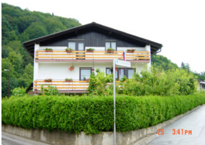
slika 32: NOVI DOM NA POLULAH (leta 1996 )