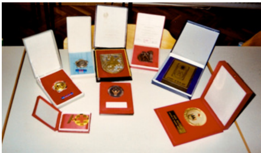
slika 51: PLAKETE (leta 2006)

Našteli smo le nekaj pomembnejših priznanj, ki jih je prejel. V njegovi zbirki so tudi različne zahvale in priznanja mnogih organizacij in društev, ki jih je prejel za nesebično pomoč pri njihovem delovanju.