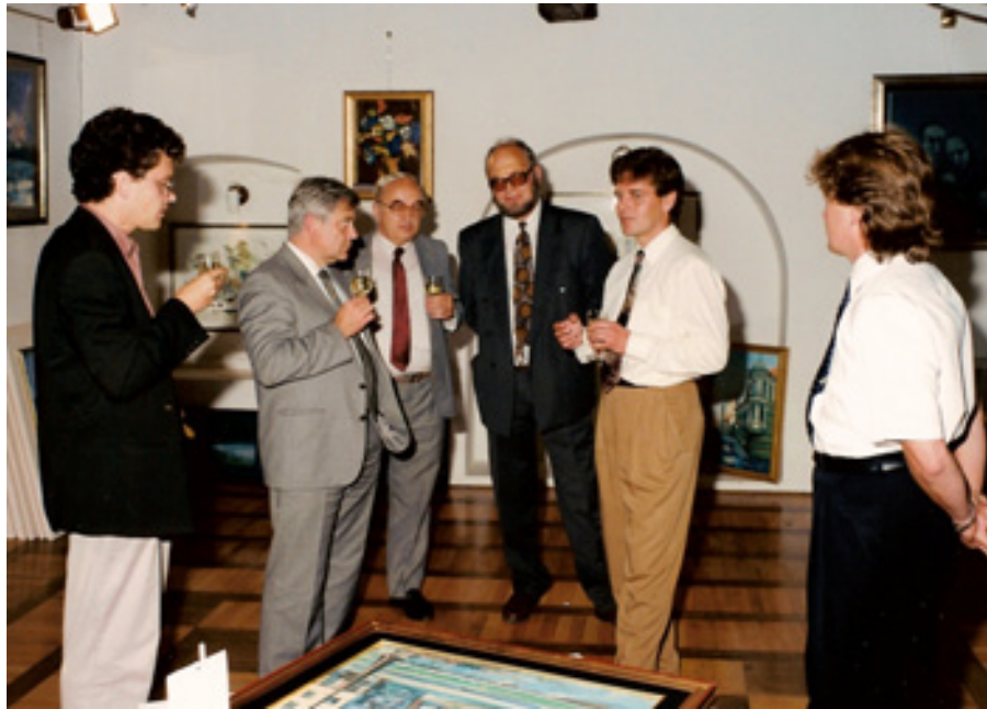
slika 21: MED SPREJEMOM GOSPODA MILANA KUČANA (leta 1987 - tretji z leve)

Med službovanjem v tovarni Etol Celje je bil, v obdobju od leta 1984 do leta 1988, podpredsednik Skupščine občine Celje.