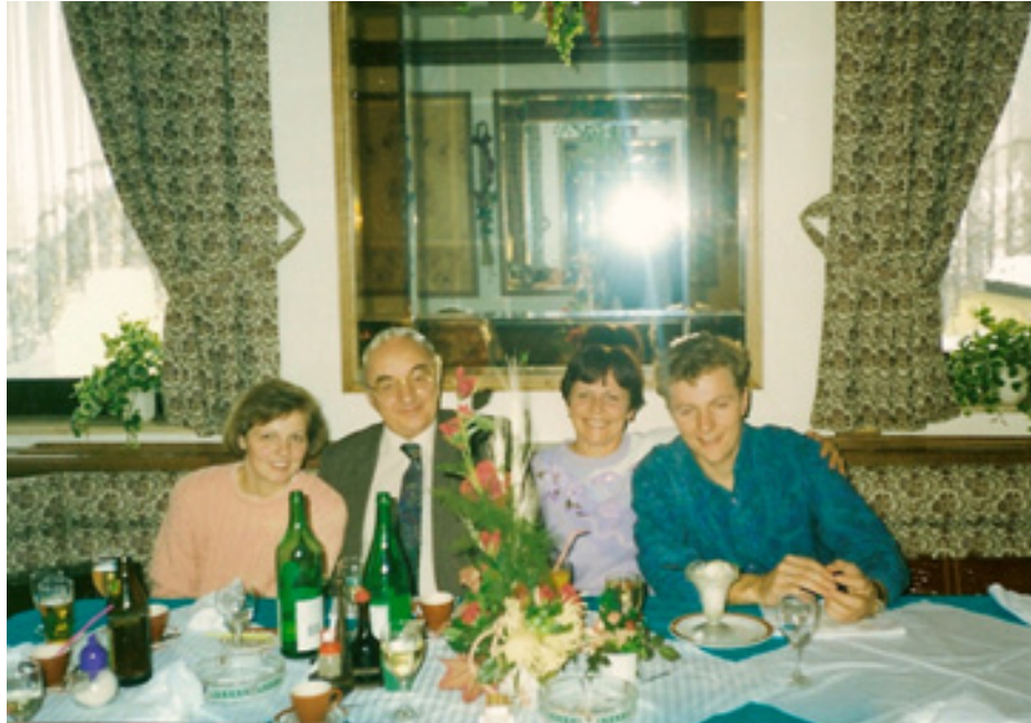
slika 33: NA PRAZNOVANJU Z OTROKOMA (leta 1992)

Kljub temu, da imata otroka svoji družini, je njihov odnos še vedno trden. Pogosto se srečujejo. Enkrat tedensko spišejo obvezno skupno kavico in malo poklepetajo o aktualnih dogodkih, ob praznikih pa imajo skupna kosila, ki se jih radi udeležita tudi obe vnukinji – Mojcini hčeri, ki danes že obiskujeta srednjo šolo oziroma študirata.