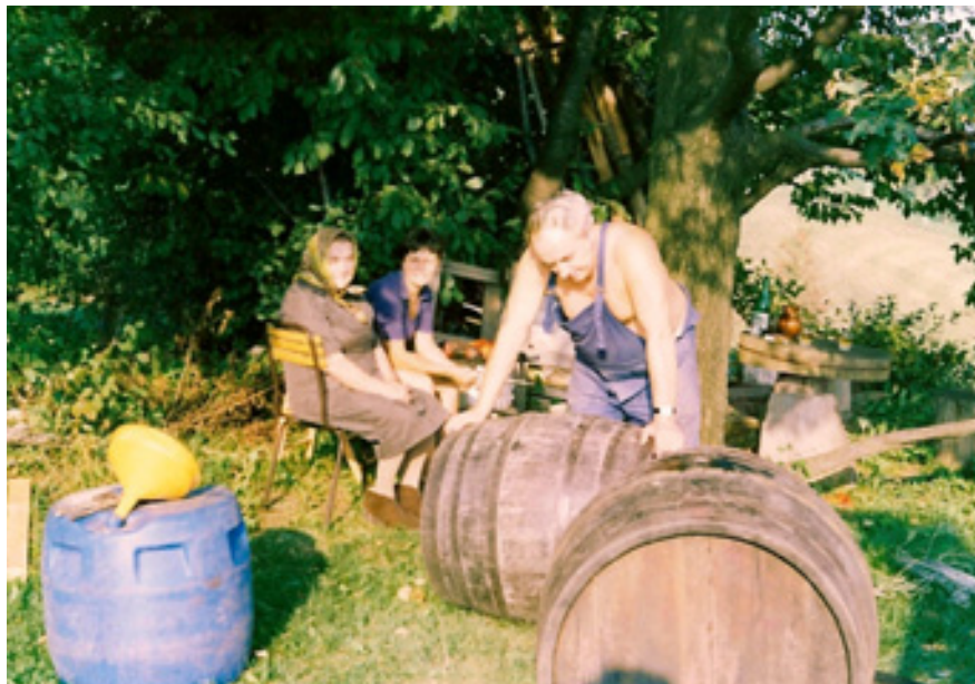
slika 42: PRIPRAVE NA TRGATEV V VINOGRADU (leta 1983 )