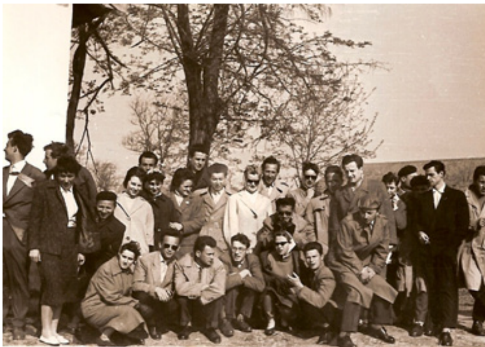
slika 11: AGRONOMI NA EKSKURZIJI V NOVEM SADU (leta 1959 – čepi prvi z desne)

Spremljali so dogajanja in razvoj kmetijstva tudi v drugih republikah Jugoslavije. Ob koncu študija so se odpravili na ekskurzijo in si ogledali žitna polja v Vojvodini.