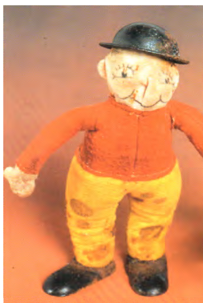
Figure iz cunj napolnjene z mivko.