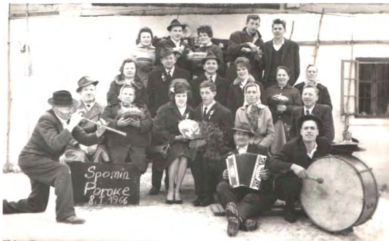
Peli so ob porokah.