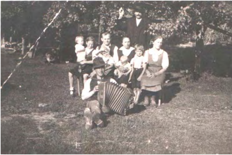
Ko je prišel na obisk kakšen harmonikar.