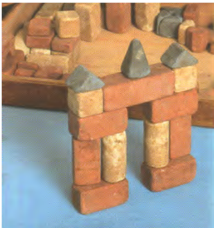
Kocke iz gline.

Vemo, da se današnje igre in igrače kar precej razlikujejo od iger in igrač v času naših babic in dedkov. Včasih so otroci imeli samo kakšno igračo ali dve, pa še to so si morali deliti vsi otroci v družini. Tedaj so bile igrače izdelane predvsem doma in iz naravnih materialov, saj je bilo dostikrat premalo denarja, da bi igračo kupili. Lahko so jo izdelali iz gline (kocke), lesa (domine, pisane palčke, figurice ...), blaga-cunj (punčke-lahko so jih napolnili z mivko, s peskom, pozneje tudi z lesno volno). Danes imajo otroci veliko igrač. Nekatere igre, kot je vožnja z vozičkom so že čisto pozabljene.