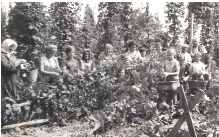
Ob skupnih delih, npr. ob obiranju hmelja,