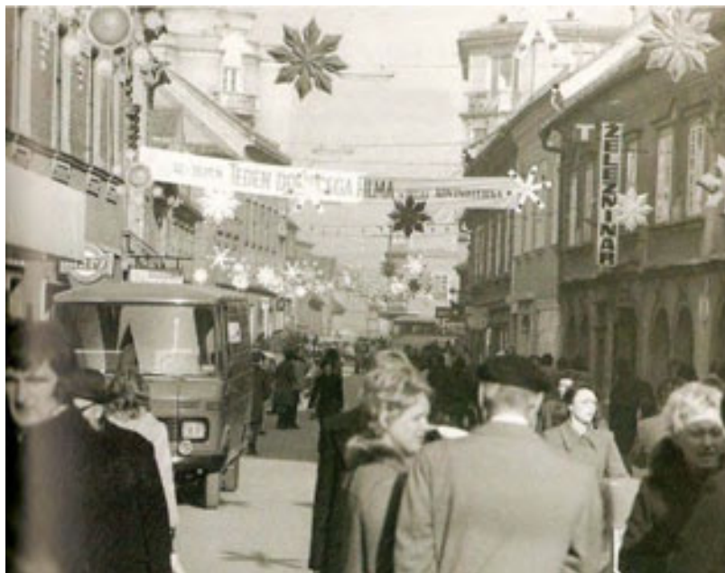
slika 26: CELJE JE ŽAŽIVELO S TDF (1974, iz knjige Stoletje v Celju)

posvetih, v naših okoljih in z ljudmi, ki so filmarjem mnogokrat nekaj posebnega. Doslej neznanega,« je v članku Teden domačega filma (Novi tednik, 4. december 1975) zapisal Jože Volfand.