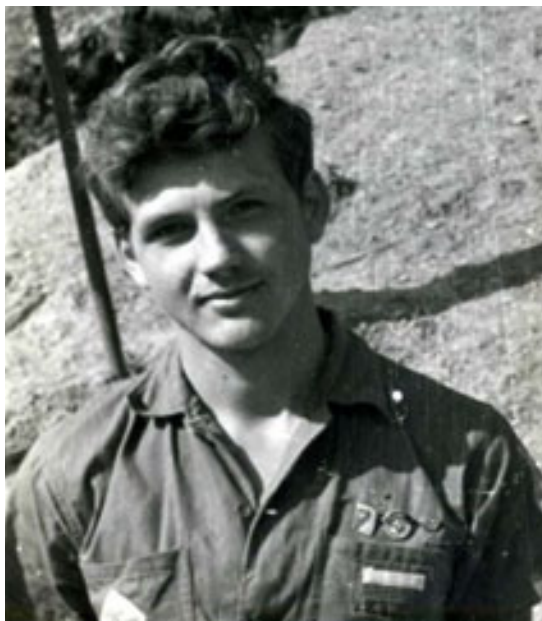
slika 15: NA DELOVNI BRIGADI (1960)

Po končanem prvem letniku učiteljišča se je z nekaterimi srednješolskimi prijatelji odločil, da preživi »delovne počitnice«. Odpravili so se v delovno brigado v Predejano ob bolgarski meji. Tam so en mesec pomagali pri obnovi domovine Jugoslavije in gradili cesto. Na ta mesec udarniškega dela ima še danes lepe spomine.