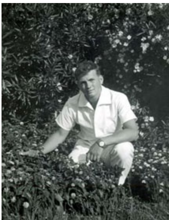
slika 16: »ŠMINKER« NA MORJU (Crikvenica,1963)