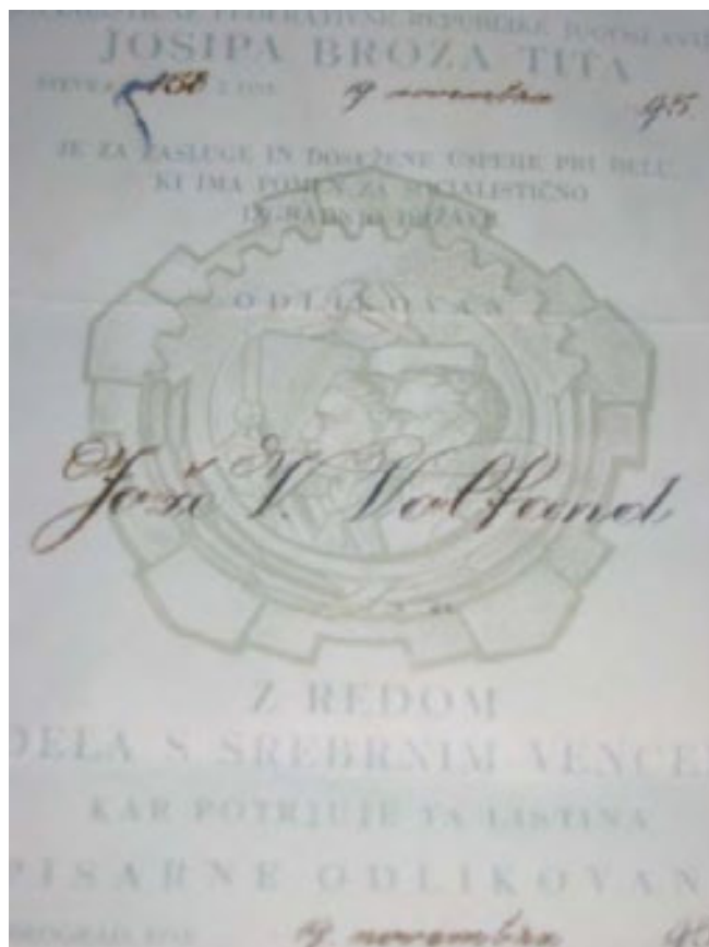
slika 51: RED DELA S SREBRNIM VENCEM

Prejel je tudi priznanje Kulturne skupnosti Celje za delo v celjski kulturi.