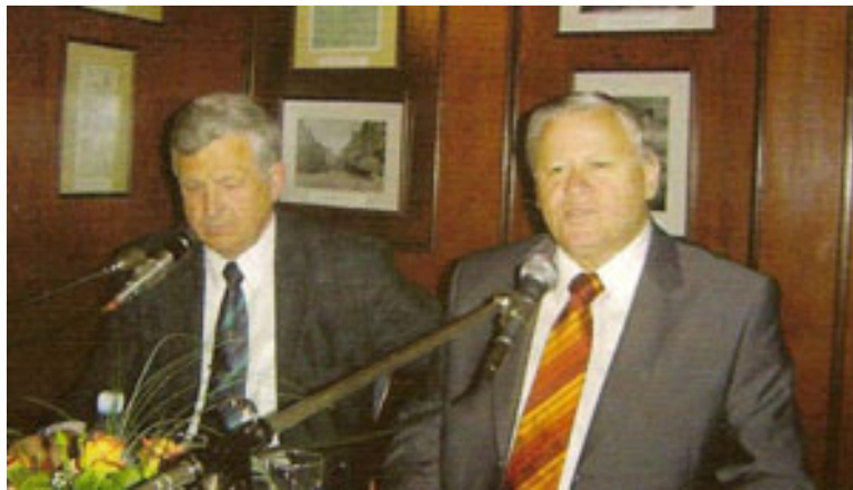
slika 45: MED OBUJANJEM SPOMINOV (2006) (slika je iz časopisa Celjan, 7. 6. 2006)

Še vedno je poln načrtov, poln idej..., ki pa še ostajajo skrivnost. Prizadeva si, da bi s svojimi idejami v čim večji meri pomagal pri kandidaturi in izboru Celja za Kulturno prestolnico Evrope 2012. Aktiven bo, dokler se bo dalo in njegovi sodelavci so tega veseli.