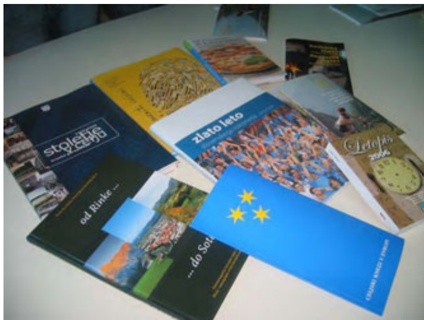
slika 40: DEL IZDANIH KNJIG IN PUBLIKACIJ (2007) (fotografirale smo raziskovalke)

Jožetu sta med njimi najljubši Stoletje v Celju in Znameniti Celjani.