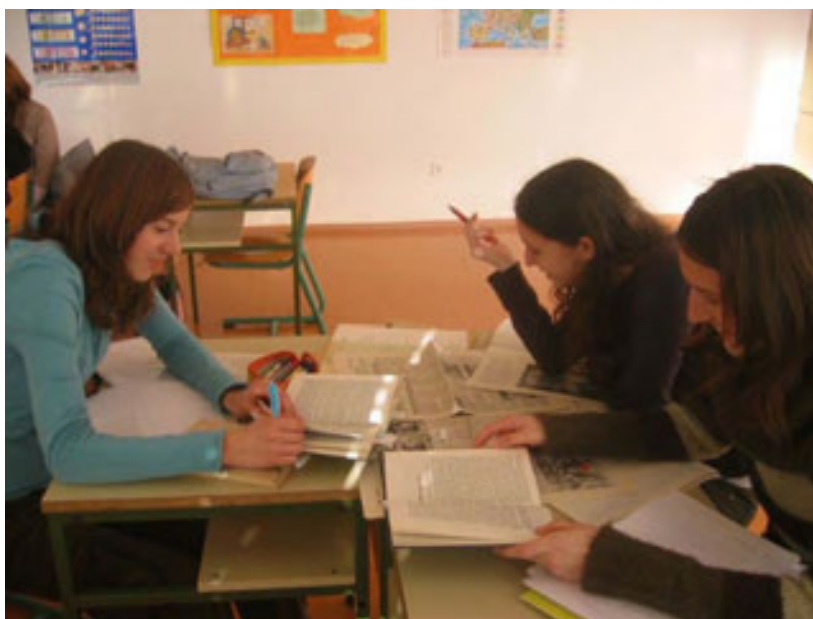
slika 2: RAZISKOVALKE PRI DELU (februar 2007)