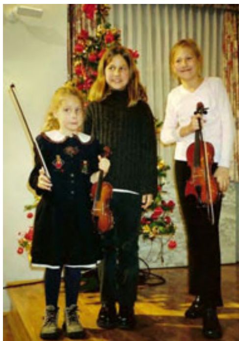
slika 48: VNUKINJE – UMETNICE (2004)

Skrivnosti tujih dežel sedaj že razkriva svojim trem vnukinjam, ki razveseljujejo njegovo družinsko življenje.