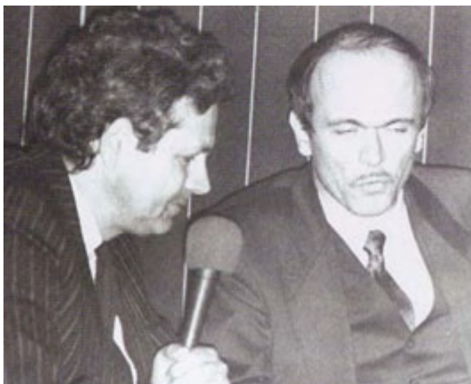
slika 36: RAZGOVOR Z DR. JANEZOM DRNOVŠKOM NA 1. CELJSKEM VEČERU (1990)

predsednik predsedstva SFRJ. Zaradi takratnega zaostrovanja razmer v Jugoslaviji je bil pogovor zelo zanimiv.