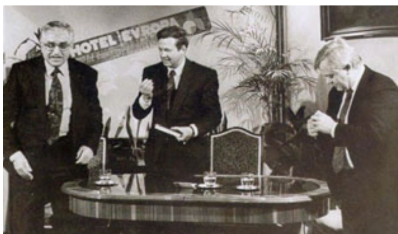
slika 37: DR. FRANJO TUĐMAN IN MILAN KUČAN – GOSTA CELJSKEGA VEČERA (1991)