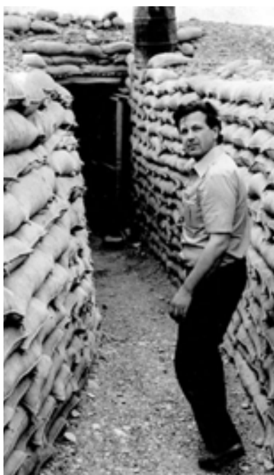
slika 34: POT V ŠTAB NA FRONTI (1985)