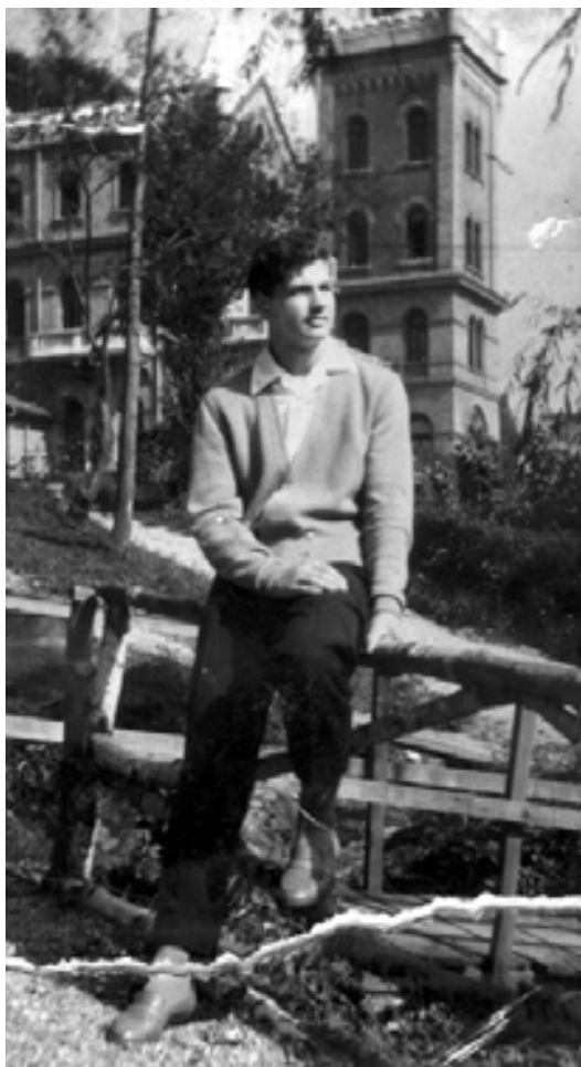
slika 12: NA HRASTNIŠKEM GRADU PRED ODHODOM »V SVET« (1958)

Najmlajši pa je s svojo pridnostjo, bistrostjo in vztrajnostjo nizar uspehe v šoli in na drugih področjih, zato so se v občini Hrastnik odločili, da mu dajo štipendijo (1500 takratnih dinarjev), da postane učitelj, saj je v občini takrat primanjkovalo učiteljev.