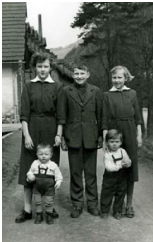
slika 10: S SESTRICNAMI (1954 )

Bratje so se, tako kot oče, zaposlili v Steklarni Hrastnik. Dva sta postala steklopihalca, eden pa orodjar.