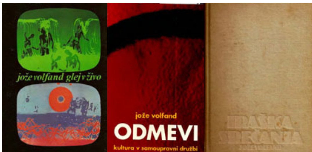
slika 49: DEL NJEGOVIH KNJIŽNIH IZDAJ