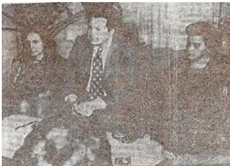
slika 24: MED VODENJEM OKROGLE MIZE (Novi tednik, 8. 3. 1973)