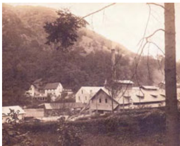
slika 4: STEKLARSKO NASELJE V HRASTNIKU

Živeli so v spodnjem delu Hrastnika, v koloniji – naselju, kjer so stanovali steklarski delavci. V zgornjem delu Hrastnika so živeli rudarski delavci.