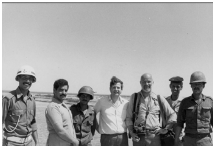
slika 33: NA FRONTI (1988)

Ne vidim nobenega zmagovalca.« (Iraška srečanja, str. 25, 26).