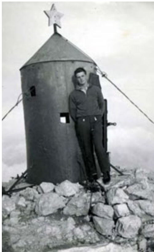
slika 17: SAM NA TRIGLAVU (1961)

Po prihodu v Celje se je v Hrastnik le redko vračal. Zaradi skromnih finančnih razmer, saj je imel le borno štipendijo, je za dodaten vir za preživetje poskrbel sam. Odločil se je, da bo sprejel mesto nočnega učitelja – vzgojitelja v domu za mentalno motene otroke na Golovcu – Dom Ivanke Uranjekove. V domu so bili trije nočni vzgojitelji. Njihova naloga je bila, da so ob sedmih zvečer prevzeli oskrbovance in skrb zanje ter za njih in njihovo počutje odgovarjali do sedmih zjutraj. Za plačilo pa so v domu dobili brezplačno hrano in stanovanje, kar je njihov »standard« kar precej izboljšalo.