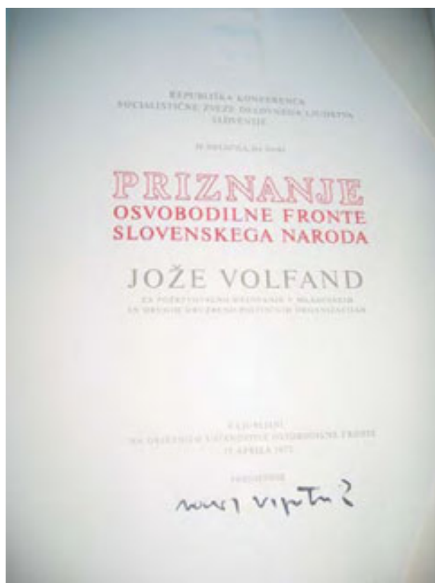
slika 50: PRIZNANJE OSVOBODILNE FRONTE

Med večjimi priznanji, ki jih je dobil, je potrebno omeniti Priznanje Osvobodilne fronte slovenskega naroda za požrtvovalno delovanje v mladinskih in drugih družbeno-političnih organizacijah, ki mu ga je podelila Republiška konferenca Socialistične zveze delovnega ljudstva Slovenije.