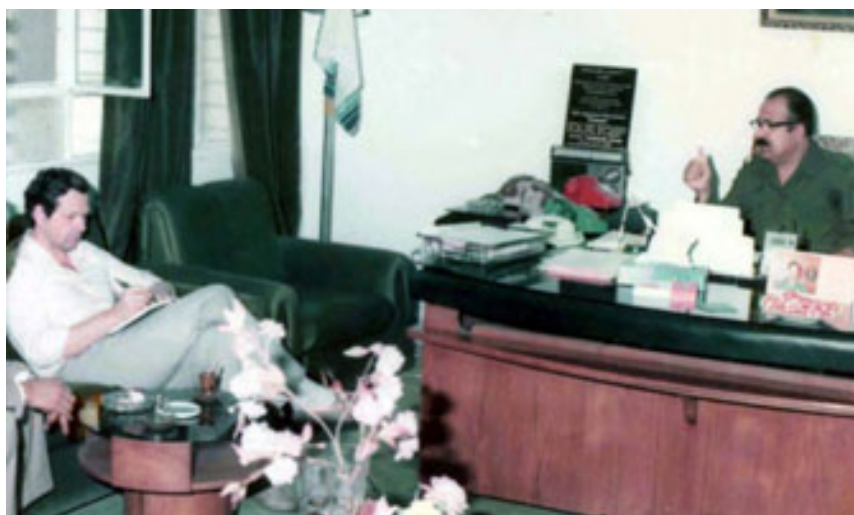
slika 35: INTERVJU Z MINISTROM ZA INFORMACIJE (1985)

Med mnogimi intervjuji, ki jih je opravil s pomembnimi iraškimi politikami, je želel dobiti tudi intervju Sadama Huseina, a mu to žal ni uspelo. So mu obljubili, da ga bo dobil »naslednjič«. Pogovarjal pa se je z nekaterimi ministri.