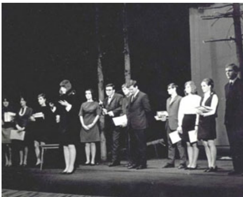
slika 20: MED PODELJEVANJEM NAGRAD NA NAŠI BESEDI (1975)