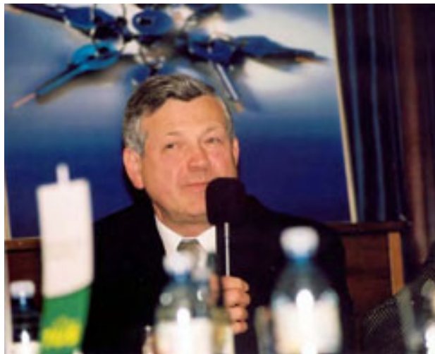
slika 42: MED VODENJEM ENEGA OD POGOVOROV (2002)