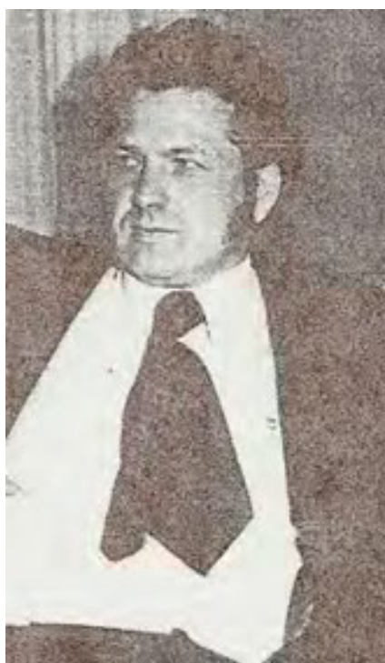
slika 28: MODERATOR MED ODDIHOM (Stop, 29. 4. 1976)