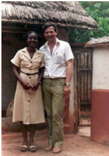
slika 47: MED OBISKOM V AFRIKI (1980)

Obiskal je okrog sedemdeset držav sveta, a je še vedno precej neobiskanih dežel, ki ga mikajo. Letos načrtuje obisk Portugalske in Rima, v načrtu pa ima tudi raziskovanje slovenskih planin.