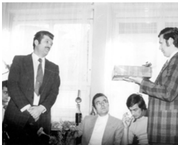
slika 23: OB NASTOPU SLUŽBE NA NT & RC (1971)

Ker je, kot sam trdi, po srcu bil vedno novinar, se je leta 1971 zaposlil kot glavni in odgovorni urednik Novega tednika in Radia Celje.