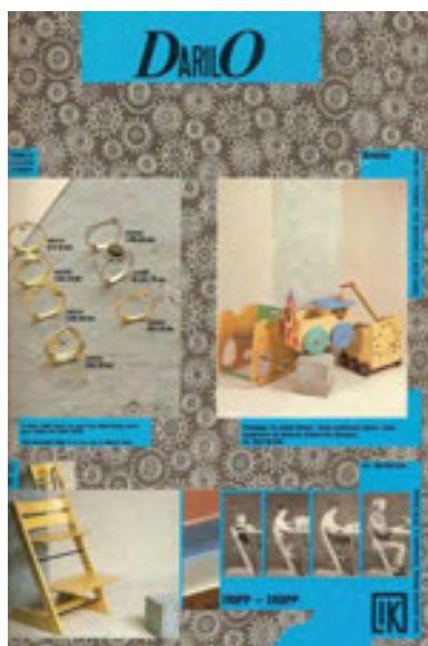
slika 39: NASLOVNICA PRVEGA KATALOGA

V podjetju so bili prvi, ki so na našem področju pričeli s kataloško prodajo, kar je danes nekaj vsakdanjega. Že leta 1991 so na tržišče poslali prvi reklamno-prodajni katalog.