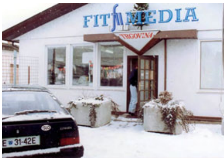
slika 41: PRVI PROSTORI NA MARIBORSKI CESTI (1992)

Sedež podjetja so imeli najprej na Mariborski cesti, kasneje so se preselili v zgradbo nasproti Sparove trgovine. Ker se je tam razvil predvsem trgovski center, so se preselili na lokacijo, kjer se sedaj razvija tehnološki center Tehnopolis, na Kidričevi cesti.