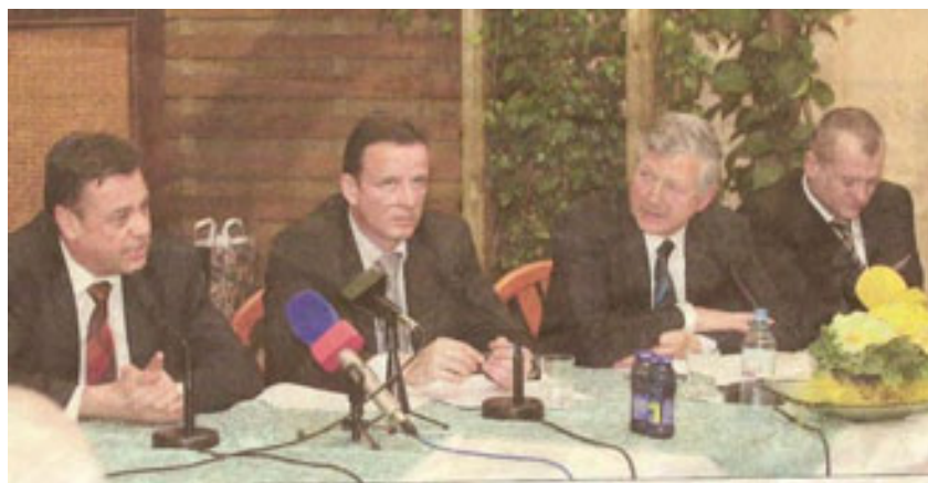
slika 43: MED RAZGOVOROM Z ŽUPANI (2007)