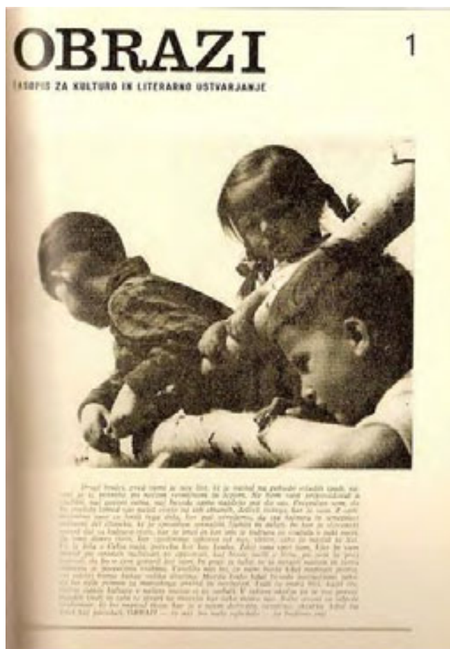
slika 21: PRVA ŠTEVILKA REVIJE OBRAZI