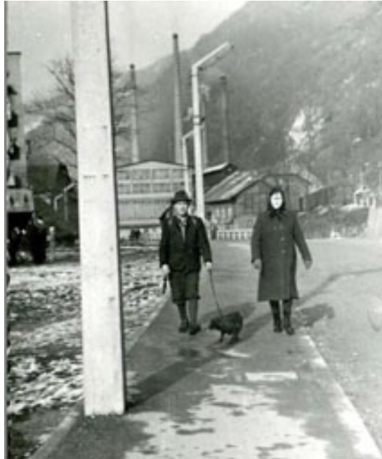
slika 3: OČE IN MATI (1949)