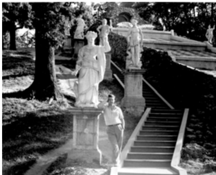
slika 46: V GRČIJI (1974)