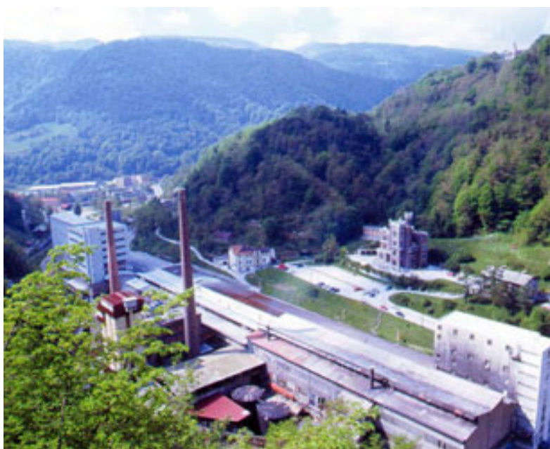
slika 6: DANAŠNJA PODOBA »IGRIŠČ«