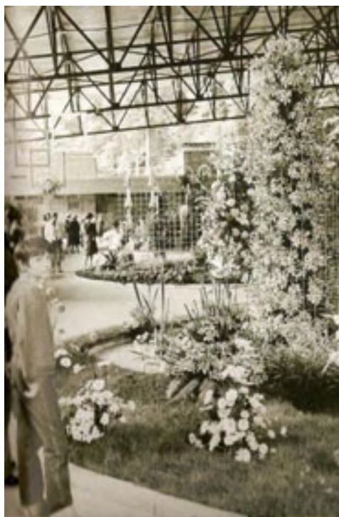
slika 30: UTRINEK Z RAZSTAVE HORTIKULTURA 80 (iz knjige Stoletje v Celju)