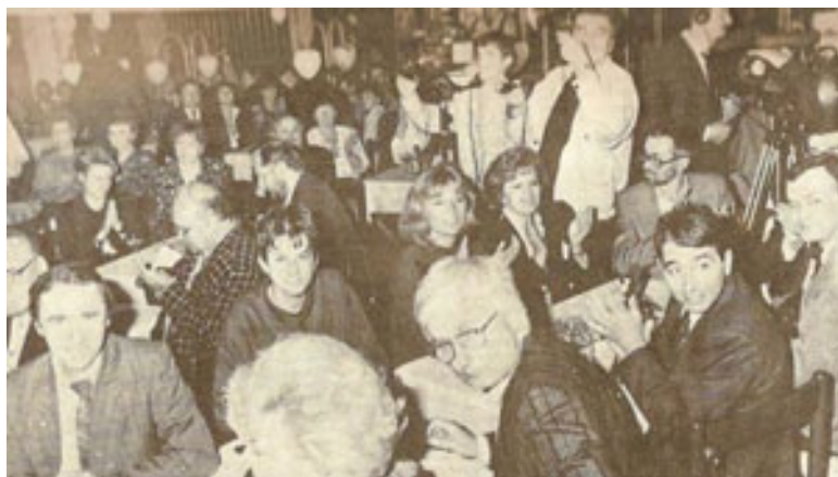
slika 38: ZADOVOLJNI OBISKOVALCI 10. CELJSKEGA VEČERA (1991)