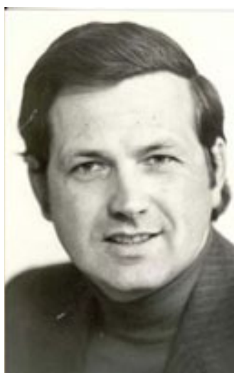
slika 29: V PULIJU (največkrat bel), KI JE POSTAL NJEGOV »ZAŠČITNI ZNAK« (1978)

V svoji knjigi Glej v živo pa je v poglavju Oddajo v živo zanima življenje zapisal: »Zato oddaje, nasploh žive oddaje, niso improvizacija. Ne smejo biti, ker bi bile v največji nevarnosti, da postanejo sčasoma stereotipne. Dobra improvizacija zahteva še kako temeljito pripravo, izkušnje in vajo ali pa genialen um in genialno sposobnost vsestranske komunikacije, ki pa sta tako redka, da je treba opravljati tudi v času nejavnega nastajanja oddaje normalno intenzivno pripravo z bogatenjem vsebine in s selekcijo med bistvenim in nebistvenim, da bi bila navidezna improvizacija lahko kvalitetna...«.