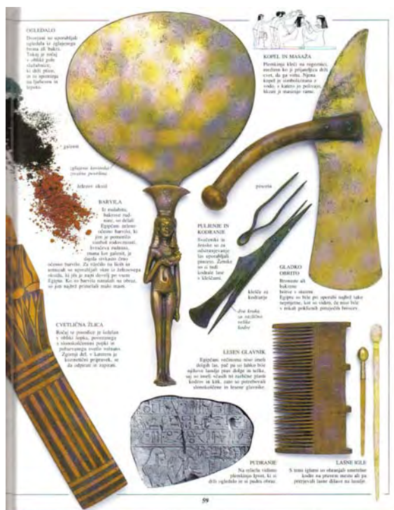
foto 11: za urejanje pričeske so uporabljali veliko pripomočkov (Egipt)

Kultura Egipta se je po trgovskih poteh počasi širila v Evropo.