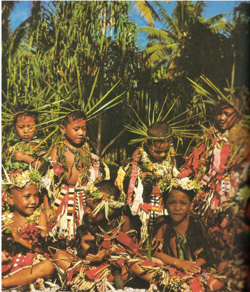
foto 3: otroci v svojih svečanih, doma pobarvanih oblačilih in palminih vencih okrog glave (Tahitii)

Na Novi Zelandiji si domorodci – Maori okrasijo obraz s tetovažami, v lase pa so vtaknejo različna peresa.