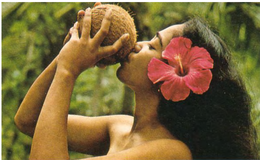
foto 2: Cvet za desnim ušesom pomeni, da tisti, ki ga nosi želi ljubezni (Tahiti)

Prebivalke Tihomorskih otokov si svoje bujne lase okrasijo s pisanimi cvetlicami, ki jih včasih spletejo v cvetlične vence. Rože so značilna okrasje tudi na Havajih. Cvet za desnim ušesom pomeni, da tisti, ki ga nosi želi ljubezni. Tudi na Tahitiju si ženske svoje dolge in črne lase okrasijo z venci rož in zelenja.