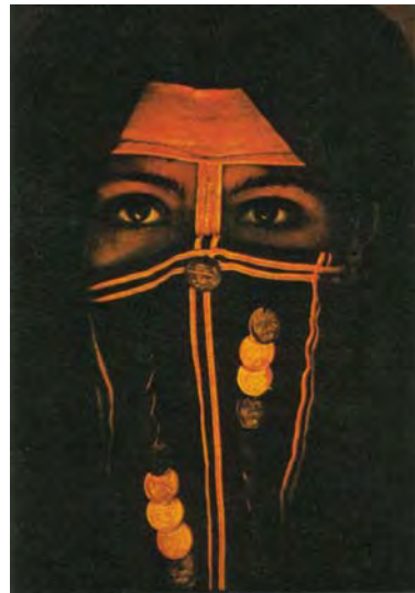
foto 5,6: ženske so morale zakrivati lase in oči pred tujci (Egipt), črna tančica je znak da je ženska poročena (Egipt)