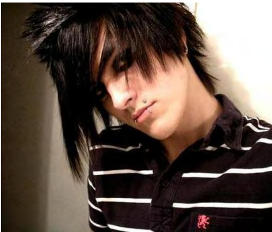
foto14 »Emo look«

Ker smo na začetku 21.stol., so frizure še podobne frizuram iz druge polovice 20. stol.. Med ženskami trajne niso popularne, v modi so preproste frizure z resami in ravnimi lasmi. Med mladimi pa je 21.stol. naplavilo nov stil, za katerega so značilne tudi frizure. To je emo look. Za emo frizuro je značilna črna barva las ( lasje so barvani) z roza ali drugimi močno barvnimi prameni, las je dolg in raven z diagonalno prstriženim prečnim frfrujem.