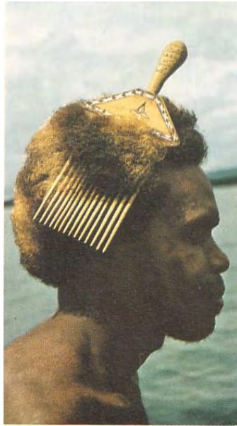
foto1: okrasni glavnik (Melanezija)

Prebivalke Tihomorskih otokov si svoje bujne lase okrasijo s pisanimi cvetlicami, ki jih včasih spletejo v cvetlične vence. Rože so značilna okrasje tudi na Havajih. Cvet za desnim ušesom pomeni, da tisti, ki ga nosi želi ljubezni. Tudi na Tahitiju si ženske svoje dolge in črne lase okrasijo z venci rož in zelenja.