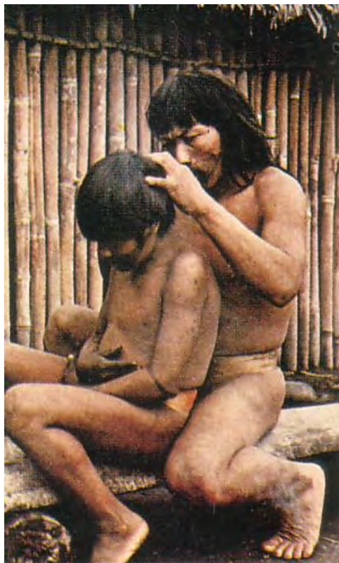
foto 4: obiranje uši z glav sorodnikov je vsakdanje opravilo (Mehika)

Indijanci, ki živijo v Peruju in Boliviji imajo pisano nošo, značilni so različni okrasni klobuku, glede na vzorce se lahko natančno ugotovi iz katerega kraja je človek. Vzorci so stari več stoletij. Ženske si spletajo dolge črne lase v dve kiti in se pokrivajo s klobučevinastimi klobuki, ki jih ščitijo pred mrazom in vetrom. Včasih imajo pod njimi še pleteno kapo z ušniki. Te pol cilindre nosijo moški in ženske nagnjene na eno stran. Klobuki so res raznovrstni, lahko je visok klobuk, nekateri jih imajo okrašene z zvezdami in novci. Visoko v bolivijskih Andih spletajo indijanske žene plemena Čipaji druga drugi lase v stotine tenkih kit. Zato opravilo vsak dan porabijo dolge ure. To je starodavna pričeska: na lobanjah, ki so jih našli v starih grobovih so dostikrat tudi lasje, urejeni na enak način. Bojeviti Indijanci Čikrini iz Brazilije otroške glave strižejo prav tako kot odrasle, obrijejo jih do temena z ostro bambusovo trsko, lase ob straneh in zadaj pa puščajo dolge. Na robu obritega dela slikajo geometrične vzorce. Na splošno je za higieno lasišča slabo poskrbljeno, zato je obiranje uši vsakdanje opravilo. Za britev rabijo zobe pasjega soma. Kadar Šinbuški Indijanec (Brazilija) nosi svoj okras iz školjk, venec orlovskih peres vrh glave in peresa tukana v prebodenih mečicah, takrat mu je lepo na svetu. Kadar pa je brez tega okrasja se počuti neprijetno in razgaljeno.