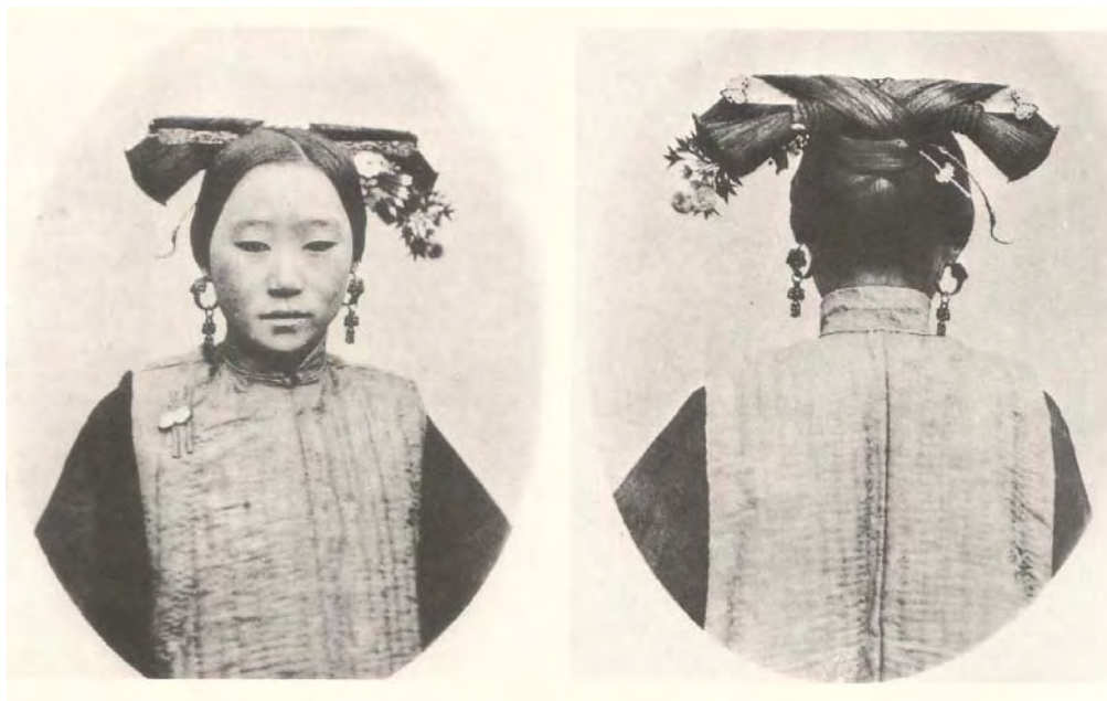
foto 10: ženske so si bogato krasile pričeske z dragulji oblikovanimi v cvetlice ( Kitajska)

Koreja: Visok črn klobuk iz pološčene konjske dlake, ki jih nosijo na glavi sta simbola korejskega dostojanstva. Nekateri pravijo, da gredo z njimi tudi spat.