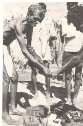
foto 9: brivci v čast uspešni žetvi žrtvujejo petelina nad škatlami z brivskim priborom (Indija)

Indija: poseben položaj imajo vaški brivci. Ti redno oskrbujejo več družin skozi celo leto. Brivci so pomembni pri obredih: ko pred poroko umivajo in režejo nohte in ko otroku porežejo prve lase. Ob proslavah obrijejo glave vaščanov, ki svoje lasje podarijo vaški boginji. Brivci še bobnajo na porokah in imajo druge zadolžitve. Brivci v čast uspešni žetvi žrtvujejo petelina nad škatlami z brivskim priborom.