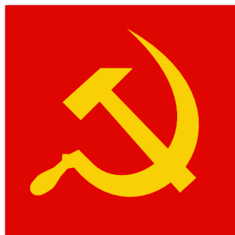
Slika 10: Kladivo in srp

Stalinistična oblast si je pri uveljavljanju svoje ideologije pomagala s simboli. Glavna simbola stalinizma oziroma komunizma sta bila srp in kladivo. Srp je predstavljal kmečki narod, kladivo pa delavski narod.