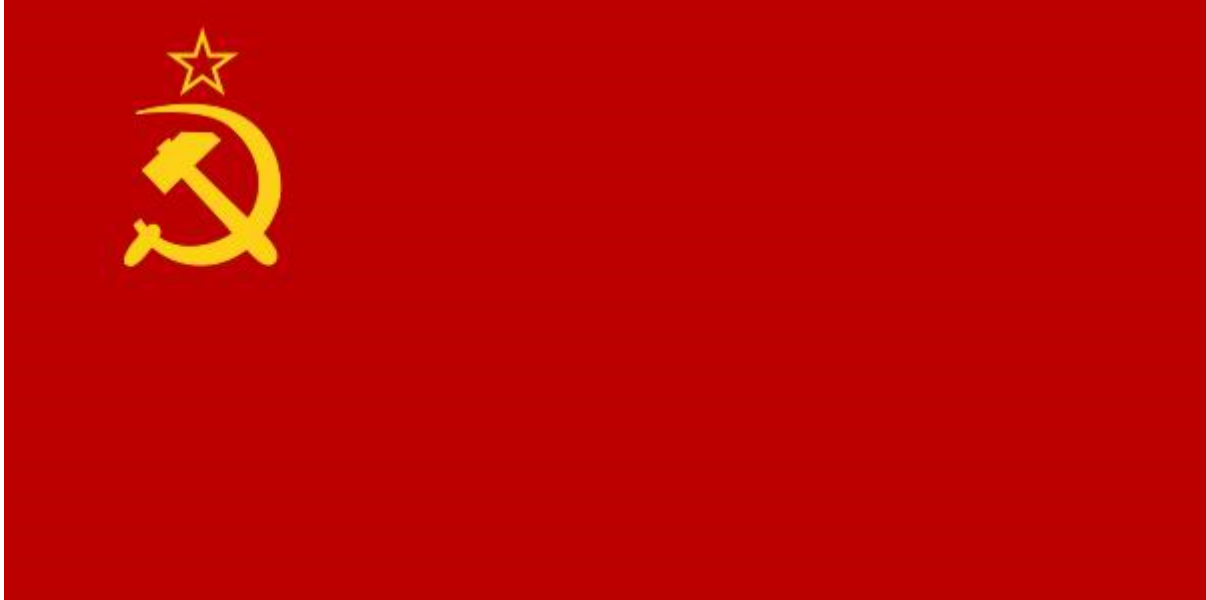
Slika 11: Zastava SZ

Pomembna simbola komunizma sta bila tudi rdeča peterokraka zvezda in rdeča zastava. Peterokraka zvezda predstavlja pet prstov delavske roke in pet celin, rdeča zastava pa je simbol komunističnih in socialističnih shodov.