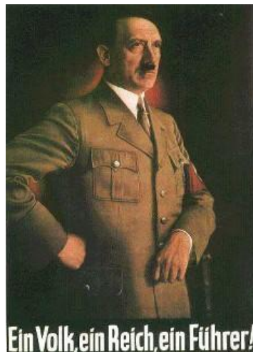
Slika 16: En narod, en Rajh, en Führer!

Adolf Hitler je bil nemški diktator, nacistični voditelj, führer, ki je skrbno dodelal svoj kult vodje. Postal je simbol nacionalsocializma in je veljal za izbranca in rešitelja nemškega naroda. In kot tak je Hitler veljal za najpopolnejši primerek arijske rase. Znan je bil po navdušujočih govorih in pa po značilnem odnosu do komunizma, socializma, vsega nacionalnega, religije, intelektualcev.