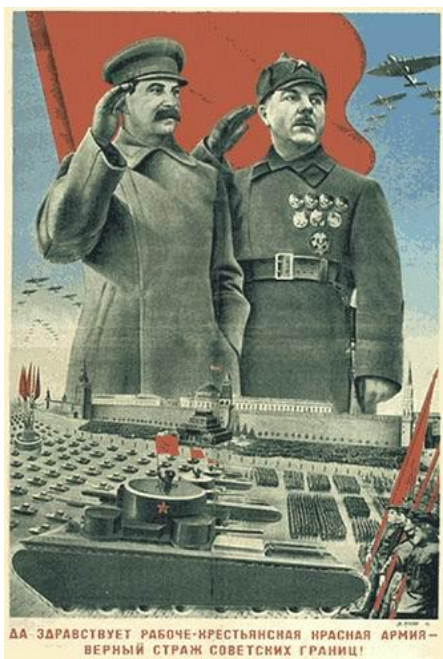
Slika 4: Vojna parada