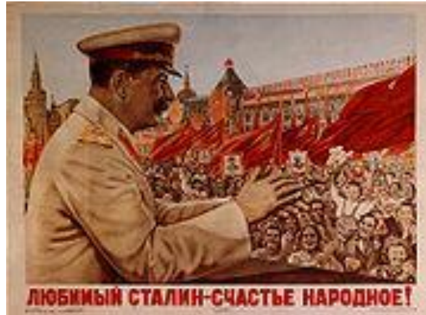
Slika 1: Ljubljeni Stalin – bogastvo naroda!