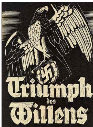
Slika 12: Zmagoslavje volje (vir: internet)

http://www.people.ubr.com/political/by-first-name/j/joseph-goebbels/joseph-goebbels-quotes.aspx