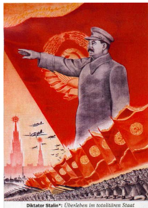
Slika 3: Prikazuje Stalina in ljudi ki držijo zastave