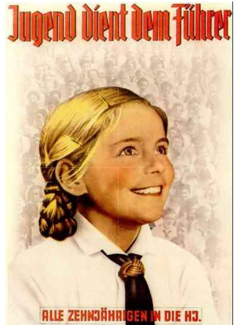
Slika: 18: Hitlerjeva mladina