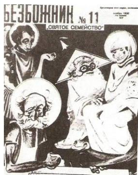
Slika 9: Protiverska propaganda

Stalin je sledil stališču, ki ga je sprejel Lenin, da je vera bila prepovedana in da jo je treba odstraniti za izgradnjo dobre komunistične družbe. V ta namen njegova vlada spodbuja ateizem s posebno ateistično vzgojo v šolah in z ogromno količino anti-verske propagande. Na tisoče menihov je bilo preganjanih in na stotine cerkva, sinagog, mošej, templjev, samostanov so porušili.