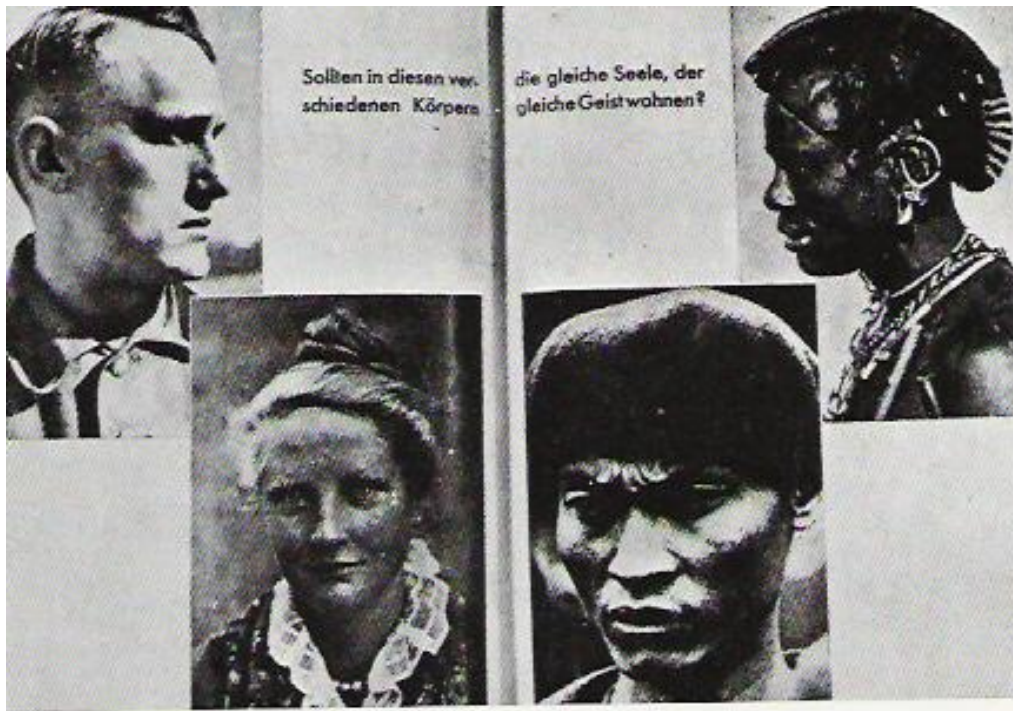
Slika 20: »Ali more v tako različnih telesih prebivati enak duh?«

»Človek nižje rase je v biološkem smislu podoben naravnemu bitju. Ima noge, roke, oči in nekaj, kar spominja na možgane; vendar je to bitje drugačno, grozno, zelo daleč od človeka, čeprav mu je po zunanosti podobno ... Moralno in intelektualno to bitje zaostaja za katerokoli živaljo, navdajajo ga divje strasti, neznanska sla po uničenju, nespodobno prostaštvo ... Gorje tistemu, ki pozabi, da ne more biti človeško bitje vsaka stvar, ki spominja nanj!« (Založba Norland: Manjvredno bitje v: Hillel, str. 25.)