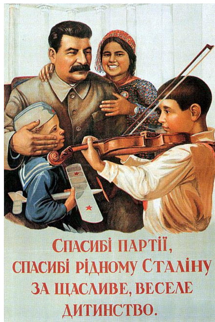
Slika 5: Hvala Partiji, hvala Stalinu za srečno otroštvo