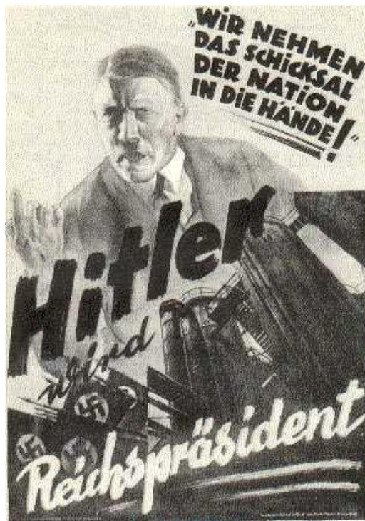
Slika 13: Vzemimo narod u svoje roke

Ključno vlogo pri prenašanju nacistične ideologije je odigrala propaganda, katero je Joseph Goebbels, propagandni minister, spretno združil s cenzuro. S svojimi odličnimi govorniškimi sposobnostmi je bil inspirator mnogih antisemitskih in protidelavskih govorov. Naloga Goebbelsa je bila, da nihče v Nemčiji ne bi prebral, slišal ali videl kaj takega, kar bi lahko ogrozilo nacistično ideologijo, seveda pa je moral poskrbeti, da bi se nacistična vizija dotaknila vsakega posameznika.