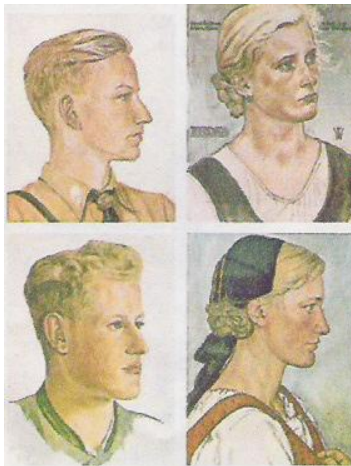
Slika 19: Idealizirana podoba Arijsca

Nacisti so verjeli, da so predstavniki arijske rase, ki je nad vsemi ostalimi rasami.