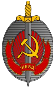
Slika 9: Znak NKVD)

Tajna policija v Sovjetski zvezi ali bolj znana kot NKVD – "Narodnyy Komissariat Vnutrennik Del" (ljudsko ministrstvo notranjih del) je bila zelo aktivna. Izvajala je čistke nad tistimi ljudmi, ki niso bili zvesti režimu ali niso spoštovali Stalina. Čistke je izvajala tudi nad tistimi ljudmi, ki se jih je Stalin bal, to so bili tudi njegovi najtesnejši partijski sodelavci.