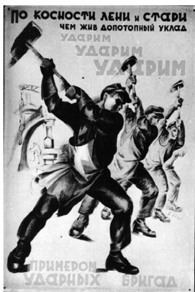
Slika 6: Propagandni plakat

Oblast je množico ljudi preko propagandnih aktivnosti spodbujala, da naj trdo delajo. Na idejo o trdem delu so ljudje naleteli na vsakem koraku.