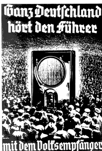
Slika 14: Naj cela Nemčija prisluhne Hitlerju