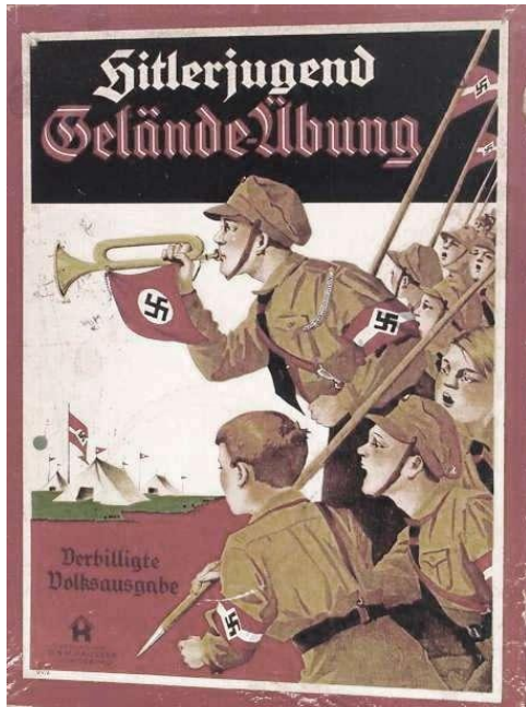
Slika 17: Hitlerjeva mladina

(Himna Hitlerjeve mladine v: Johann Pogelschek: Mladina v Tretjem rajhu. V: Zgodovina v šoli Letnik 5., Št. 2, Str.8)