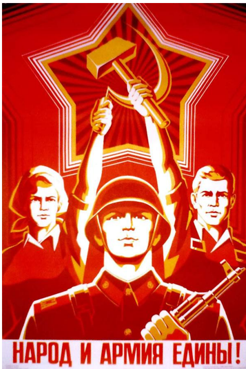
Slika 2: "narod in vojska ... edini"

Cilj propagande v Sovjetski zvezi je bil pridobiti in podrediti ljudi h komunistični partiji, Stalinu in delavskim partijam na lep način. Tukaj je nekaj slikovnih primerov propagande: