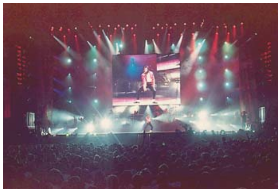
Slika 1.2 Glasba 1996