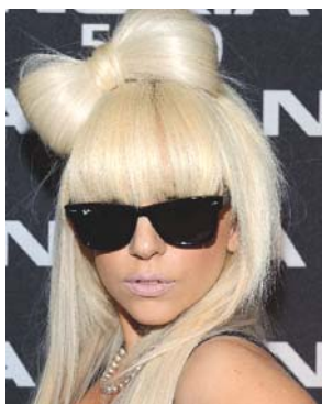
Slika 1.4 Lady GaGa