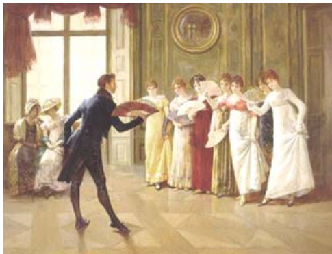
Slika 1.1 Glasba 1896

Poškrobljenost življenja v Evropi v 19. stoletju se je zrcalila tudi v njeni klasični glasbi in plesu. Današnja pravila o tem, kako se smemo zabavati, so manj toga.