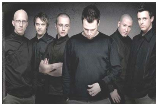
Slika 1.5 Siddharta

Izvajalci z dvema izbirama: BLINK 182, BIG FOOT MAMA, CEGA, DRAŽEN ZEČIĆ, DAMJAN MURKO, FREDI MILER, ČUKI, EMINEM, HSM, KATY PERRY, METALLICA, MICHAEL JACKSON, NIRVANA, PERO LOVŠIN, PINK, RADE LACKOVIĆ, SEPTEMBER, TRKAJ, 50 CENT, U2.