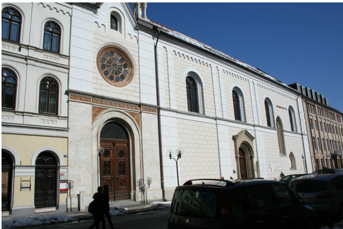
Slika 34. Marijina cerkev danes, glavni vhod