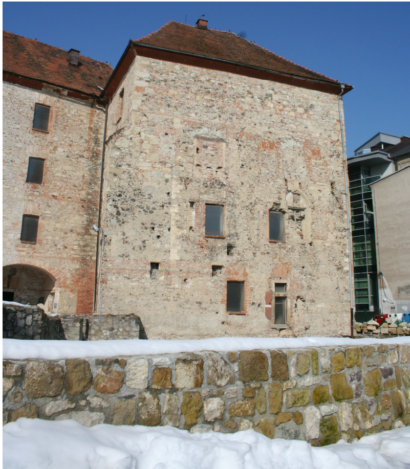
Slika 41. SV stolp Spodnjega gradu danes