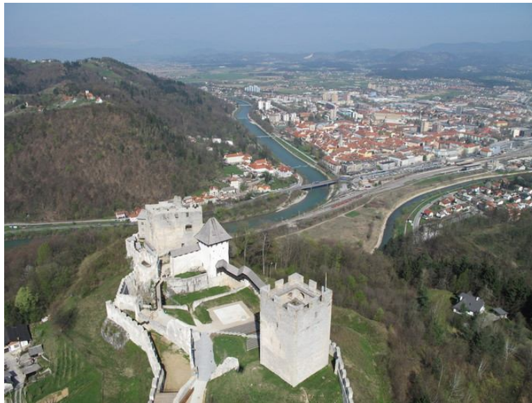
Slika 3. Pogled na Stari grad in Celje danes

Po razcvetu v srednjem veku, predvsem po izumrtju rodbine Celjskih, je Celje začelo zamirati. Ponovno se je bolj razvilo ter predvsem prostorsko razširilo ob prihodu industrializacije v začetku 19. stoletja; največ pa je k razvoju mesta pripomogel prihod železnice leta 1846. 9