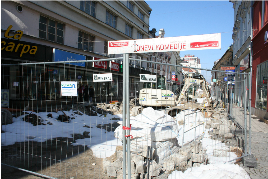
Slika 8. Stanetova ulica danes - prenova