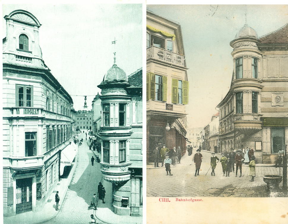
Slika 4. Prešernova ulica med obema vojnama