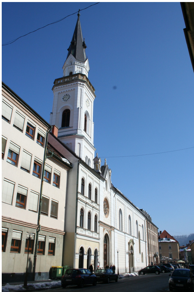
Slika 35. Marijina cerkev, stolp

Na vseh slikah sva opazila, da se je balkonček na vrhu zvonika skozi leta ohranjal in je tam še danes. Če natančno pogledamo sliki 33 in 34, vidimo, da je oblika oken enaka. Ugotovila sva, da je na zvoniku ura, ki se je ohranjala skozi čas. Sama zgradba objekta si je v letu 1985 in danes zelo podobna in nisva opazila nobene razlike. Lahko, da je razlog tudi ta, da nimava nobene slike s prednje strani, razen slike 34. To je vse, kar sva opazila. Želela sva si raziskati tudi notranjost, a na žalost nisva našla nobenih slik notranjosti iz prejšnjih let, enako kot tudi pri ostalih objektih.