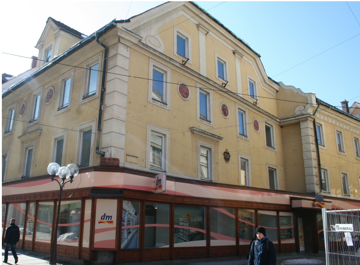
Slika 12. Mestno središče proti JZ

Med najinim raziskovanjem žal nisva našla veliko podatkov in slikovnega gradiva o središču mesta, zato o njegovi zgodovini ne veva veliko. Veva pa, da je središče mesta križišče, v katerem se sekajo Prešernova, Stanetova ulica in pa Glavni trg. Včasih je bilo bolj prazno, danes pa ga označuje velika zvezda na podu križišča. To križišče vsebuje naslednje stavbe: na SZ križišča se nahaja trgovina z oblačili Mana. Na SV najdemo banko Unicredit Bank, JZ križišča predstavlja trgovina/drogerija DM, na JV središča pa imamo turistično agencijo Kompas. Na sever, jug, vzhod in zahod pa so iz središča mesta izpeljane te tri ulice, ki sva jih že prej omenila, in sicer Prešernova ulica na vzhodu in zahodu, Stanetova na severu in Glavni trg na jugu.