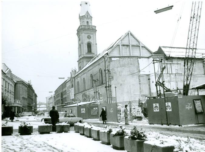
Slika 30. Marijina cerkev leta 1985, gradnja nove banke po eksploziji plina 1979

Eden največjih požarov, ki je prizadel Celje, je izbruhnil na veliki četrtek, 5. aprila, 1789. leta prav v Minoritskem samostanu. Izročilo pravi, da naj bi ga po nesreči povzročile samostanske dekle. Požar se je razširil na sosednje lesene in slamnate strehe. Močno poškodovana je bila tudi minoritska cerkev, poleg tega pa so se stalili še štirje zvonovi. 15