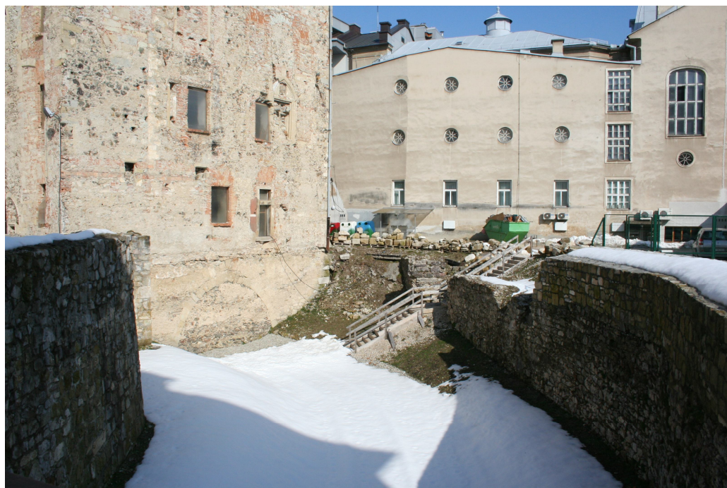
Slika 40. Spodnji grad - obrambni jarek