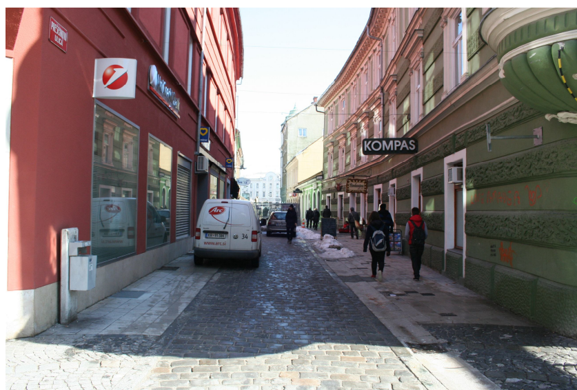
Slika 5. Prešernova ulica danes - pogled na vzhod