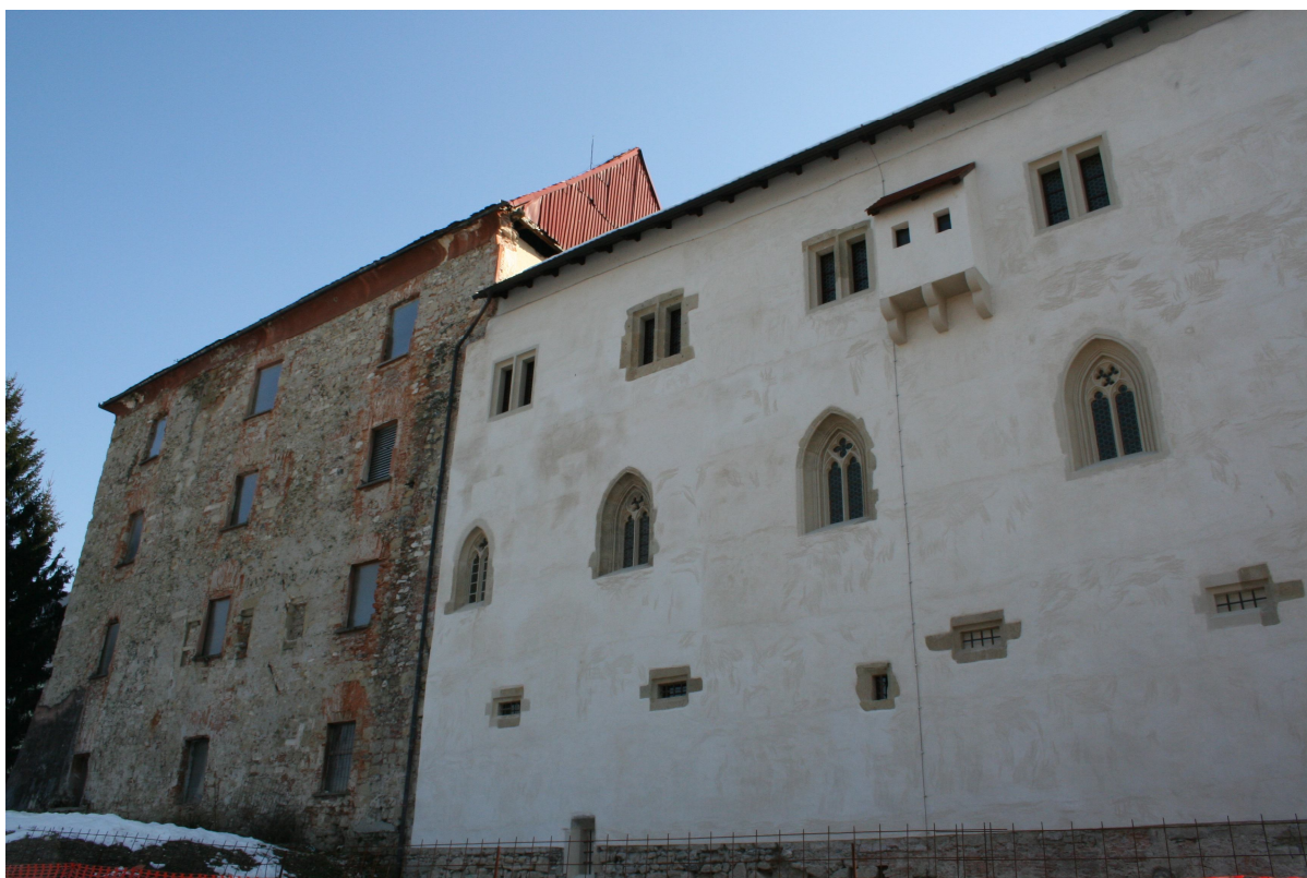
Slika 43. Obnovljeni del Spodnjega gradu - zahodna stran

Spodnji grad je bil nekoč vojašnica, a midva nisva prepričana, če je na sliki 38 še vedno vojašnica, a verjetno je, saj na sliki 39 še ni viden jarek. Le-ta je danes še vedno viden, kot sva že omenila v besedilu. Opaziva, da je desna stran gradu podrta, oz. ni več tako dolga. Razliko lahko vidimo na slikah 39 in 42. Na 40. in 43. sliki lahko lepo vidimo, da je ena stran gradu prenovljena, druga pa je ohranjena. Čeprav je ena stran prenovljena, so na njej še vedno vidna stara okna, ki so enaka kot na sliki 39. Če primerjamo sliki 38 in 43, vidimo, da je na prvi več oken kot na sliki 43. Še ena razlika je razvidna iz slike 39, da so gradu bili dodani oboki, ki jih prej ni bilo na tej steni. Bili pa so na desni strani, ki je, kot smo že prej omenili, bila podrta.