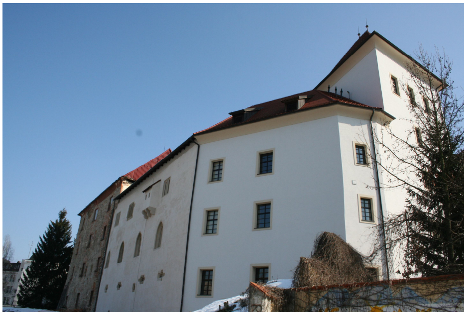
Slika 42. Obnovljeni del Spodnjega gradu - JZ vogal