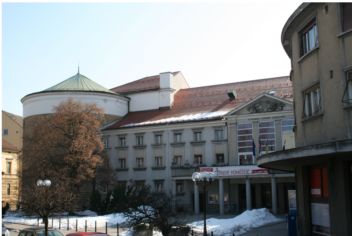
Slika 21. Glavni vhod v gledališče