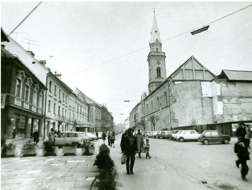
Slika 32. Marijina cerkev po eksploziji plina 1979