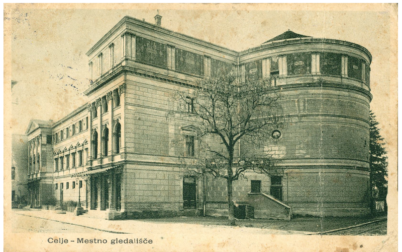
Slika 15. SV stran gledališča med obema vojnama

Na severni strani stavbe so za starim odrom naredili še zaodrje s stranskim odrom in prostorom za kulise na vzhodni strani. V drugem nadstropju pa so uredili garderobo, prostor za frizerja, sobo za vaje in krojaško delavnico. Dostop do teh prostorov so za gledališko osebje prebili v zidovju nekdanjega obrambnega stolpa. Ta je bil pri prezidavi stavbe deležen večjih sprememb. V stolpu so uredili mali stranski oder, shrambo kulis, prostor za odmor igralcev, skladišče reflektorjev in pomožno stopnišče do odra. Že 28. novembra 1952 je bila notranjost gledališča v tolikšni meri dokončana, da so izvedli koncert komornega moškega zbora.