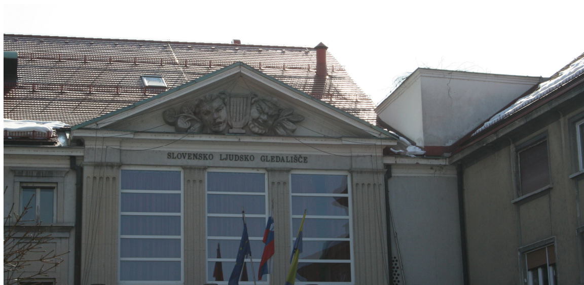
Slika 22. Timpanon z antičnim simbolom gledališča