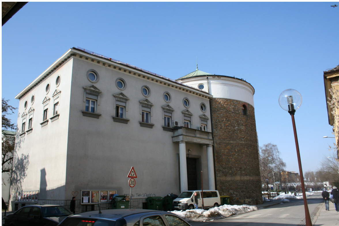
Slika 19. Gledališče danes - SV stran

Danes se uradno celjsko gledališče imenuje SLG Celje. In kakšna je njegova podoba?