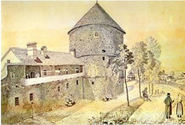
Slika 13. SZ stolp mestnega obzidja

Gledališki stolp se v Celju nahaja že vse od srednjega veka, ko je služil kot severozahodni obrambni stolp mestnega obzidja. Ta dvonadstropni valjasti stolp s stožčasto skodlasto streho je veljal za največji in najbolj utrjen stolp mestnega obzidja. V tistih časih so se v notranjosti stolpa nahajale ječe in mučilnica.