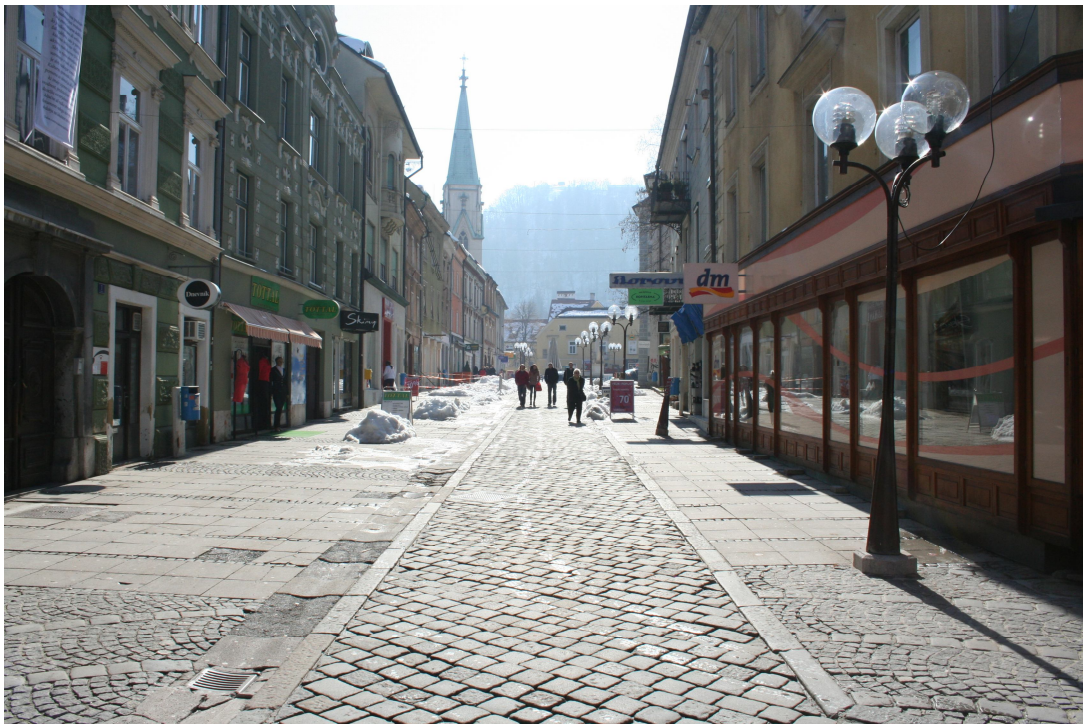
Slika 7. Glavni trg danes