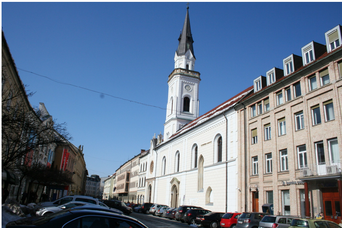
Slika 33. Marijina cerkev danes