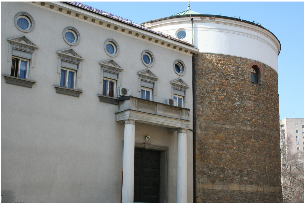
Slika 23. Gledališče - prenovljeni del

Opazimo lahko, da se je gledališki stolp zelo spreminjal skozi čas. Na sliki 17 lahko vidimo njegovo preprosto zgradbo, ki se je do leta 1905 zelo spremenila. Detajli na vrhu stolpa in na sami gledališki zgradbi to dokazujejo. Kot vidimo, je te izvirne detajle danes zamenjala opečnata stena, prevladujejo pa preproste bele stene. Današnji izgled gledališča je zelo podoben sliki 18, za katero nimamo podatka, iz katerega leta je, a predvidevamo, da ni zelo stara, saj je zgradba zelo podobna današnji; vidimo lahko enake stebre pred vhodom, enaka okna in pa seveda značilni maski in liro na čelu gledališča. Če se vrnemo nazaj h gledališču iz leta 1905, kjer vidimo stranski vhod, lahko ugotovimo, da je še zdaj viden, a je bistveno drugačen. Opazimo lahko, da so zdaj vrata pomaknjena v desno in imajo pred seboj dva velika, preprosta stebra. Prej so bila ta vrata na sredini, nad njimi pa dvoje oken, drugo nad drugim. Vrata so bila tudi na samem stolpu, zdaj jih tam več ni. Na stranski steni so bila v dveh vrstah dozidana okna. Na sliki 13 vidimo, da je zgradba gledališča popolnoma drugačna, razen stolpa, opazimo pa lahko tudi daljši balkon, na stranski steni.