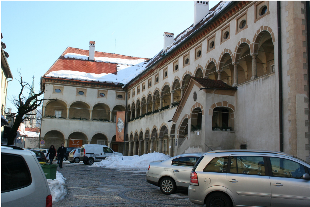
Slika 27. Stara grofija z Muzejskega trga danes