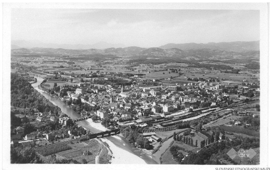
Slika 2. Pogled na Celje po drugi svetovni vojni

Zgodovina mesta Celje sega daleč nazaj v preteklost, v obdobje prazgodovine. Prvi znani prebivalci so bili Iliri, ki so imeli naselbino (gradbišče) na današnjem Miklavškem hribu v času starejše železne dobe.