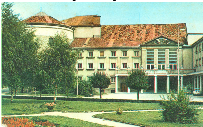
Slika 16. Pogled na zahodno stran gledališča po drugi svet. vojni

Slavnostna otvoritev obnovljene stavbe Mestnega gledališča Celje je bila 9. maja 1953 z uprizoritvijo drame Bratka Krefta Celjski grofje. Takrat so v stari stolp vzdali tudi napisno ploščo, obnovo stavbe pa so posvetili petstoti obletnici podelitve mestnih pravic Celju.