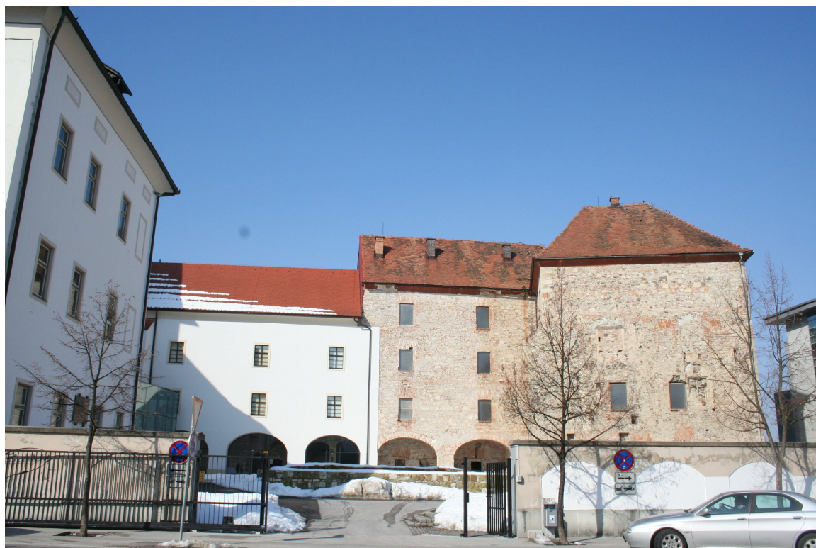
Slika 39. Spodnji grad danes - med prenovo