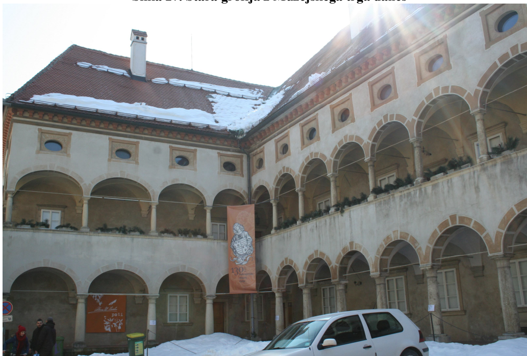
Slika 28. SZ kot Stare grofije