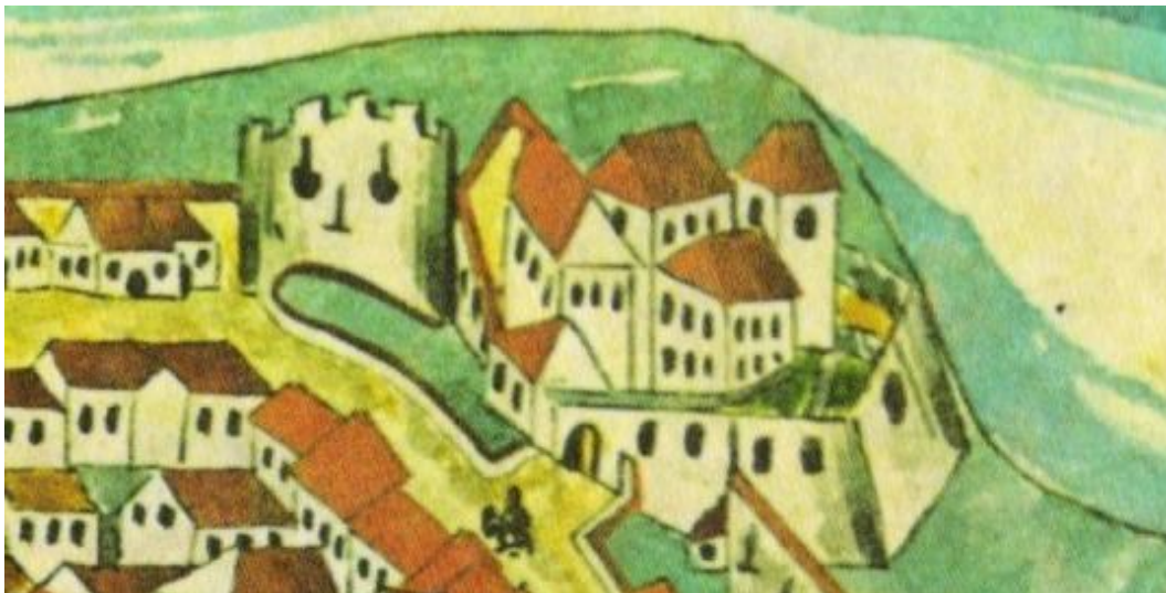
Slika 36. Spodnji grad na srednjeveški upodobitvi

Vovbrškega stolpa danes ni več, za razliko od Spodnjega gradu, na katerem se še vedno lepo vidijo nekdanja gotska okna. Spodnji grad je eden od najpomembnejših kulturnih spomenikov mesta. 17