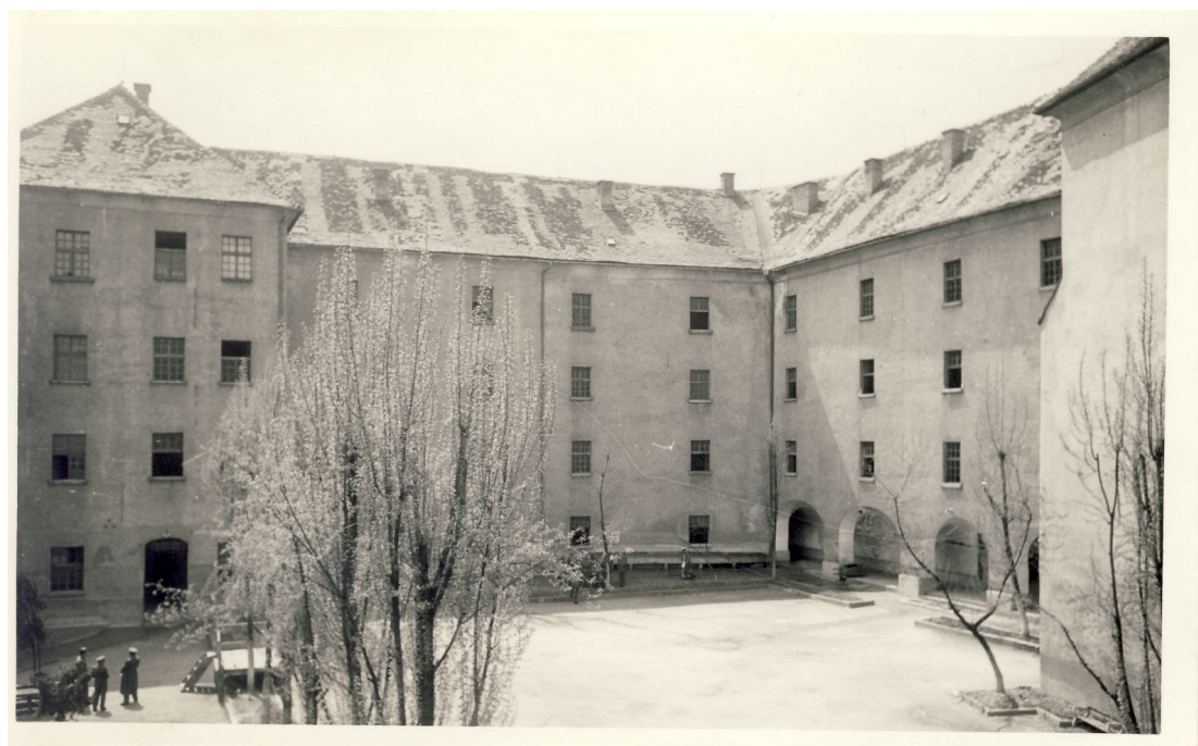
Slika 38. Spodnji grad kot vojašnica JLA - pogled z vzhoda