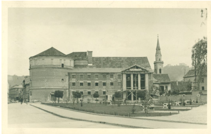
Slika 14. Pogled na gledališče v času gradnje

Po drugi svetovni vojni so hoteli gradnjo nadaljevati, vendar so jim to v Ljubljani prepovedali in zahtevali nove načrte za gradnjo, saj naj bi obstoječi načrti predvidevali premajhno gledališče. Nove načrte so izdelali leta 1951.