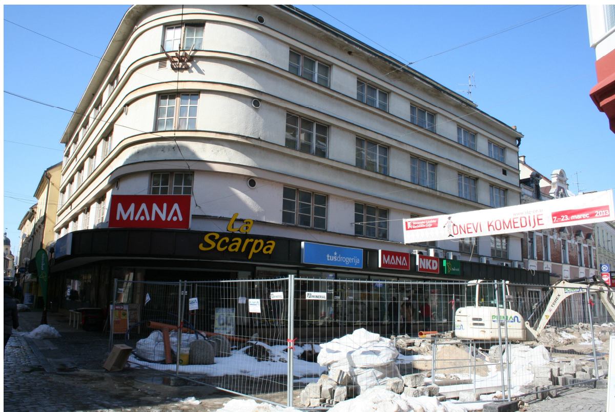
Slika 10. Mestno središče proti SZ