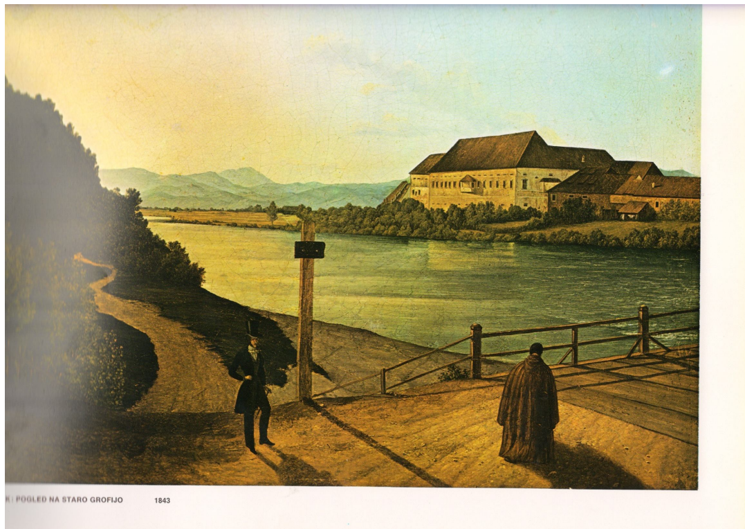
Slika 25. Pogled na Staro grofijo s Kapucinskega mostu, 1843

Med leti 1946-1955 so se v muzeju formirali sledeči oddelki: oddelek za arheologijo, oddelek za umetnostno in kulturno zgodovino in oddelek za etnologijo. 14