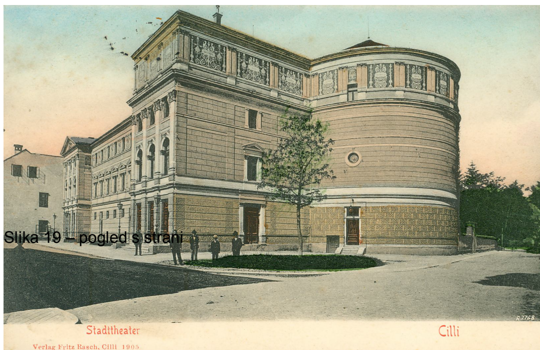
Slika 19 – pogled s strani