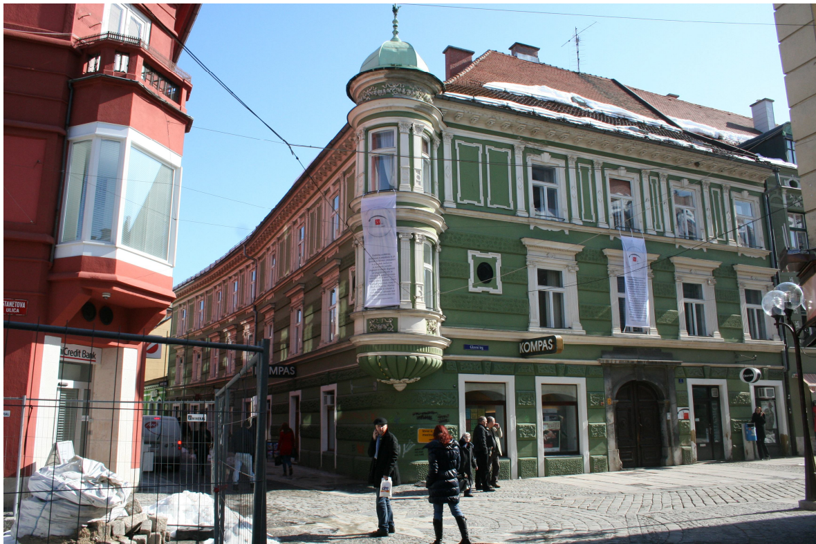
Slika 9. Mestno središče proti JV