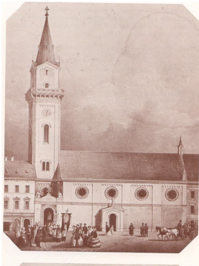
Slika 31. Marijina cerkev v 19. stoletju