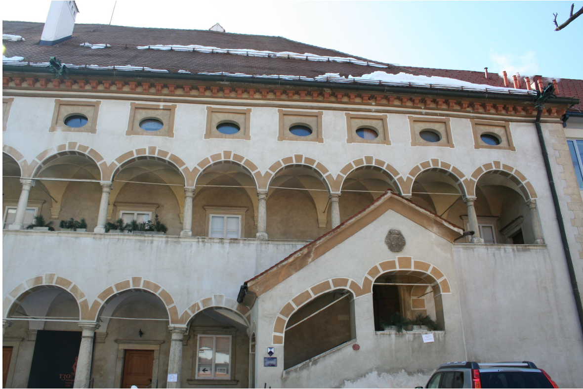
Slika 29. Pogled na arkade s severa