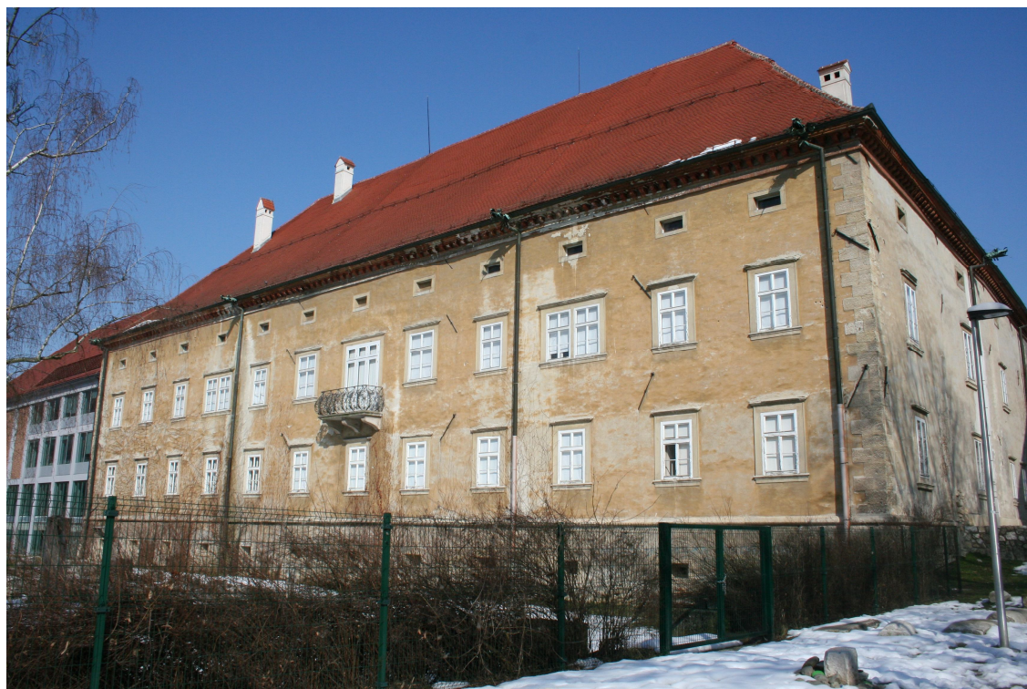
Slika 26. Pogled na zadnjo stran Stare grofije danes