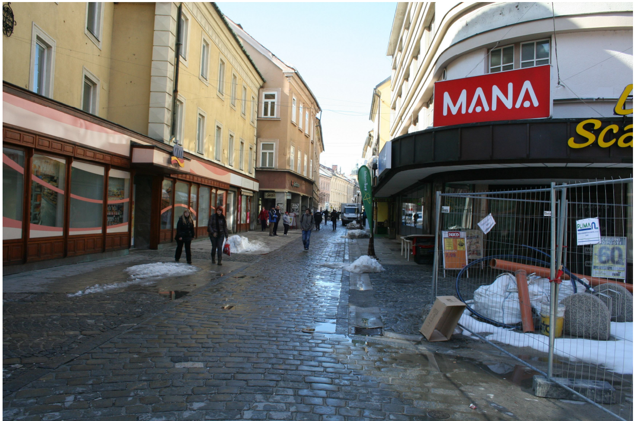
Slika 6. Prešernova ulica danes - pogled na zahod