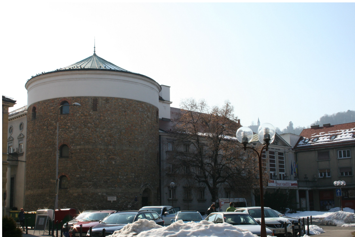
Slika 20. Gledališče danes - SZ stran