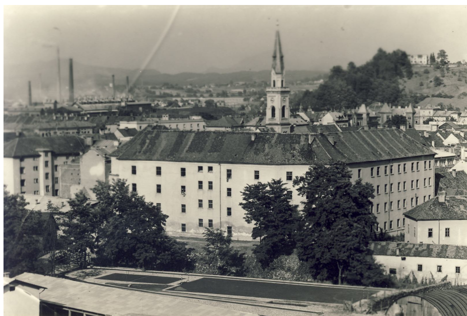
Slika 37. Spodnji grad kot vojašnica JLA - pogled z JZ