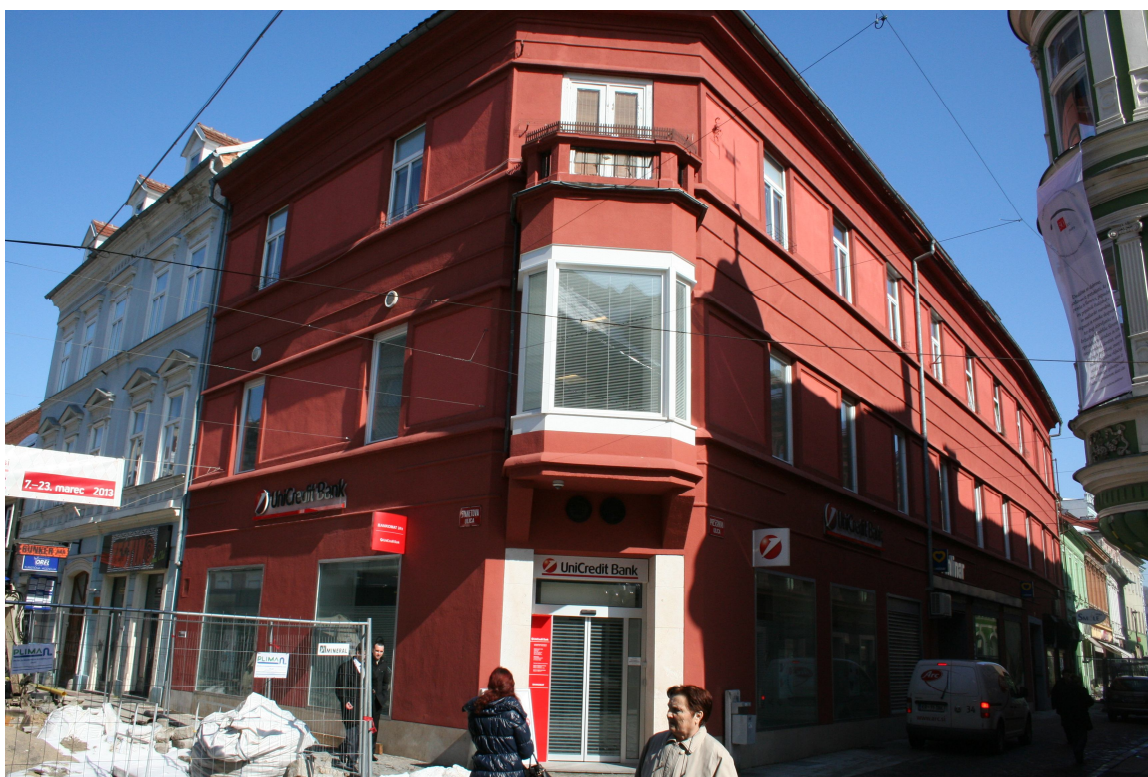
Slika 11. Mestno središče proti SV