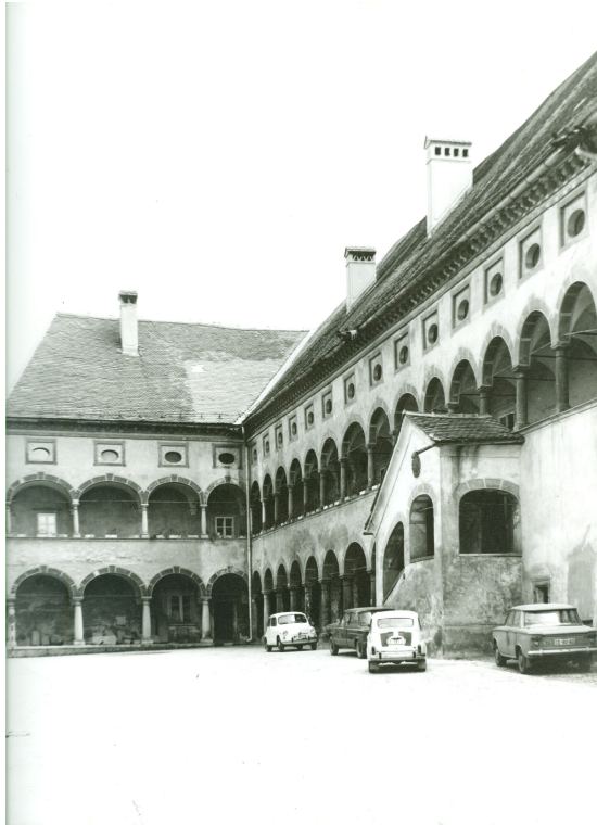
Slika 24. Stara grofija z Muzejskega trga po drugi svet. vojni

Prednica današnje grofije se leta 1414 omenja kot pisarnica - Schreibhauzz. Že ime pove, da je stavba rabila svojim gospodarjem, celjskim grofom, kot upravno poslopje. Ko so Celjani leta 1456 izumrli, je stavba postala deželnoknežja last in zdi se, da je bilo v njej tudi domovanje celjskih upravnikov.