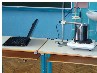
Slika 7: Določevanje vrelišča

Zaradi opozoril proizvajalcev na vnetljivost snovi smo izvedli meritve ob vodni kopeli čistil. Namerili smo 10 ml čistila, ga vlili v epruveto, vanj dali termometer in segrevali v vodni kopeli.