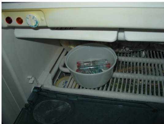
Slika 6: Hlajenje tekočin

Proizvajalci dajo na plastenko različna razmerja za mešanje tekočin, glede na to, pri kakšnih temperaturah bomo čistili vetrobranska stekla. Tako smo spreminjali razmerja mešanja tekočin in opazovali agregatna stanja snovi pri temperaturi -12^{\circ}\text{C} . Ohlajevali smo 12 ur.