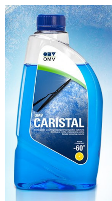
Slika 2: Zimsko čistilo Caristal