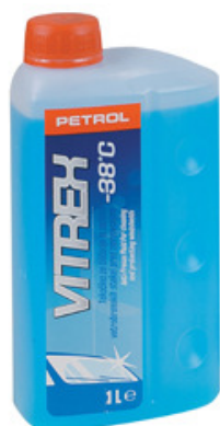
Slika 1: Zimsko čistilo Vitrex