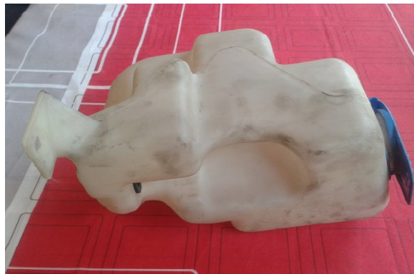
Slika 4: Posoda za čistilo v avtomobilu

Čistilo imamo v avtomobilu shranjeno v posebnih posodah, ki so zelo nenavadnih oblik. Posoda vsebuje 3–5 litrov čistila.