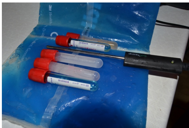
Slika 5: Določevanje agregatnega stanja pri določeni temperaturi

Štiri ure smo opazovali agregatno stanje čistil, ki so se segrevala v hladilniku pri temperaturi 6^{\circ}\text{C} . Sproti smo odčitavali temperaturo in ob vsaki spremembi za 5^{\circ}\text{C} smo zapisali agregatno stanje. Rezultate smo zbrali v tabeli agregatnih stanj pri določeni temperaturi.