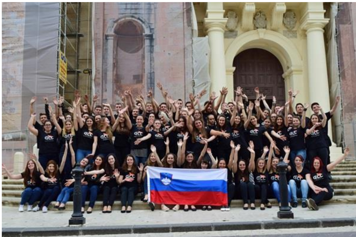
Slika 8: Dekliški pevski zbor Gimnazije Celje - Center in FaVoZa na Malti

Zbor še vedno dosega odlične rezultate doma in v tujini. V letu 2015 se je skupaj s fantovsko vokalno zasedbo FaVoZa udeležil 26. mednarodnega pevskega festivala na Malti, kjer sta v kategoriji mladinskih zborov zasedla prvi dve mesti.