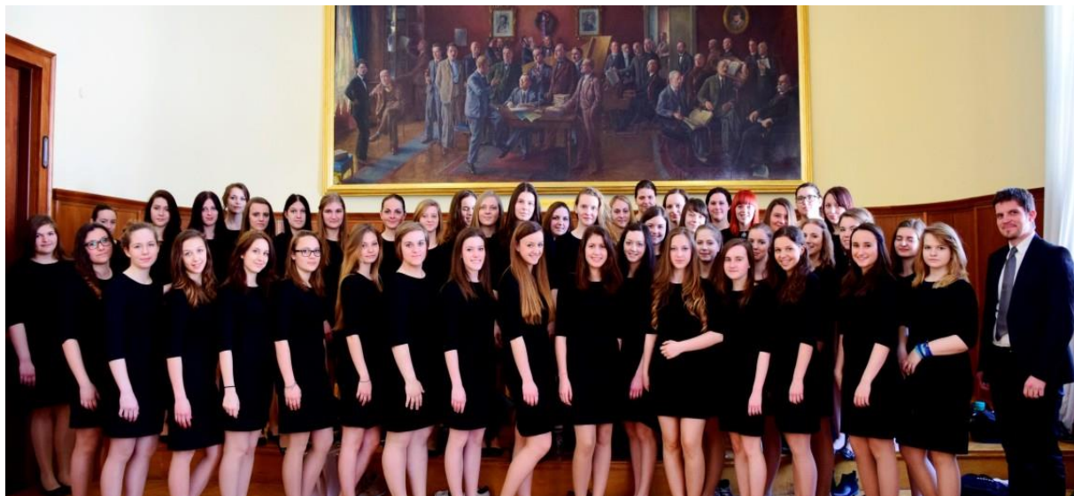
Slika 5: Dekliški pevski zbor Gimnazije Celje - Center v Slovenski filharmoniji

Slovenski filharmoniji in v Celju v Narodnem domu. Skupaj so izvedli delo romantičnega skladatelja Josepha Gabriela Rheinbergerja in sicer Missa in A. Sicer pa so se odpravila na enodnevno ekskurzijo glasbenikov z GCC na Primorsko, kjer so vsi nastopili v Kopru in obiskali tamkajšnjo osnovno šolo, Fieso in Piran. (Vir: Letno poročilo Gimnazije Celje - Center 2014/2015)