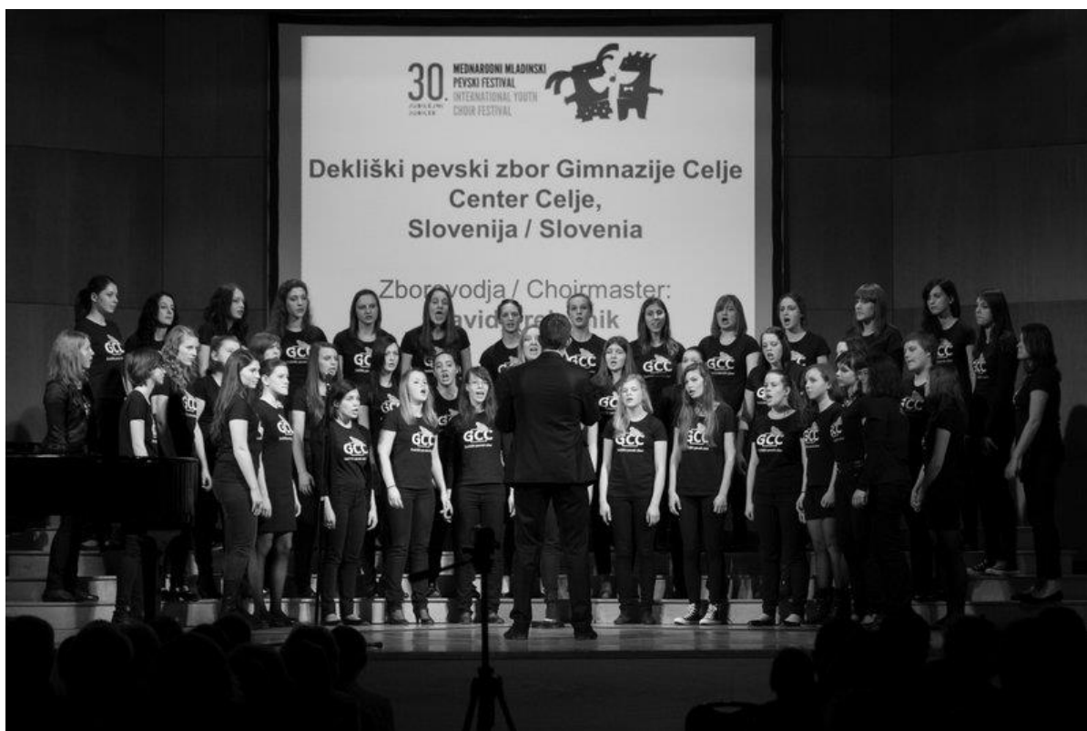
Slika 6: Dekliški pevski zbor Gimnazije Celje - Center

Gimnazija Celje - Center ima dolgoletno tradicijo zborovskega petja. Dekliški pevski zbor gimnazije Celje - Center je pod vodstvom profesorja Davida Preložnika najstarejša glasbena zasedba te šole. Na šoli deluje že več kot štiri desetletja. Zbor sodeluje na šolskih prireditvah, priložnostnih nastopih, pripravlja samostojne koncerte v Celju, regiji in državi.