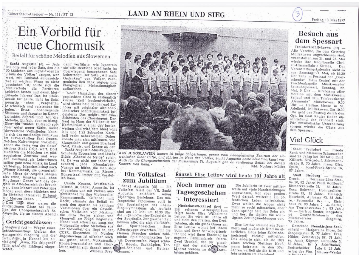
Slika 7: Članek iz nemškega časopisa (Vir: Kölner Stadt-Anzeiger, 13.5.1977)

Iz Jugoslavije je prišlo 50 pevk, natančneje s Pedagoškega centra v slovenskem mestu Celje. V Hiši narodov v St. Augustinu so prikazale najboljšo novo zborovsko umetnost. Tudi Zborovsko društvo Glasbene šole St. Augustin je bilo deležno zasluženega aplavza na tem prestižnem koncertu." (Vir: Kölner Stadt-Anzeiger, 13.5.1977)