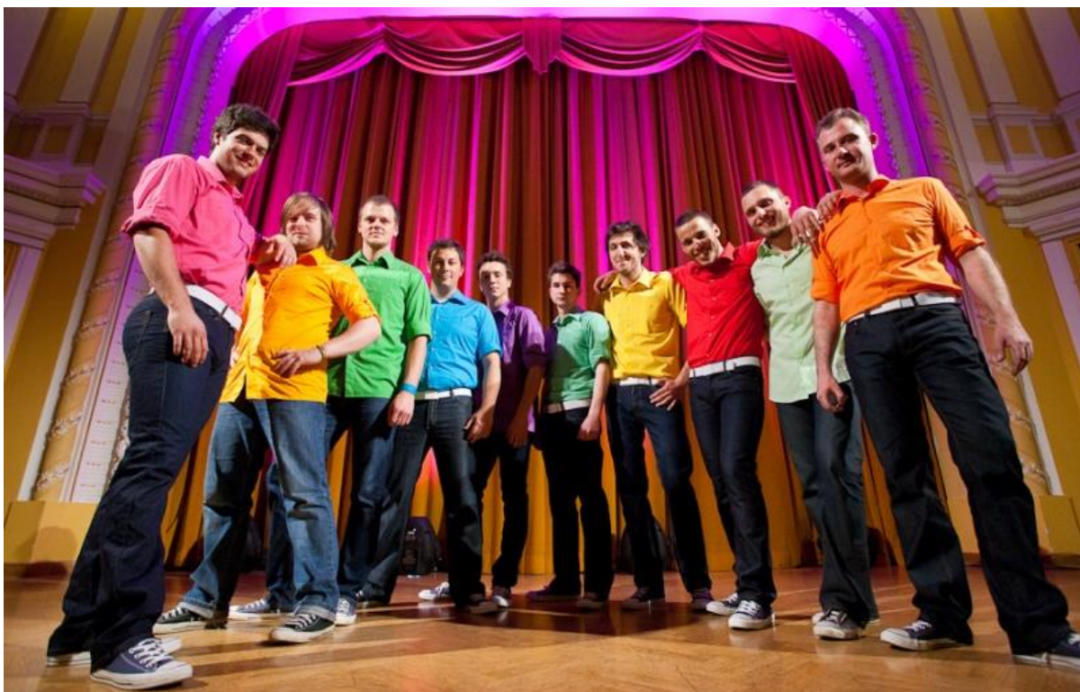
Slika 2: Oktet 9