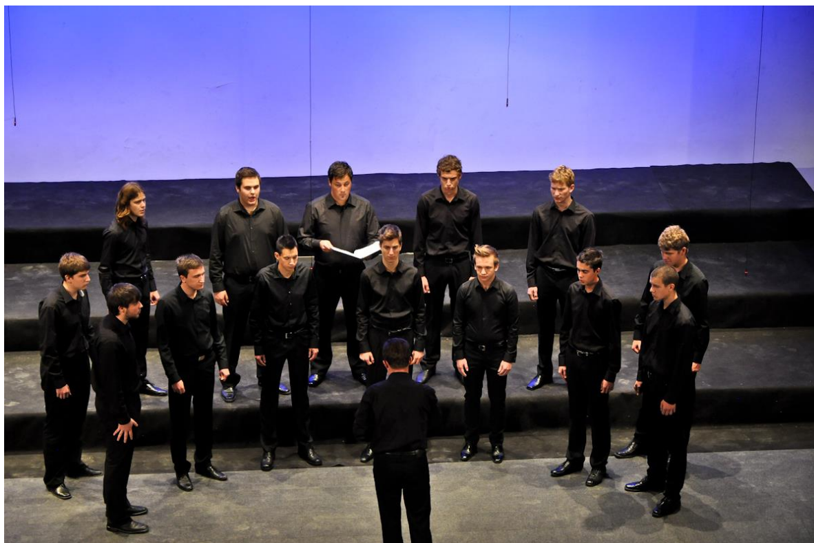
Slika 11: Fantovska vokalna zasedba FaVoZa

Vokalno zasedbo sestavlja 25 fantov, ki se na vajah srečujejo dvakrat tedensko za dve šolski uri. Občasno vaje potekajo tudi med vikendi, ko se dela nekoliko hitreje in intenzivneje. Skupaj z Dekliškim pevskim zborom se fantje vsaj enkrat letno odpravijo na intenzivne vaje kam izven Celja, kjer pripravljajo program za koncerte in temovanja. Prav tako kot dekleta tudi fantje na tekmovnih dosegajo odlične rezultate.