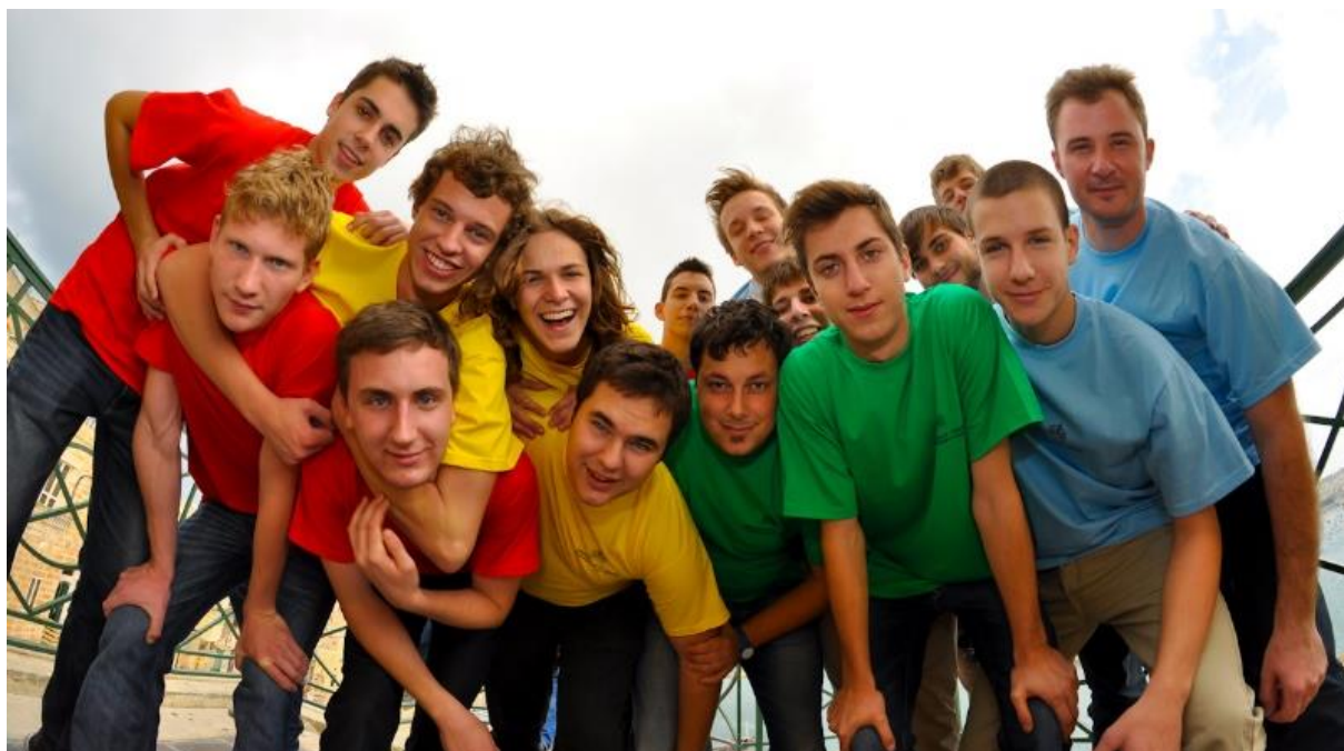
Slika 1: FaVoZa

V šolskem letu 2008/2009 je Dekliški pevski zbor na 28. mednarodnem pevskem festivalu v Bratislavi dosegel srebrno priznanje, na Mednarodnem mladinskem pevskem festivalu v Celju pa bronasto priznanje in nagrado občinstva. Zasedba Oktet 9 je to leto štela 12 članov. Vaje so potekale 2-3 krat mesečno, po navadi ob nedeljah. Doslej je Oktet 9 nastopil na že več kot 400 nastopih in koncertih po Sloveniji. Letos se je udeležil 7. festivala vokalne zabavne glasbe, kjer je kot najmlajša zasedba osvojil drugo mesto po izboru občinstva in tretje mesto po mnenju strokovne žirije. Oktet 9 je leta 2009 dobil podmladek- FaVoZo, v kateri je, pod vodstvom Gregorja Deleja, prepevalo 15 dijakov. Prvo leto je bilo v veliki meri povezano z vokalno-tehničnim delom. (Vir: Letno poročilo Gimnazije Celje - Center 2008/2009)