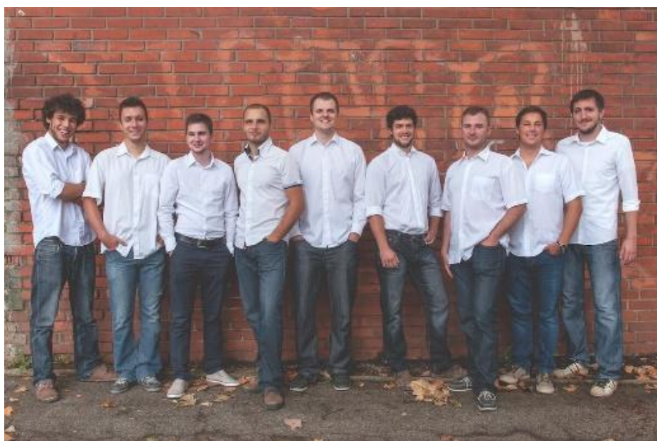
Slika 9: Oktet 9