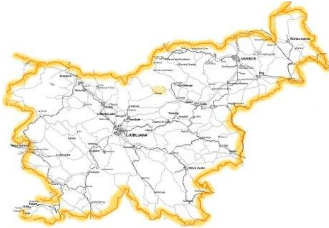
Slika 10: Radio Celje na frekvenci 90.6 MHz