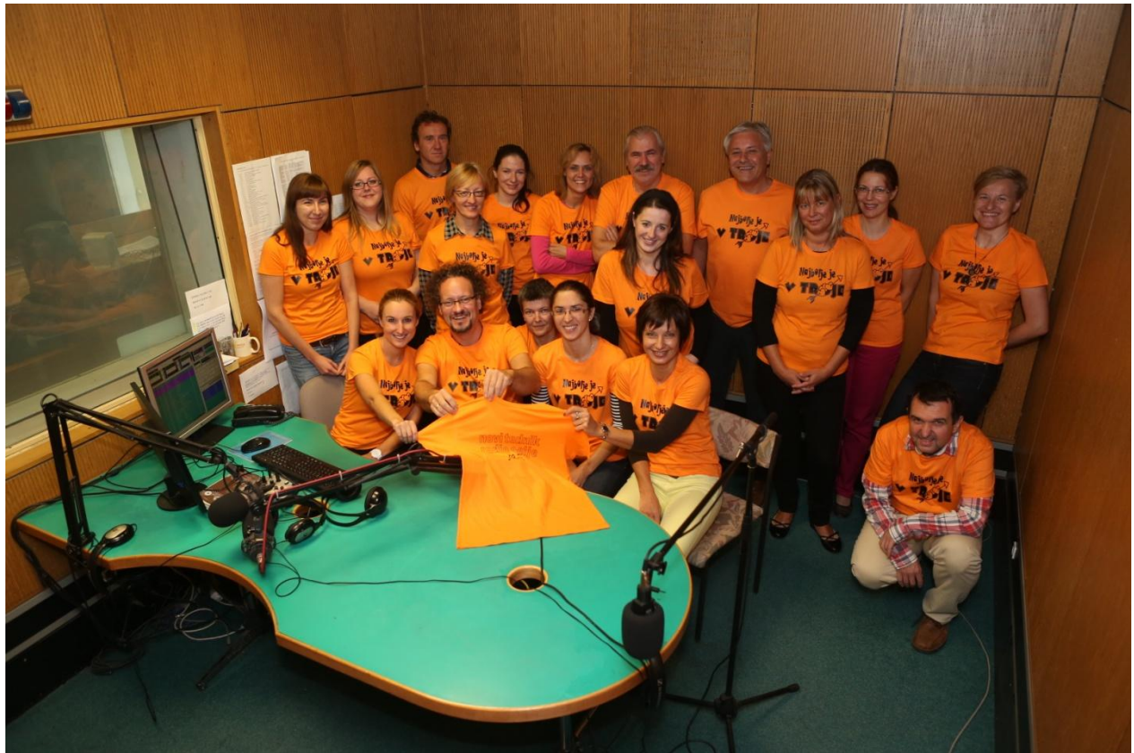
Slika 6: Ekipa Radia Celje