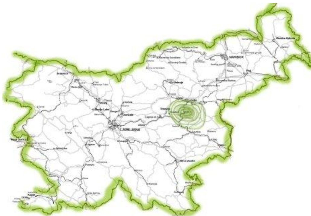
Slika 9: Radio Celje na frekvenci 95.9 MHz