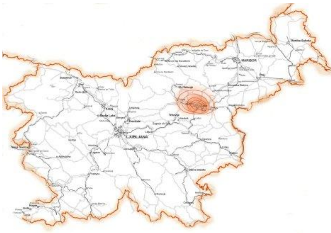
Slika 7: Radio Celje na frekvenci 100.3 MHz