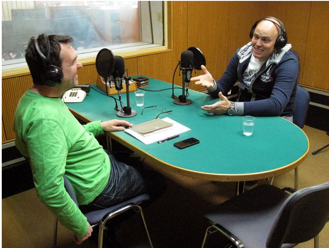
Slika 11: Radio Celje v živo