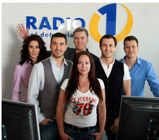
Slika 2: Ekipa Radia 1

Popravite!