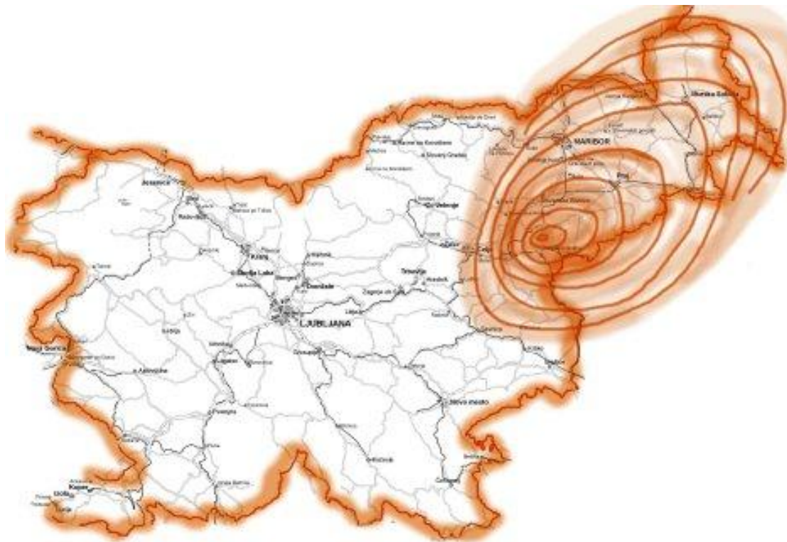
Slika 8: Radio Celje na frekvenci 95.1 MHz