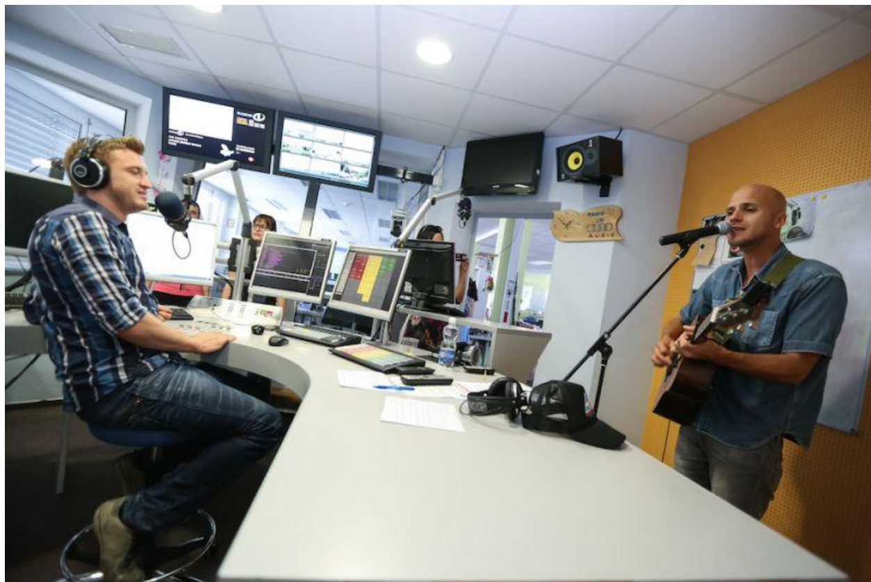
Slika 3: Radio 1 v živo