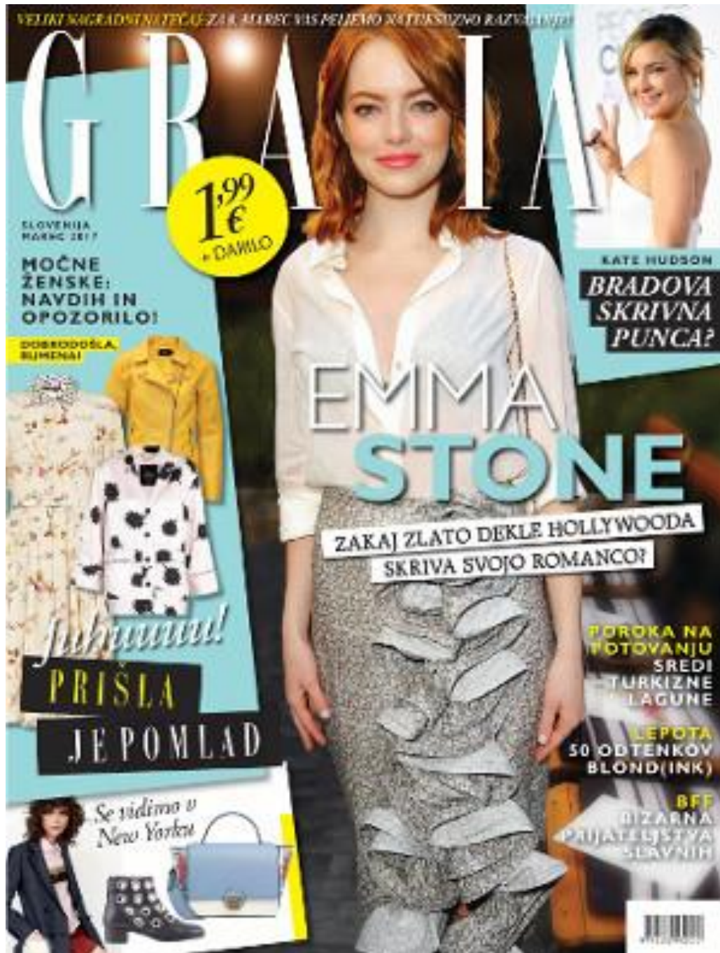
Slika 11: Naslovnica Grazie