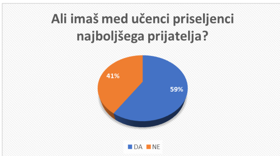
Graf 3: Ali imaš med učenci priseljenci kakšnega prijatelja?

Tabela in Graf številka 3 prikazujeta podatke o tem, ali imajo učenci med prijatelji tudi učence priseljence. Izkazalo se je, da ima večji odstotek (59,29 %) učencev prijatelja med učenci priseljenci, kar se nam zdi spodbuden podatek in pokazatelj, da učenci sprejemamo učence iz drugega jezikovnega in kulturnega okolja.