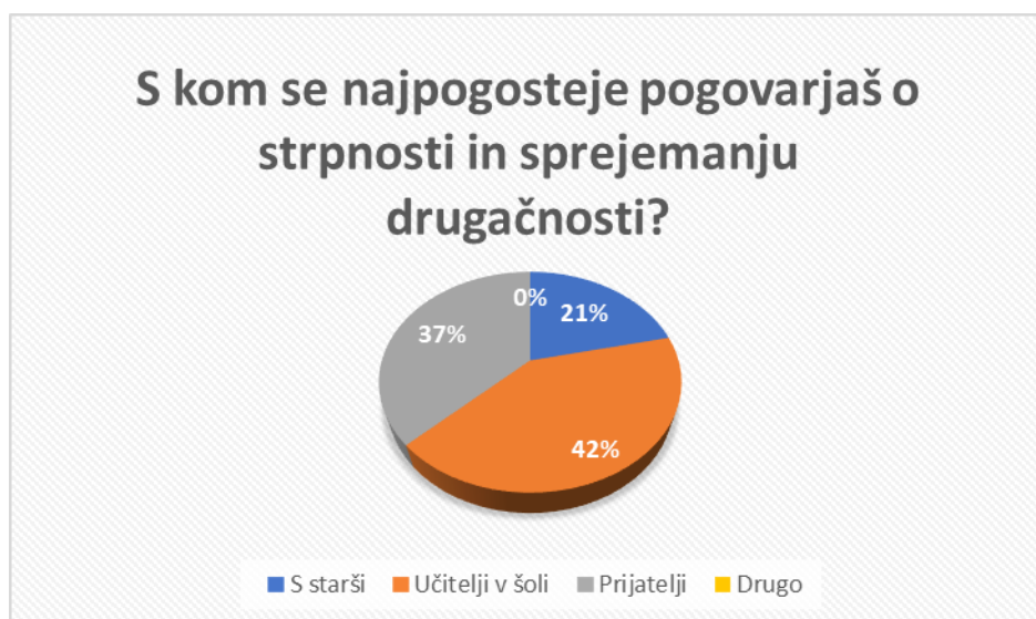
Graf 4: S kom se najpogosteje pogovarjaš o strpnosti in sprejemanju drugačnosti?

Analiza podatkov o tem, s kom se učenci najpogosteje pogovarjajo o strpnosti in sprejemanju drugačnosti je pokazala, da se učenci najbolj pogosto o strpnosti in sprejemanju drugačnosti pogovarjajo z učitelji v šoli (41,43 %) in prijatelji (37,14 %). Le 30 učencev (21,43 %) je odgovorilo, da se je o strpnosti in sprejemanju drugačnosti najpogosteje pogovarjalo s svojimi starši.