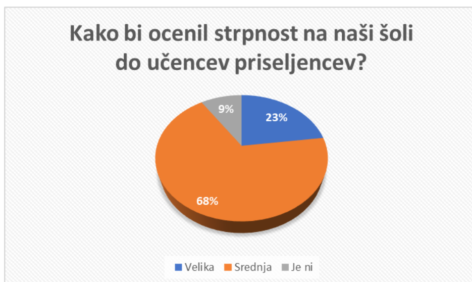
Graf 5: Kako bi ocenil strpnost na naši šoli do učencev priseljencev?

Tabela in Graf številka 5 prikazujeta podatke o oceni strpnosti na naši šoli do učencev priseljencev. Po analizi rezultatov smo ugotovili, da je največ anketiranih učencev (67,86 %) mnenja, da je na naši šoli srednja strpnost do učencev priseljencev. Manj učencev (22,86 %) bi strpnost na naši šoli ocenili kot veliko. Manjši delež pa je tistih učencev (9,29 %), ki menijo, da smo do učencev priseljencev nestrpni.