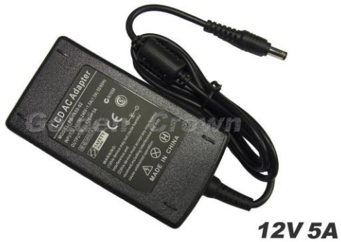
Slika 3 Napajalna enota 12 V

Napajalna enota pretvarja omrežno napetost v nizkonapetostno regulirano enosmerno napajanje za notranje komponente računalnika ali kakšne druge naprave. V tej raziskovalni nalogi sva uporabila 2 napajalni enoti. Z 12 V napajalno enoto napajava LED diode , 5 V napajalna enota pa napaja Raspberry Pi.