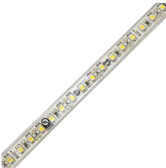
Slika 8 LED trak

LED trak je prilagodljivo vezje, na katerem so nameščene svetleče diode (SMD, LED) in druge komponente, ki ponavadi prihajajo z lepilno podlago. Uporablja se za poudarjeno osvetlitev, osvetlitev ozadja in dekorativne svetlobne učinke v prostoru. LED trakovi so lahko v enobarvni in večbarvni izvedbi. Pri gradnji pametnega ogledala sva uporabila enobarvni LED trak. Ta je sestavljen iz niza LED diod iste barve, ki pokrivajo območje vidnega spektra od 400 do 700 nanometrov v valovni dolžini. Trakove sva namestila na zadnjo stran okvirja ogledala.