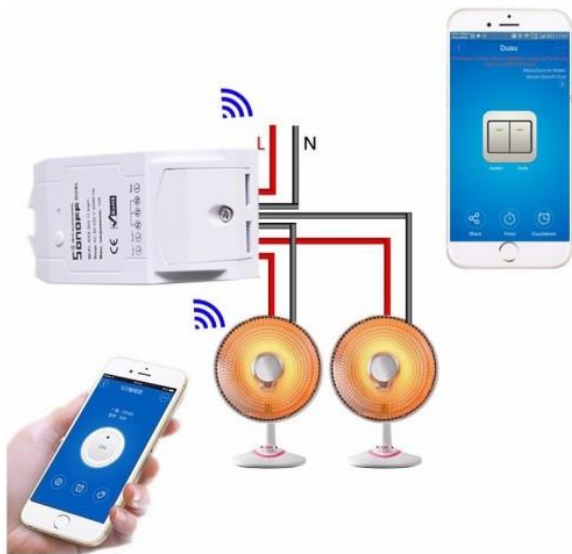
Slika 4 Sonoff stikalo

Sonoff WIFI stikalo je pametno stikalo, ki uporabnikom omogoča pametno kontrolo elektronskih naprav . To je stikalo za daljinsko upravljanje, ki se lahko poveže z veliko različnimi napravami. Električno stikalo prenaša podatke na platformo v oblaku preko WiFi Routerja, ki uporabnikom omogoča oddaljeno upravljanje vseh priključenih naprav prek mobilne aplikacije eWeLink. Tako lahko preko pametnega telefona prižigava in ugašava pametno ogledalo . Vgradnja stikala poteka tako da na stikalo pripeljemo dovodni fazni in nevtralni vodnik iz omrežja , ter iz stikala povežemo fazni in nevtralni vodnik z porabnikom.