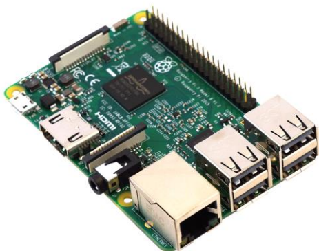
Slika 1 Raspberry Pi

V najini raziskovalni nalogi sva uporabila najnovejšo verzijo Raspberry Pi 3, katera ima 1.4GHz 64-bitni štiri-jedrni procesor, dvojno brezžično omrežje LAN in Bluetooth 4.2