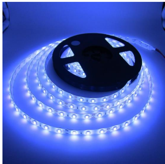
Slika 7 Praktični prikaz LED trak-a