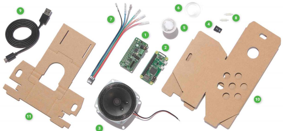
Slika 5 Komponente google voice kita