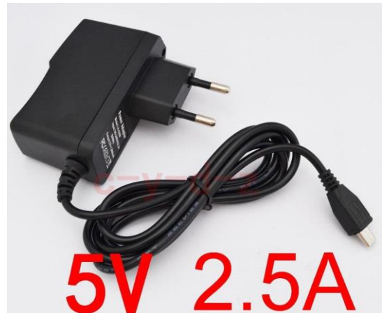
Slika 2 Napajalna enota 5V