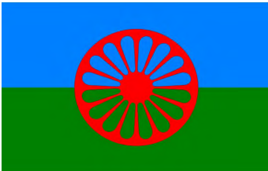
Slika 1: Romska zastava