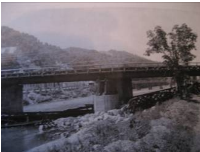
Slika 3, Poškodovan prvi železniški most v smeri proti Laškem

Nemogoče je ugotoviti število ranjenih. Podatki o njih so navedeni le v manjšem številu poročil. Ugotovitev točnega števila onemogoča še dejstvo, da so za večino napadov ohranjena le prva poročila, nastala še isti dan. Nekateri poškodovanci so kasneje umrli.