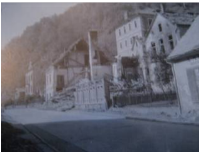
Slika 4, Zgradbe na Bregu so bile pogosto žrtev letalskih bomb.