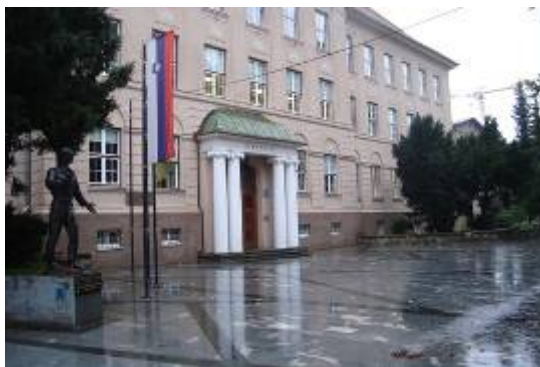
Slika 15 - I. gimnazija v Celju

Je ena najstarejših gimnazij v Sloveniji. Ustanovljena je bila leta 1808. Od ustanovitve pa do leta 1895 je pouk potekal samo v nemškem jeziku. Gimnazija je delovala na več mestih, na današnjem pa stoji že vse od leta 1914. V preteklosti je nosila ime Gimnazija Celje in Srednja družboslovna šola, leta 1990 so I. gimnaziji v Celju povrnili status gimnazije. Danes gimnazija dosega visoke rezultate na športnem in umetniško-kulturnem področju. 29