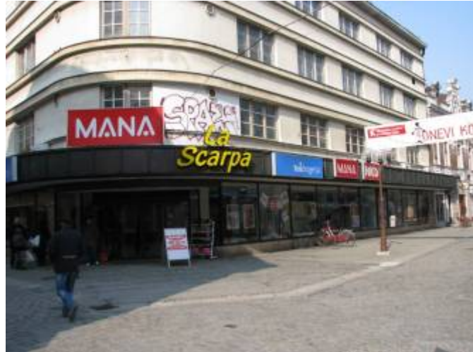
Slika 23 - Središče Celja

Celje je zgodovinsko in kulturno bogato mesto. V samem mestnem jedru je veliko zgradb in poslopij, ki so vredne ohranitve in varstva. Vendar se danes ljudje tega premalo zavedamo. Zvestno uničujemo lastno kulturno dediščino. Pri tem imava v mislih risanje grafitov po stavbah v samem mestnem jedru. Predlagava, da bi v Celju izkoristili razne zanemarjene zidove, podvoze in podhode za poslikavo z grafiti. Mladim bi tako dali svobodo pri ustvarjanju, stavbe pa bi bile prav gotovo manj porisane in popisane.