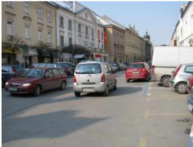
Slika 21 - Gneča v mestu

Prav tako bi bilo potrebno urediti parkirna mesta. Generalno gledano, v Celju primanjkuje parkirišč, vendar meniva, da povečanje le-teh ni rešitev. Vpeljati bi bilo potrebno mestni avtobus, ki bi ljudem nudil hitre in ugodne prevoze do samega mestnega središča. Kot sva že pri anketi ugotavljali, bi javni prevoz uporabila večina ljudi, seveda bi morale biti cene dostopnejše, ali pa bi bil prevoz brezplačen.