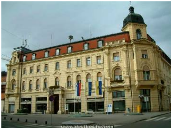
Slika 11 - Narodni dom Celje

V Narodnem domu se danes odvijajo številne prireditve, koncerti, poslovna in strokovna srečanja, okrogle mize ter seje Mestnega sveta Mestne občine Celje. 23