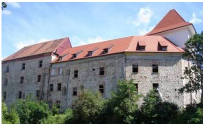
Slika 5 - Spodnji celjski grad danes

Spodnji celjski grad so dali postaviti Celjski grofje, saj so želeli poleg gradu nad mestom imeti udobnejšo palačo še v mestu. Gradec je imel tudi svoj obrambni jarek, ki je še danes lepo viden. Sprva je služil kot rezidenca Celjskih grofov, nato pa kot sedež celjskega vicedoma. V času Marije Terezije so ga preuredili (v vojašnico) in ga pustili v slabem stanju. Od leta 1984 ga prenavljajo in raziskujejo. Pod gradom so odkrili tudi del rimske ceste (Celeia). Drugače pa grad služi predvsem kot turistična točka. 16