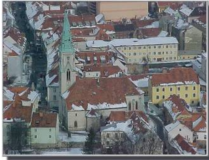
Slika 13 - Cerkev sv. Danijela

Je celjska farna cerkev, postavljena okoli leta 1306. Po l. 1379 so jo po gotško križno-rebrasto obokali ter pozidali zvonik in prezbiterij. Do sredine 16. stoletja je cerkev s številnimi prezidavami dobila sedanjo obliko. Cerkvi so leta 1413 prizidali kapelo Žalostne Matere božje, ki velja za izjemno kvalitetno arhitekturo klasične gotike. V stavbo in njene zunanje stene je vzidanih več plastično oblikovanih srednjeveških in renesančnih nagrobnikov iz 15., 16. in 17. stoletja. Pred glavnim vhodom v cerkev so leta 1996 odkrili spomenik blaženemu škofu Antonu Martinu Slomšku. 27