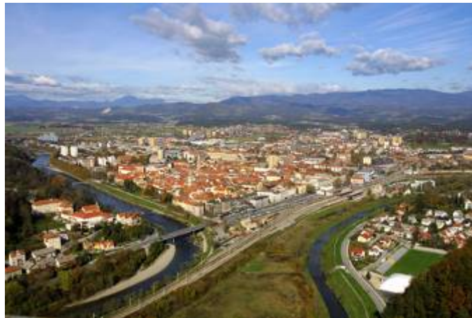
Slika 2 - Pogled na Celje iz Starega grada

V občini je leta 2008 živel 50.039 prebivalcev, moških 24.834 in žensk 25.205, zaposlenih v družbenem in zasebnem sektorju, saj je v mestu veliko delovnih mest. V samem mestu je pet hotelov in en mladinski hotel. Število prodajaln, manjših in večjih, se je v zadnjem desetletju kar podvojilo in tako se Celje postaja vse bolj trgovsko središče. V Celju je danes vrsta srednjih in osnovnih šol. Ima svoje mestno gledališče, Pokrajinski muzej in Muzej novejši zgodovine, likovne galerije, kino, knjižnico... 8