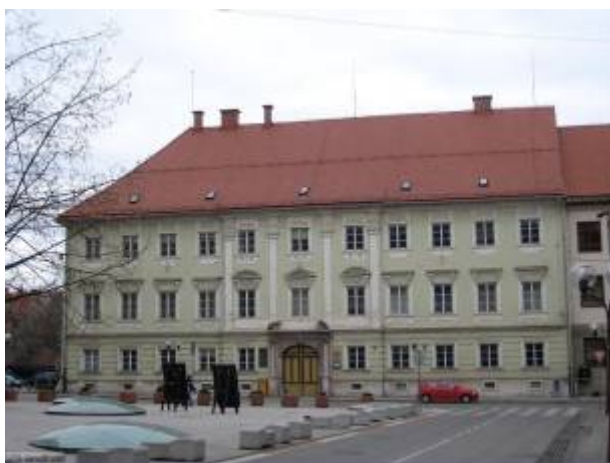
Slika 8 - Prothasijev dvorec

Gre za najlepšo baročno stavbo v starem mestnem jedru. Dvorec je dal v 70. letih 18. stoletja zgraditi lastnik gradu Planina, grof Anton pl. Prothasi. V stavbi je bil od leta 1825 okrožni urad, nato pa do leta 2001 dom celjskega arhiva. V njem je danes celjska poročna dvorana. 18