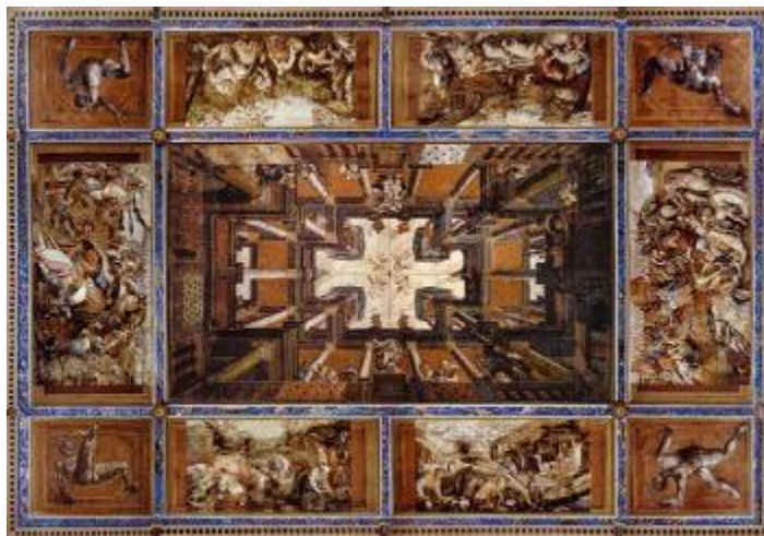
Slika 7 - Celjski strop