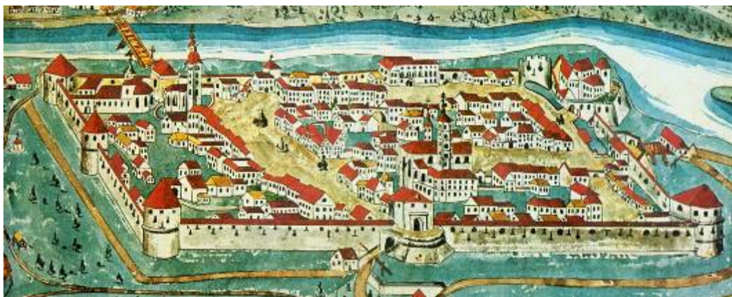
Slika 17 - Srednjeveško Celje