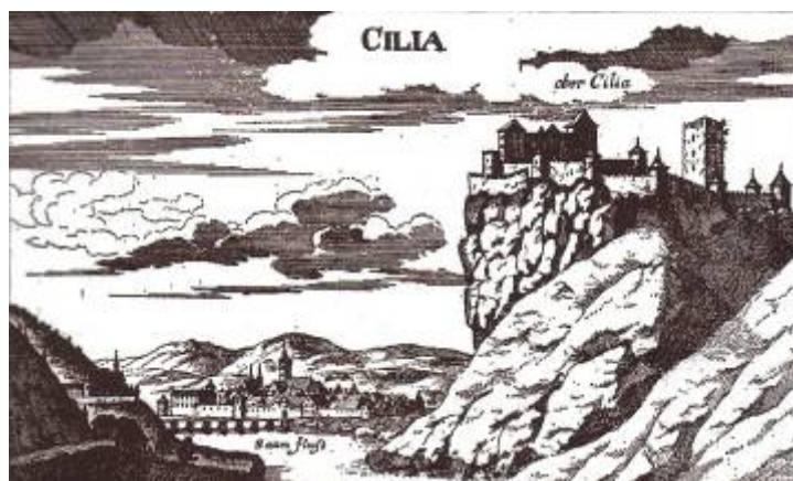
Slika 3 - Celjski grad nekoč

Grad je začel propadati kmalu po tem, ko je izgubil svoj strateški pomen. Skozi stoletja so grad obnavljali, vendar se je ta spreminjal v pravo razvalino. Zadnji prebivalci so v njem živeli še leta 1795. Celjsko Muzejsko društvo je leta 1882 začelo z obnovo gradu, ki še vedno traja. Med 2. svetovno vojno je bil zapuščen, po njej pa se je začela intenzivna prenova. Grad že dobiva svojo prvotno podobo. 14