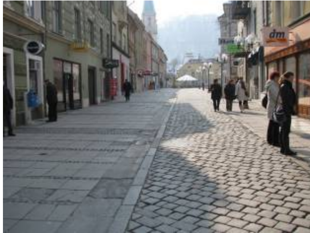
Slika 28 - Prazne ulice Celja

Zakaj torej Celje ne ukrepa v tej smeri? Naredimo boljšo prihodnost, povezanost mesta in ljudi v njem.