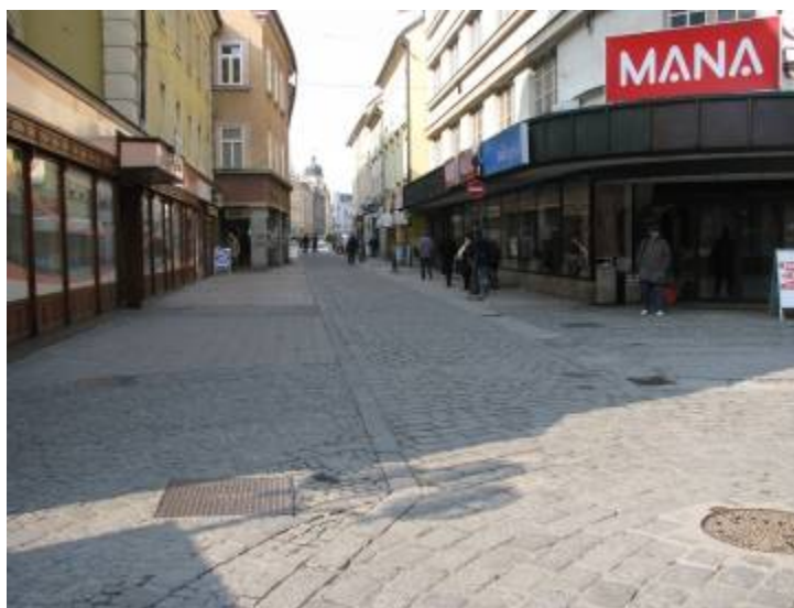
Slika 27 - Prazne ulice Celja

Meniva, da bi morali mestno jedro narediti prijaznejše mladim ljudem. Sprašujeva se, zakaj je jedro živahno in polno le čez teden ob dopoldnevih. Zakaj ne bi ljudi privabili v knežje mesto tudi ob vikendih in zakaj ne bi popoldne ljudje prišli v mesto s tem namenom, da se usedejo v kakšno kavarno in uživajo. Ugotovili sva, da večina zaposlenih ljudi hodi v mesto popoldan le v lekarno ali pa vozijo svoje otroke v Glasbeno šolo Celje. Misliva, da bi boljša gostilniška ponudba mesto na nek način ponovno oživila.