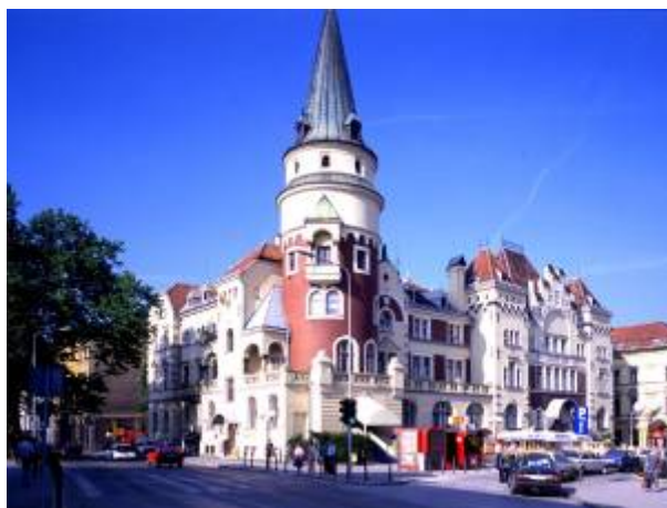
Slika 12 - Celjski dom

Celjski dom je stavba v Celju nasproti glavne stavbe železniške postaje. Zgrajena je bila v novogotskem slogu med letoma 1905 in 1906 po načrtih dunajskega arhitekta Branga. 24