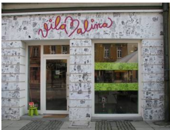
Slika 22 - Vila Malina

Eden izmed problemov je tudi odtujenost med ljudmi (ni občutka skupnosti). Predlagava večjo promocijo samih delavnic oz. dejavnosti (Vila Malina, Lenka + Škrat, Osrednja knjižnica Celje – oddelek za otroke).