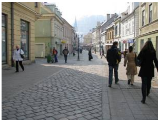
Slika 19 - Mesto Celje

Prebivalstvo mestnega jedra je starejše, zato številni Celjani menijo, da bi bilo potrebno v mesto priseliti mlajše družine, saj le-te živijo na obrobju mesta in ne zahajajo pogosto v samo mestno jedro.