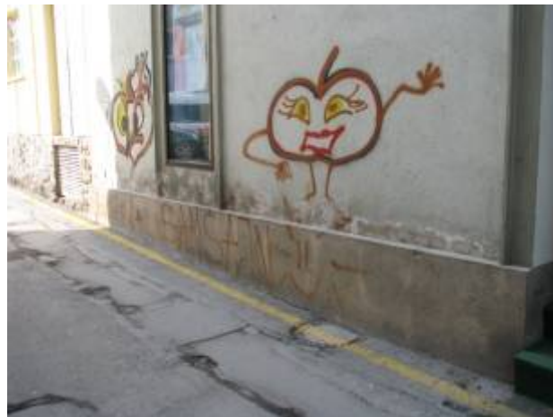
Slika 25 - Grafiti v Celju