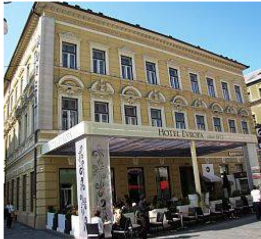
Slika 18 - Hotel Evropa

Janez Koželj pa je v svoji predstavitvi omenil, da bi Celje morale uvesti več igrišč za otroke in zelene strehe. Pri tem je imel v mislih zelene površine na strehah poslopij v mestnem jedru. Meniva, da bi bili to preveliki posegi v samo mesto, zato se s to idejo oz. predlogom ne strinja.