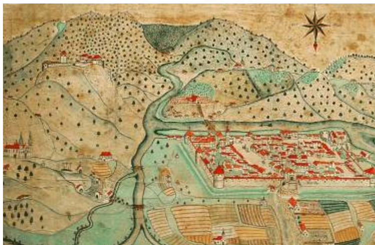
Slika 1 - Srednjeveško Celje

Kasneje so se prebivalci mesta obranili z obzidjem zgrajenim leta 1473 pred Turki ter v času slovenskih kmečkih uporov pred kmeti, ki so zasegli Stari grad. V 19. stoletju je Celje po porazu Avstrije v avstrijsko-pruski vojni postalo del Avstro-Ogrske. V nadaljnjih letih se je število prebivalcev vztrajno povečevalo, Celje pa se je širilo kot moderno mesto. 6