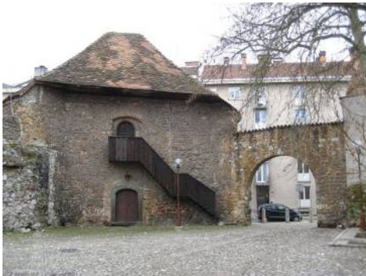
Slika 6 - Vodni stolp

Vodni stolp ali JV vogalni stolp je dobil ime po bližini vode. Je nižji od SZ zaradi zaščite hribov ter reke Savinje. Lepo se vidi mitnica, kjer sta zapisana datum 25. september in letnica 1672, ki označujeta grozno poplavo, ki se je zgodila v Celju. Na mitnici je upodobljena tudi roka, ki kaže gladino vode in je približno 1,5 metra nad tlemi, a moramo upoštevati, da so bila včasih tla nižja.