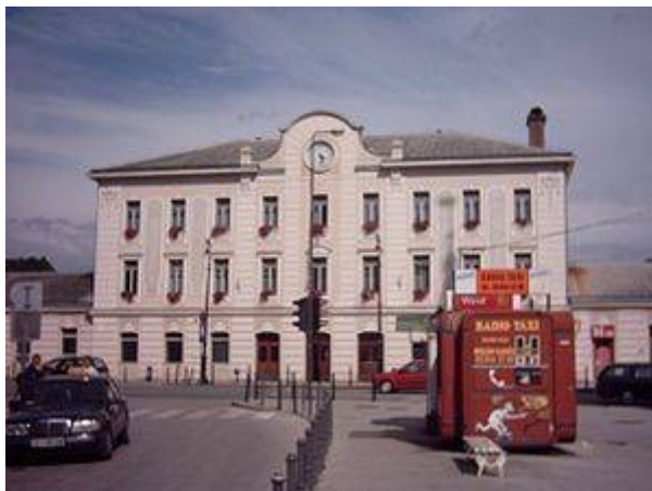
Slika 9 - Železniška postaja Celje