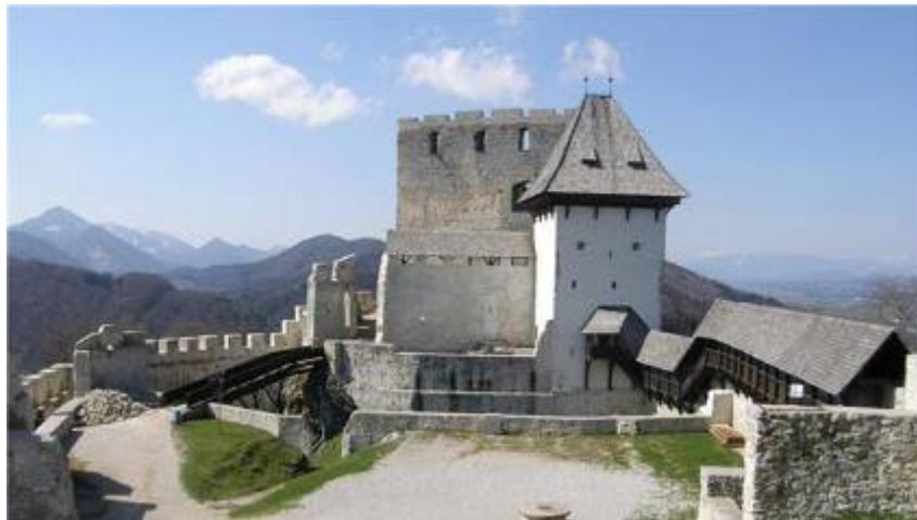
Slika 4 - Celjski grad danes

Turistično društvo Celje v poletnem času vsako leto organizira prireditev »Pod zvezdami Celjanov« (prikaz življenja v srednjem veku), ki na grad privabi veliko ljudi. Celjski grad je danes ena izmed glavnih turističnih točk v Sloveniji (letno okoli 60.000 obiskovalcev). Vsako leto tu potekajo tudi Veronikini večeri. Morda se z večjim interesom in trudom gradu obetajo boljši časi, v nasprotju z znano krilatico, ki se ga drži »Danes grofje Celjski in nikdar več«. 15