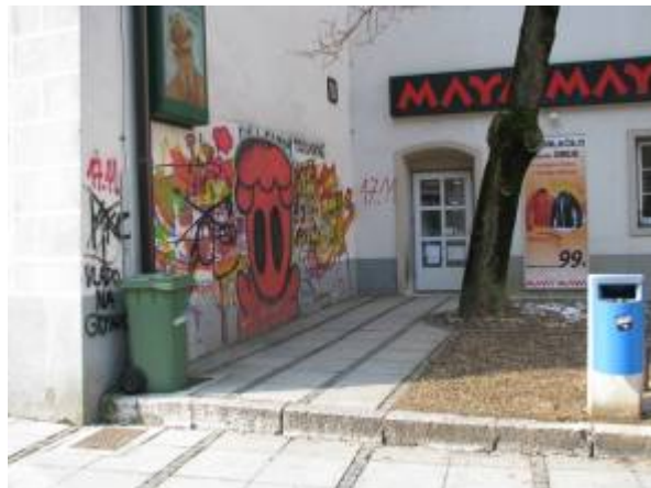
Slika 24 - Grafiti v Celju

Celje je zgodovinsko in kulturno bogato mesto. V samem mestnem jedru je veliko zgradb in poslopij, ki so vredne ohranitve in varstva. Vendar se danes ljudje tega premalo zavedamo. Zvestno uničujemo lastno kulturno dediščino. Pri tem imava v mislih risanje grafitov po stavbah v samem mestnem jedru. Predlagava, da bi v Celju izkoristili razne zanemarjene zidove, podvoze in podhode za poslikavo z grafiti. Mladim bi tako dali svobodo pri ustvarjanju, stavbe pa bi bile prav gotovo manj porisane in popisane.