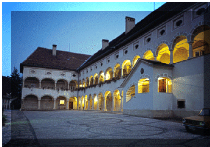
Slika 14 - Stara grofija