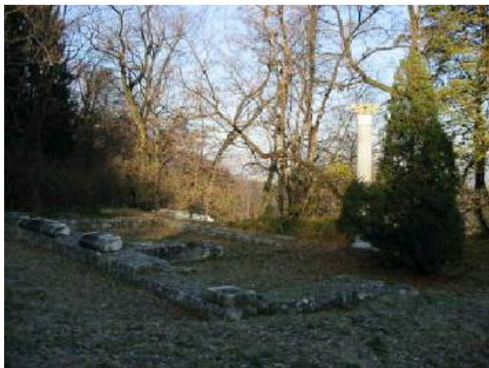
Slika 16 - Herkulovo svetišče

Po končanem izkopavanju so temelje svetišča pustili nepokrite. Da bi bila vidna prvotna višina, so postavili tri stebre, enega s kapitelom.