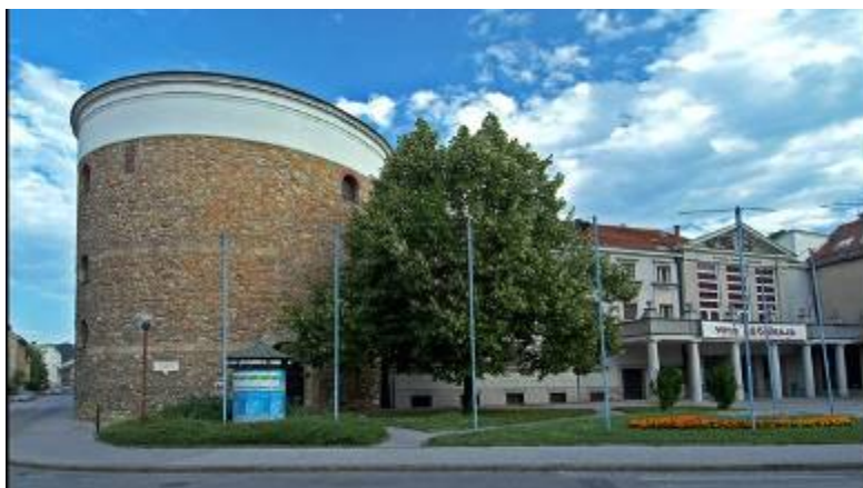
Slika 10 - Slovensko ljudsko gledališče Celje

Severozahodni obrambni stolp nekdanjega mestnega obzidja je danes sestavni del Slovenskega ljudskega gledališča, ki je bilo zgrajeno leta 1885. Že od leta 1825 je stolp, v katerem je bila nekoč mestna ječa z mučilnico, služil potujočim igralskim družinam. 1849 so v stolpu prvič odigrali Linhartovo Županovo Micko v slovenskem jeziku. V spomin na ta dogodek visi danes nad vhodom v gledališki stolp spominska tabla. 21