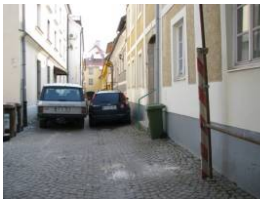
Slika 20 - Neprehodna ulica v Celju

Meniva, da bi bilo v določenih ulicah potrebno preprečiti motorni promet in tako v mesto vpeljati več komunikacije med mestom in ljudmi (sprehajalci in kolesarji). Morda bi se lahko Celje zgledovalo po Ljubljani, ki se je spretno izognila prometnim konicam v samem mestnem jedru.