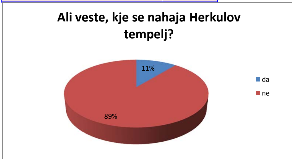
Graf 3 - Ali veste kje se nahaja Herkulov tempelj?

Glede na razvoj samega prometa v mestu, sva želeli izvedeti, ali bi anketiranci uporabili avtobus za vožnjo po Celju, če bi bil le ta zastoj. Na vprašanje je 107 anketirancev odgovorilo z da, in 3 z ne.