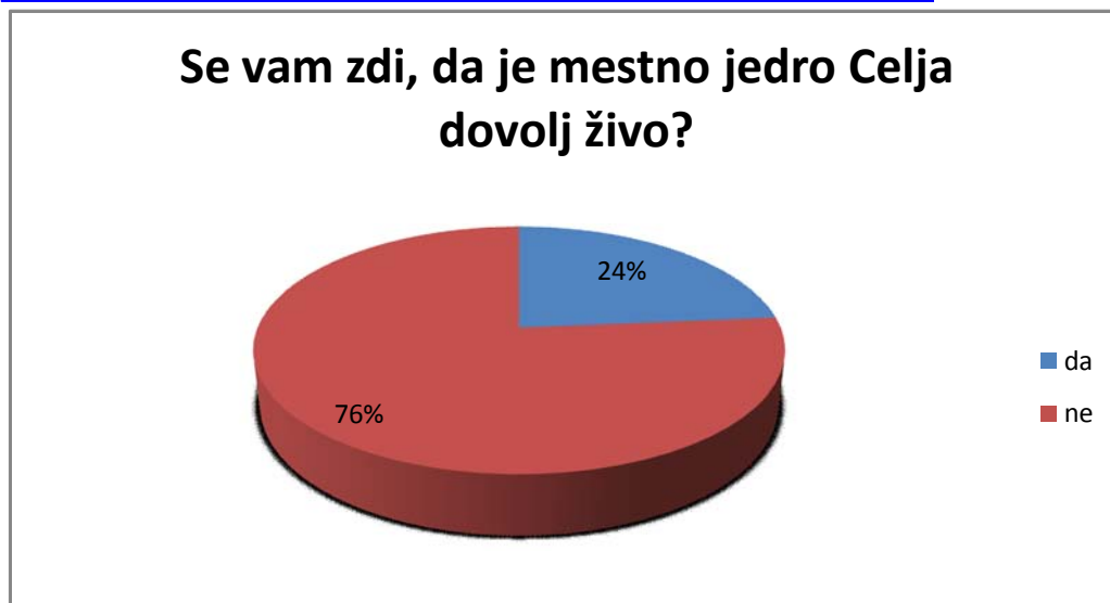
Graf 2 - Se vam zdi, daje mestno jedro Celja dovolj živo?

V tretjem vprašanju naju je zanimalo, kam se ljudje največkrat odpravijo v mestnem jedru. Dobili sva zelo podobne odgovore. Največ anketirancev, kar 71 se jih odpravi v službo. Anketiranci, mlajši od 20 let, se največkrat odpravijo v šolo, glasbeno šolo ali knjižnico. 12 anketirancev je omenilo, da se v mestnem jedru največkrat odpravijo v trgovine z oblačili ali obutvijo. Trije ljudje obiščejo mestno jedro zaradi dobrih restavracij.