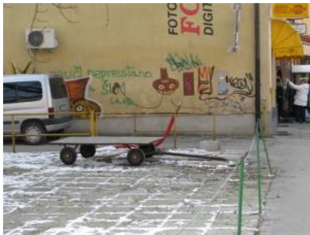
Slika 26 - Grafiti v Celju

Predlagava, da začne Celje več pozornosti posvečati Herkulovemu svetišču (ki spada tudi pod Unesco-vo dediščino). Danes je zapuščen in zarasel. Redko kdo izmed Celjanov ga sploh pozna. Meniva, da bi ga bilo potrebno urediti in promovirati.