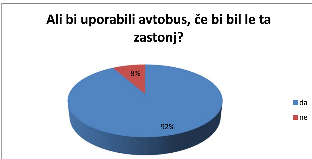
Graf 4 - Ali bi uporabili avtobus, če bi bil le ta zastoj?