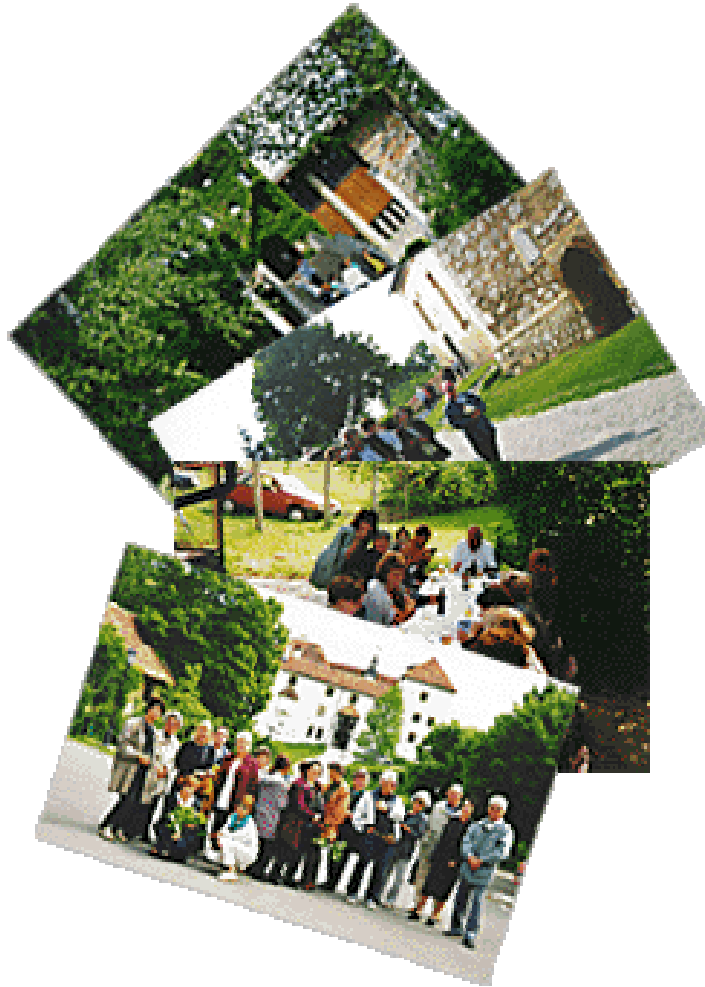
Slika 3: Utrinki z druženje članov na Univerzi tretje življenjsko obdobje Celje