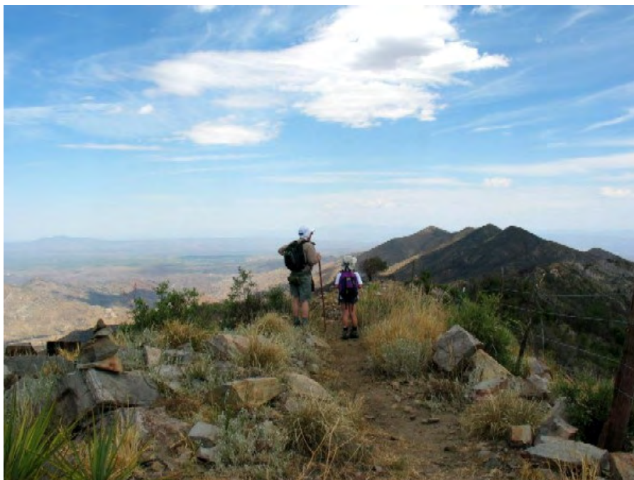
Slika 6: Utrinki iz skupnega izleta članov