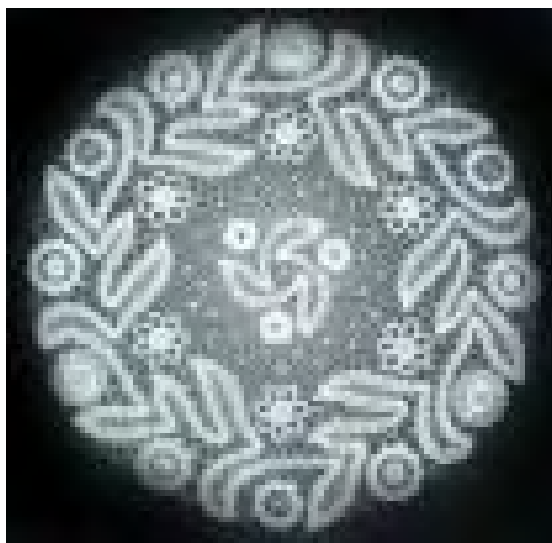
Slika 7: To je nastalo pod rokami članov klekljarskega krožka