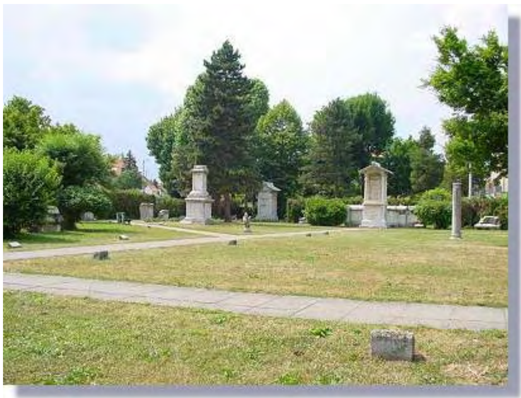
Slika 4: Rimska nekropola v Šempetru