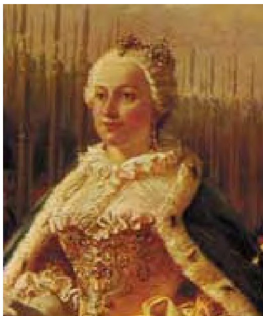
Slika 1: Marija Terezija

Gospodarska politika časa je v veliki meri temeljila na merkantilističnih načelih. Trgovino, obrt in začetek razvoja industrije so intenzivno spodbujali. Pod Marijo Terezijo se je število manufaktur možno povečalo.